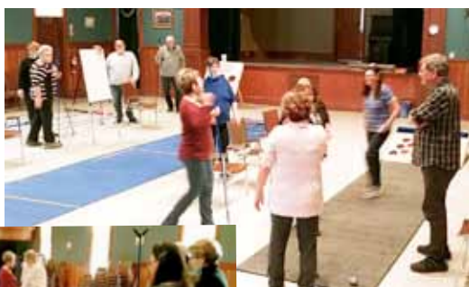
LES LUNDIS (SALLE PAROISSIALE)

ON NE S'ENNUIE PAS AUX PÉRIODES D'ACTIVITÉS DES AMIS DES AÎNÉS,