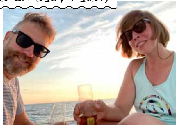
Apéro sur Big Fish, traversée West palm beach - Bahamas, décembre 2021