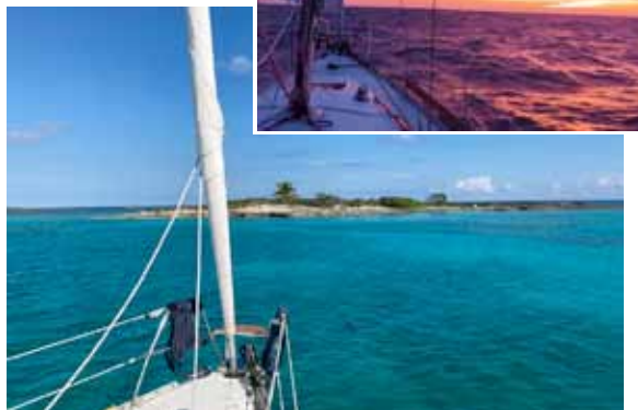
Coucher de soleil sur l'Atlantique, novembre 2021