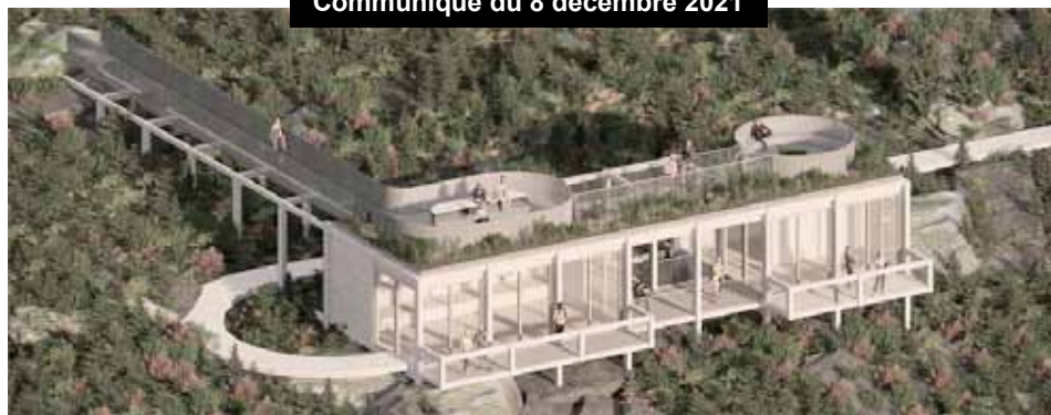
Crédit : Architecture : Mainstudio architecture et Atelier 5 – Architecture du paysage : Rousseau Lefebvre

Le projet Fenêtre sur les bélugas se veut une alternative à l'observation en mer de cette espèce menacée. Il met en relation les deux sites d'observation terrestre actuels, Pointe-Noire et Baie-Sainte-Marguerite, avec le futur site d'observation terrestre de la montagne de Gros-Cacouna. Le projet comprend un volet récréotouristique et un volet scientifique.