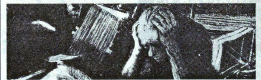
AGONE • Philosophie, Critique & Littérature • no 21, 1999, 240 pages