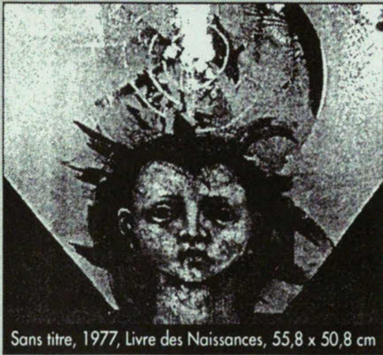
Sans titre, 1977, Livre des Naissances, 55,8 x 50,8 cm

On est tout de suite frappé par la gravité inquiétante de ces tableaux et par un fait dont on prend conscience en même temps: cette peinture n'est pas en tout premier lieu une peinture mais une pensée, profonde et de l'ordre de la vie et de la mort. Cependant, n'entendez pas par là que ce ne soit pas de l'art, et de l'excellent.