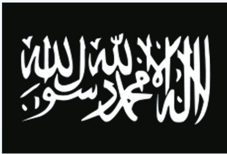
Drapeau du Jihad