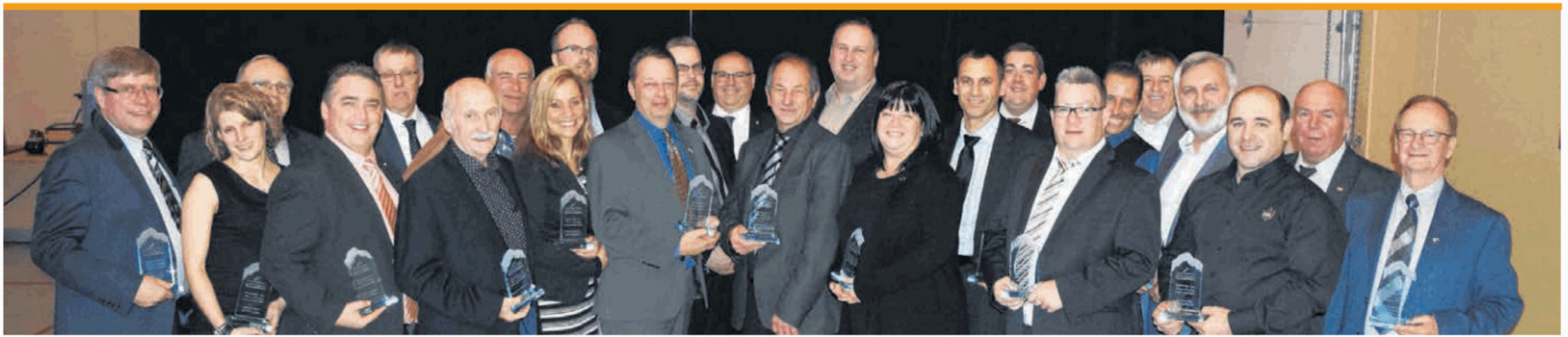
Plus d'une vingtaine de dirigeants sont montés sur scène recevoir une distinction pour l'implication de leur entreprise respective dans la communauté.

Chambre de commerce Bellechasse-Etchemins