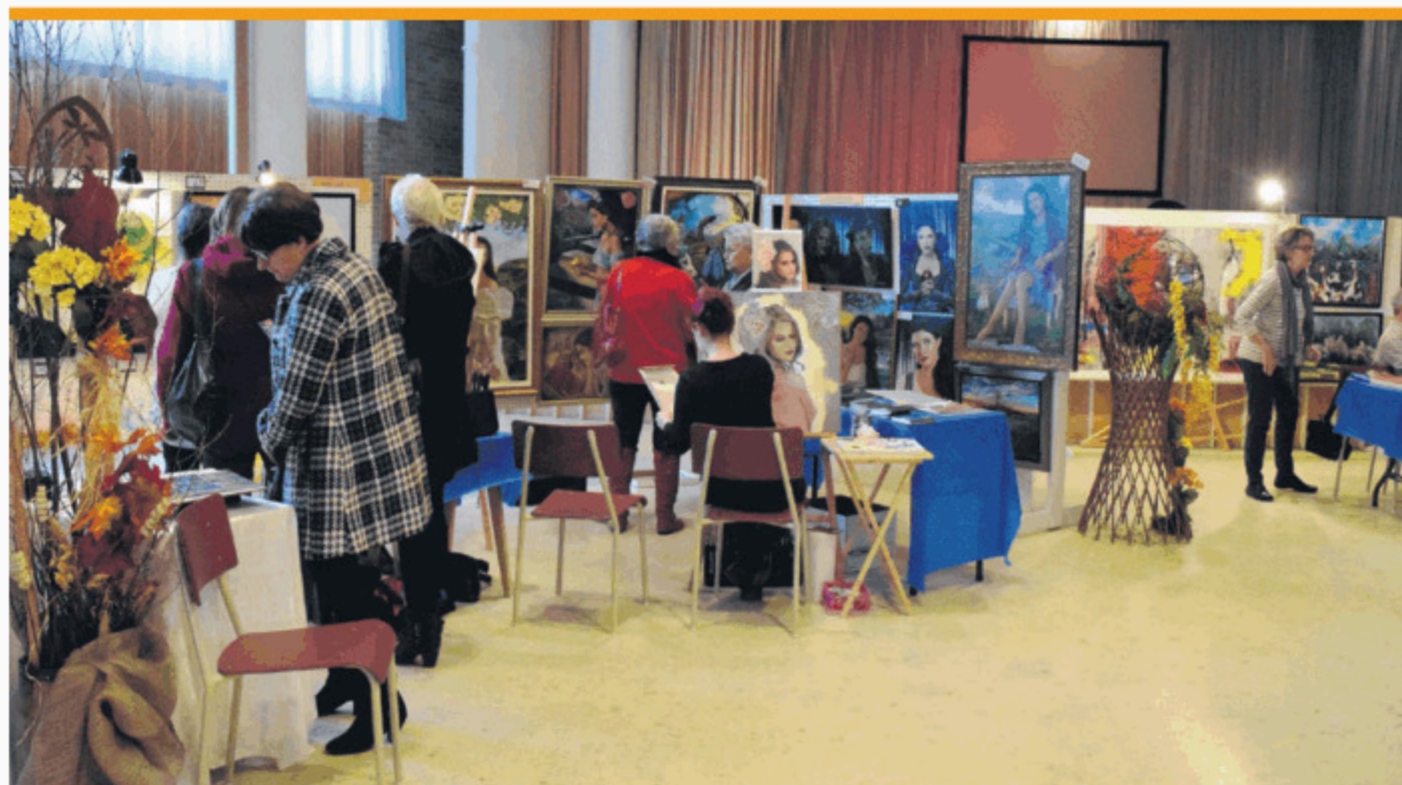
L'événement Expo-Arts fera une pause cette année, en raison de la dissolution prochaine du Carrefour culturel Bellechasse.