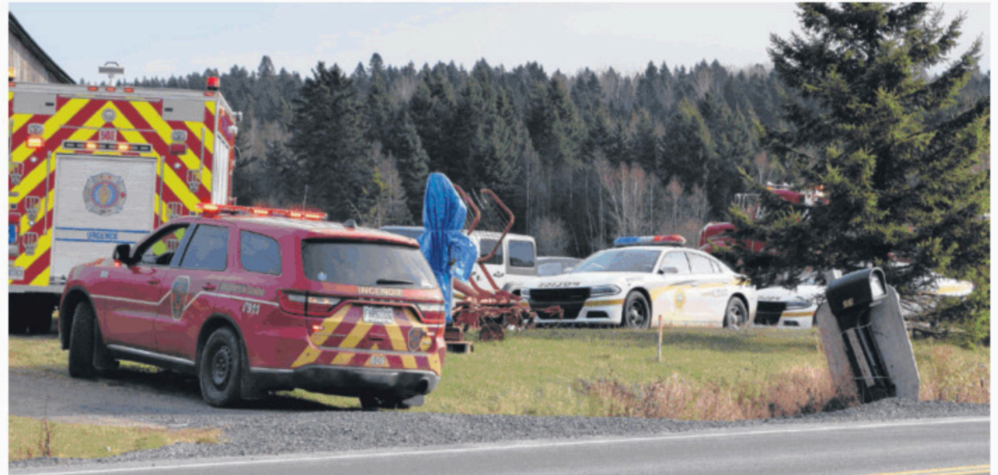
Pompiers et policiers ont été appelés sur les lieux à la suite de l'accident

L'investigation se fera en collaboration avec le Bureau du coroner qui émettra des recommandations par la suite.