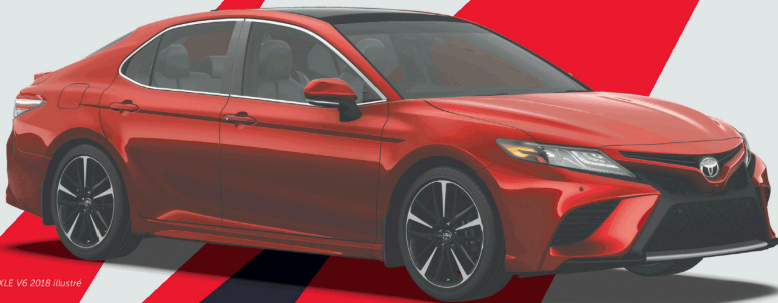
Modèle XLE V6 2018 illustré