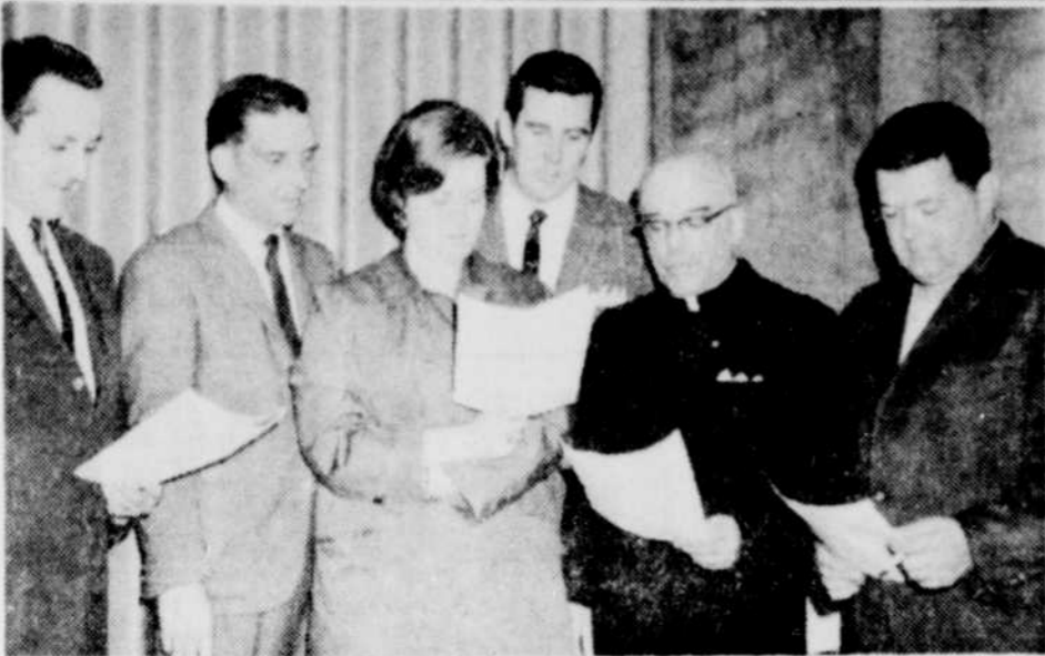
EXECUTIF DU CONSEIL CENTRAL — Les syndicats affiliés au Conseil central de Thetford ont procédé cette semaine à l'élection de leurs officiers pour 1967-68.