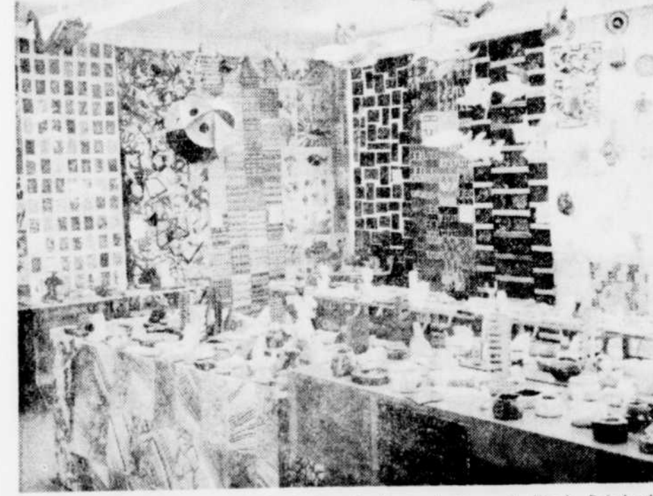
EXPOSITION — Une vue générale de la salle d'arts plastiques de l'école Raimbault où se tient l'exposition des travaux des élèves, réalisés au cours de la présente année scolaire.