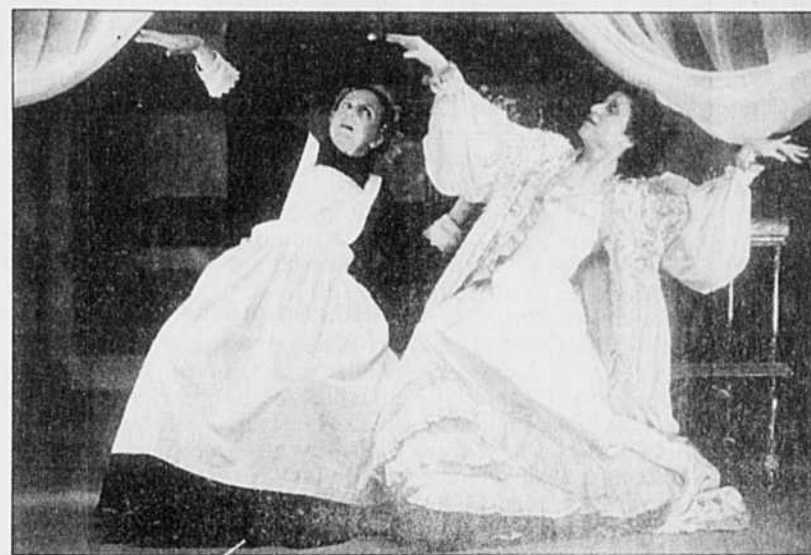
La Baronne et la Truie se compose d'une série de tableaux.

Un texte de Michael Mackenzie. Traduction: Paul Lefebvre. Mise en scène: Francine Alepin assistée de Jean Boillard. Scénographie: Annick La Bissonnière. Costumes: Maryse Bienvenu. Éclairages: André Naud. Musique: Judith Gruber-Stitzer. Avec Francine Alepin et Denise Boulanger. Une production d'Omnibus présentée à l'Espace libre jusqu'au 14 novembre 1998.