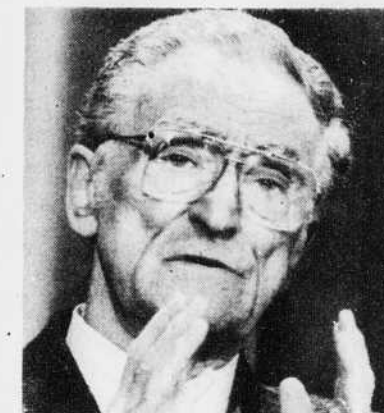
Claude Ryan, ministre de l'Éducation

utiliser cette phase de manière à faire progresser, de façon significative, la négociation.