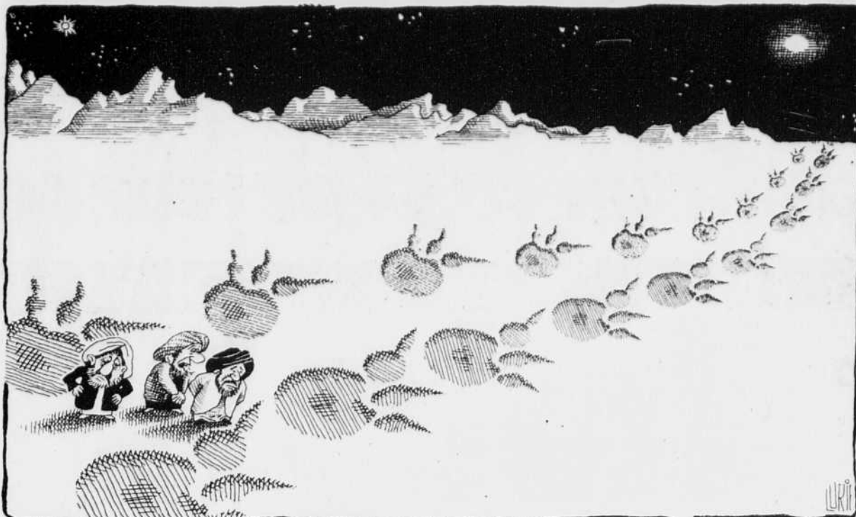
Il va falloir un leader hors de l'ordinaire pour suivre ses traces!...