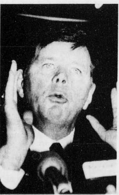
Le premier ministre Clyde Wells

des principes constitutionnels contre des kilowatts d'énergie, ni quoi que ce soit d'autre", a-t-il fermement déclaré.