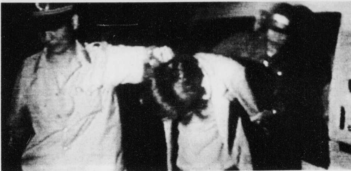
La télévision chinoise a annoncé de nouvelles arrestations de dissidents soupçonnés d'avoir participé aux récentes manifestations étudiantes. Sur la photo, l'un d'eux est amené pour interrogatoire...

me sans conscience qu'est Deng Xiaoping ont massacré des étudiants désarmés, des ouvriers et des gens du peuple... qui ne faisaient que réclamer des droits élémentaires — la démocratie et la liberté".