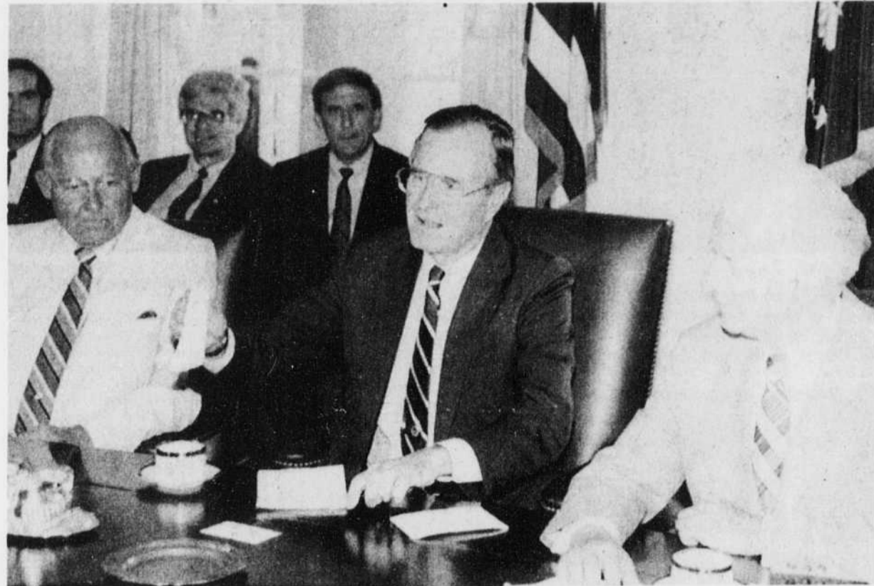
Le président américain George Bush a rencontré des représentants du Congrès pour leur expliquer son programme pour améliorer la qualité de l'air. A sa gauche, Bob Michel, le leader de la minorité à la Chambre des représentants, et à sa droite, le sénateur démocrate Robert Byrd.