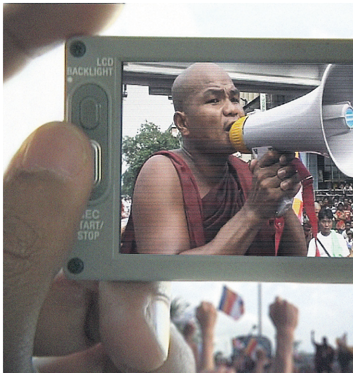
Burma VJ: Reporting From a Closed Country