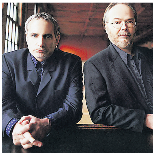
Le duo Steely Dan

Évoquant des « raisons exceptionnelles », le duo Steely Dan a annulé le spectacle qu'il devait donner, le 29 novembre prochain, à la salle Wilfrid-Pelletier de la Place des Arts. Le spectacle du 28 novembre est maintenu et marquera la conclusion de la tournée nord-américaine Rent Party Tour 09 . Les détenteurs de billets pour le concert annulé du 29 novembre sont invités à échanger leurs billets pour obtenir des billets pour le spectacle du 28 novembre. L'échange de billets doit se faire à la billetterie de la Place des Arts. Les détenteurs de billets peuvent également obtenir un remboursement à la billetterie.