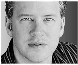
MARC CASSIMI CHRONIQUE

On ne vous dira pas tout ce qu'on a pensé du film Pour toujours les Canadiens , présenté hier soir en première mondiale devant 14 000 amateurs au Centre Belle-saison-pour-fêter-son-centenaire. Huis clos, comme dirait Jean-Paul Starr.