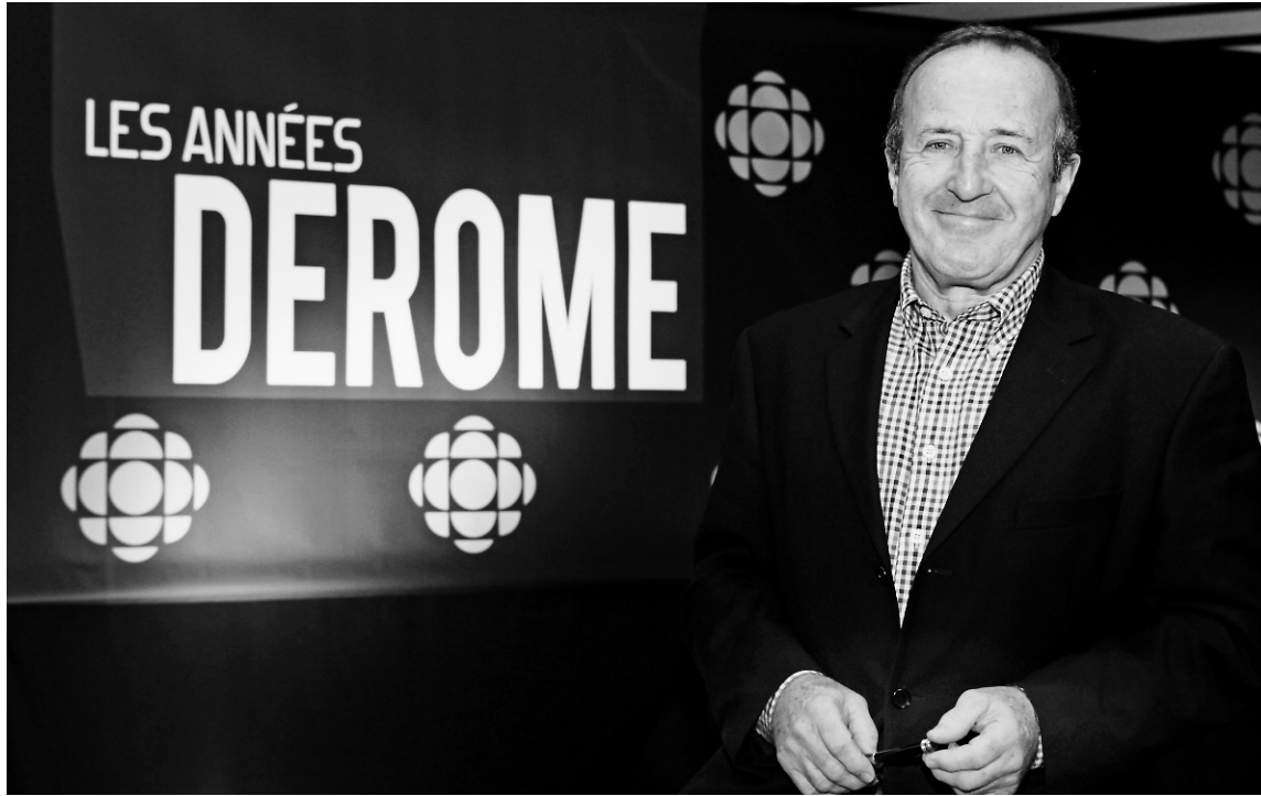
Les années Derome est une série documentaire en quatre volets qui porte sur les événements marquants des quatre dernières décennies. Le premier volet sera diffusé le jeudi 26 novembre à 20 h à Radio-Canada.

Choquette admet qu'il n'a jamais voulu négocier avec le FLQ, contrairement à Bourassa, qui a été tenté de le faire. «Je vais le laisser y aller, il va faire