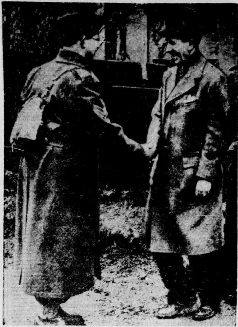
Lord Cranborne, secrétaire d'Etat pour les Dominions, serre la main au sergent suppléant Lee (à gauche), le seul soldat de carrière des détachements de Terre-Neuve à l'entraînement en Angleterre.