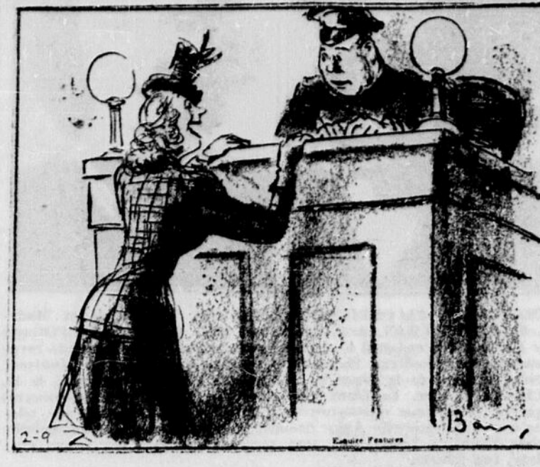
"Nous avons acheté tout récemment un auto usagé, par l'intermédiaire des annonces classées du 'Droit'. Je voudrais que vous nommez quelques agents de police pour me suivre jusqu'à ce que les autres gens s'habituent à ma façon de conduire."