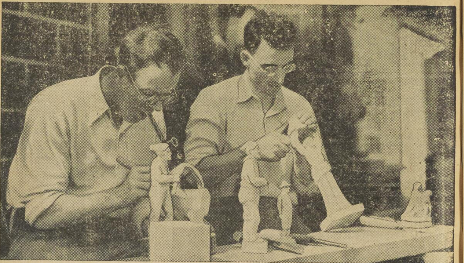
Les Frères Bourgeois, maîtres sculpteurs sur bois