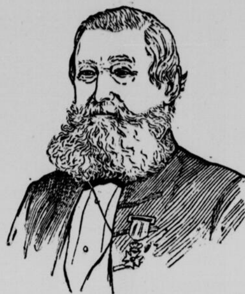
L'HON. JEAN-LOUIS BEAUDRY, DÉCÉDÉ (Voir Entre-Nous)

Rarement les femmes savent elles prendre de l'empire sur leurs passions ; elles se laissent toujours conduire par les caprices de l'amour et de la haine. Tel est le caractère de la plupart des belles femmes, surtout de celles qui ont moins de raison et de vertu que de beauté.