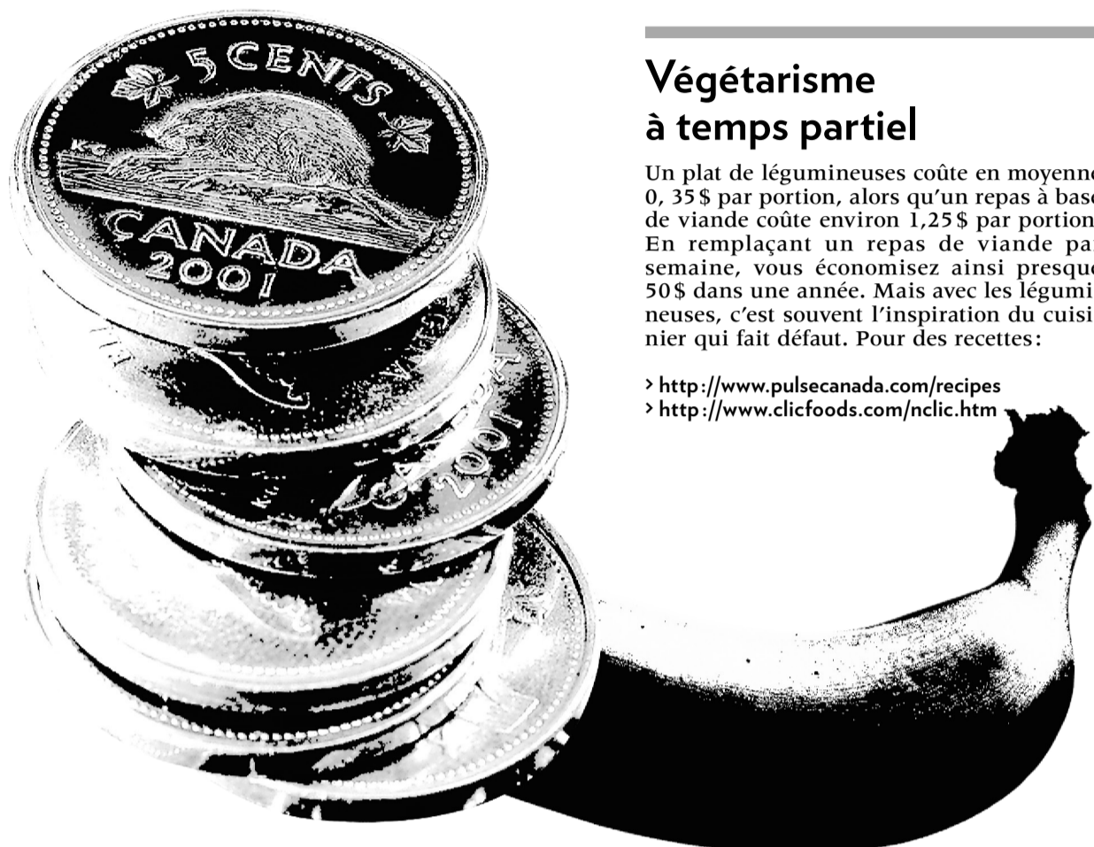
GRAPHISME ET ILLUSTRATIONS JACQUES-OLIVIER BRAS, LA PRESSE

20 Évitez les plats prêt à manger, les fruits et légumes déjà coupés en barquettes de plastique ou le fromage déjà râpé. On vous fait payer le gros prix pour des étapes de transformation qui ne prennent que quelques minutes.