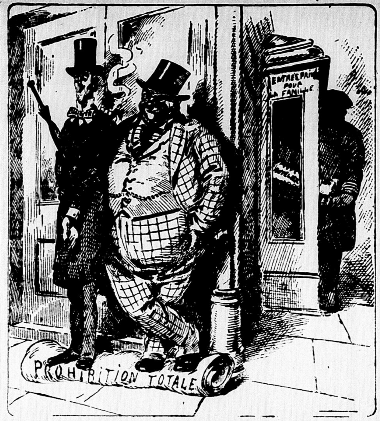
Les débits clandestins se sont effroyablement multipliés dans les provinces où règne la "prohibition totale", selon les statistiques recueillies par le gouvernement d'Ottawa. (Les Journaux.)

Rome, 25. — L'Italie élève les prétentions à mesure qu'approche l'heure du règlement final avec l'Allemagne. Une personnalité qualifiée nous a dit à ce sujet : — Lorsque les alliés seront tombés d'accord sur le montant du forfait, montant qui ne manquera pas de provoquer des contre-propositions allemandes, il nous faudra nous entendre sur la forme et les détails de paiement. Si, dans la fixation du chiffre de l'indemnité, il était tenu compte — comme les Allemands ne manqueraient pas de le réclamer — des colonies allemandes et de la flotte commerciale, qui ont déjà fait l'objet d'un partage, il va de soi qu'un avantage spécial devrait nous être consenti. — L'Italie, qui n'a eu aucune part des colonies ni de la flotte commerciale de l'Allemagne, serait fondée à demander en retour une majoration du pourcentage et un droit de priorité sur les encaissements. Si, par contre, la flotte et les colonies ne devaient pas entrer en ligne de compte dans le calcul de l'indemnité, alors, reconnaissez-le, l'Italie serait ici encore en droit de réclamer sa part d'une répartition faite en dehors d'elle.