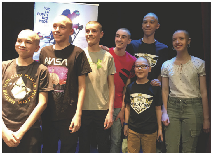
Depuis 14 ans, des étudiants du Séminaire de Chicoutimi participent au Rase-O-Thon Marie-Hélène Côté. Sur la photo, des participants de 2019.

Pour le Séminaire de Chicoutimi, la participation au Rase-O-Thon est une activité bien ancrée depuis 14 ans. Durant toutes ces années, 150 élèves ont mis leur tête à prix permettant ainsi d'amasser plus de 160 000 $. Tout a commencé en 2006 alors qu'une employée de l'école s'était fait raser la tête pour la cause. « Chaque année, je suis surprise de l'engouement des élèves et de leur détermination à atteindre leur objectif. L'événement permet non seulement d'inculquer des valeurs de partage, mais aussi de donner le goût aux élèves de s'impliquer comme futurs ambassadeurs de la fondation. C'est également une belle fierté pour les parents qui assistent à l'événement », souligne Chantale Bourbonnais.