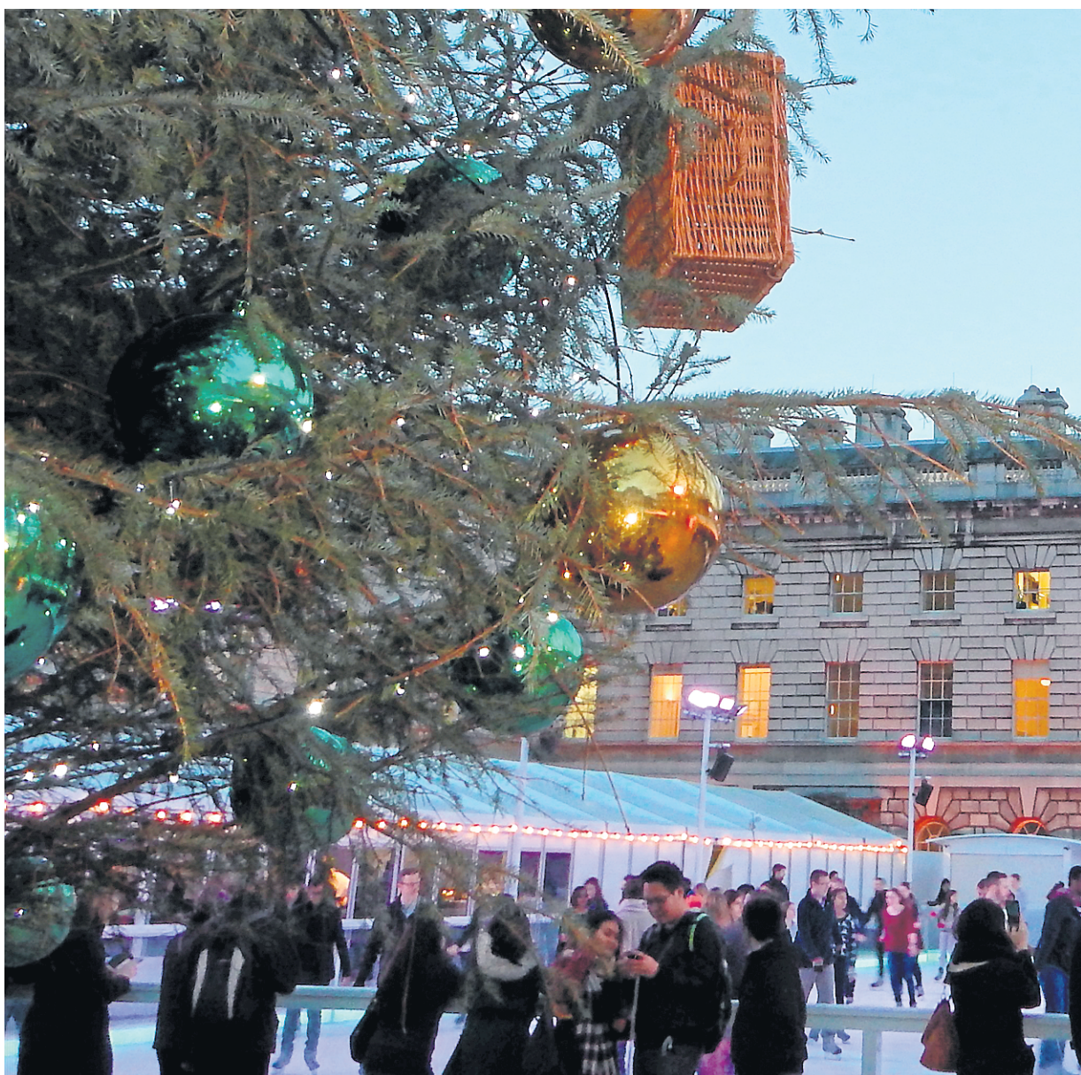
La patinoire de la Tour de Londres est fort achalandée pendant les Fêtes.

www.householddivision.org.uk/changing-the-guard-calendar