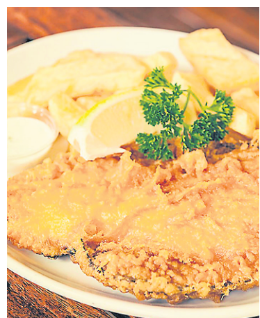
De délicieuses assiettes de fish & chips sont offertes à Londres.