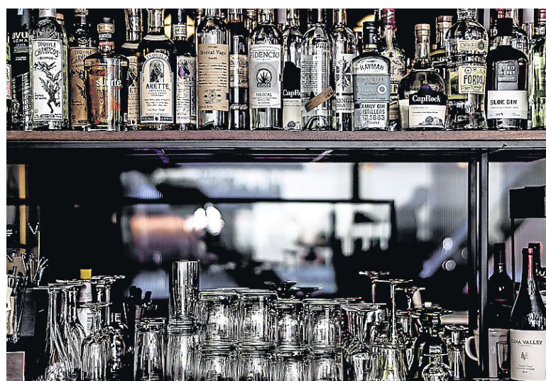
Le Benjamin Cooper est un petit bar aux cocktails créatifs.

La Californie étant la Californie, il faut au moins une fois s'arrêter pour manger quelque chose de vraiment grano, vraiment supposément santé, vraiment rempli de