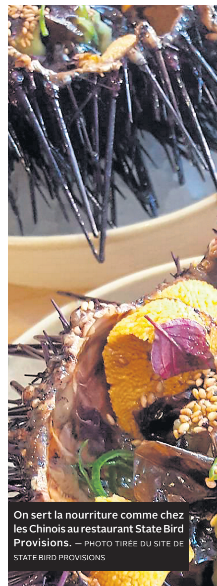
On sert la nourriture comme chez les Chinois au restaurant State Bird Provisions.

Daniel Patterson était autrefois le grand chef d'un restaurant très, très chic, le Coi, dans North Beach. Aujourd'hui, avec le roi de la cuisine de rue de Los Angeles, Roy Choi, il copilote ce casse-croûte d'Oakland aisément accessible par le réseau de transport BART à partir de San Francisco. C'est la deuxième succursale d'une chaîne