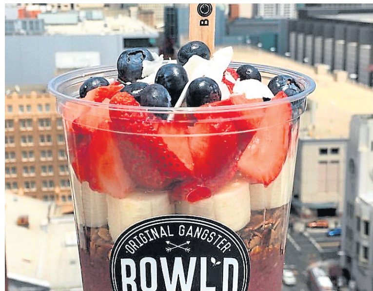
Le Bowl'd Acai est l'endroit idéal pour manger grano à San Francisco.

14 Mint Plaza, San Francisco bowl'dacai.com