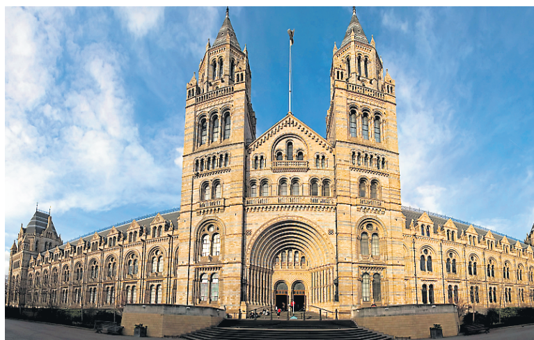
L'accès à tous les musées de Londres est gratuit, à commencer par le Musée d'histoire naturelle.