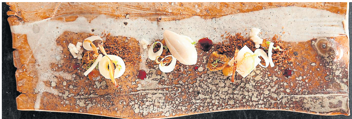
Plusieurs petits plats raffinés figurent au menu du Restaurant at Meadowood, une table étoilée située à St. Helena.

398 Geary Street, San Francisco hotelgsanfrancisco.com benjamincoopersf.com