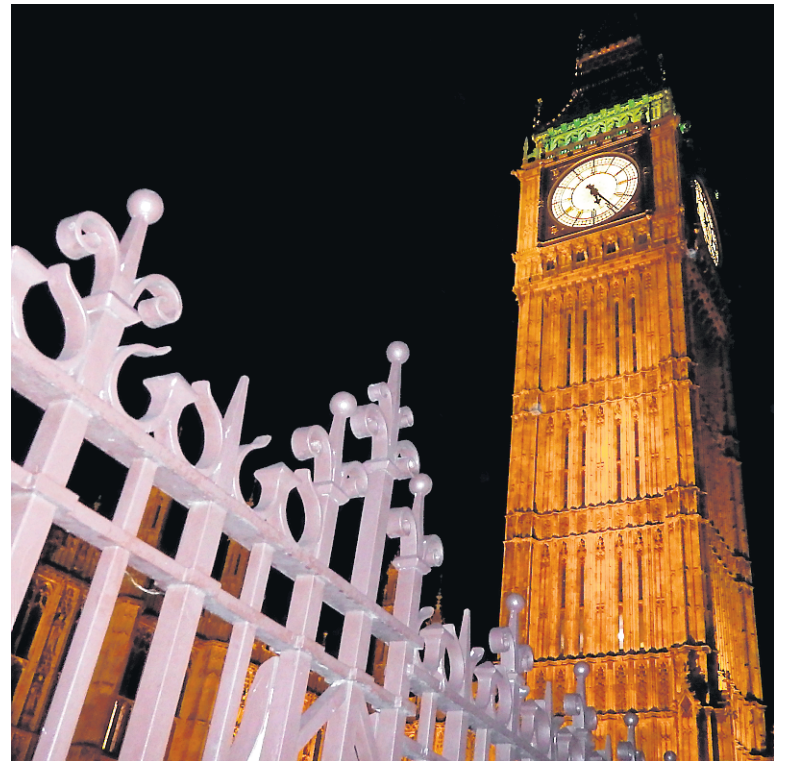
Le célèbre Big Ben est éclairé en vert pendant la période des Fêtes.

fluviale ou le marché vintage de Brick Lane pour découvrir artisans locaux, brocanteurs et cuisine du monde à petit prix.