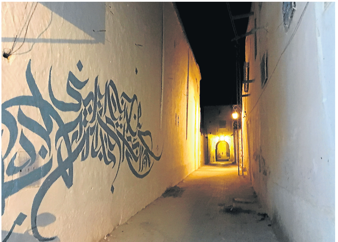
Seules des lumières blafardes animaient les rues de la médina de Nefta, leur conférant une ambiance digne des films de James Bond.

Le journaliste était l'invité de l'Office national du tourisme tunisien et de Tunisair.