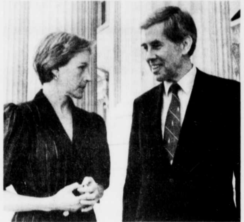
Le sénateur Richard Lugar (républicain, Texas), président du Comité sénatorial sur les relations extérieures, discute de l'historique vote du Sénat avec sa collègue Nancy Kassebaum.

Maintenant, a poursuivi le président, il est temps pour le gouvernement d'Afrique du Sud d'agir avec courage et avec bon sens pour éviter une crise. Les dirigeants modérés noirs qui sont engagés en faveur de la démocratie et s'opposent à la violence révolutionnaire sont prêts à oeuvrer pour un changement pacifique. On ne doit pas les laisser attendre. Il serait tragique de perdre cette occasion de créer une société vraiment libre qui respecte les droits de la majorité, de la minorité et de l'individu".