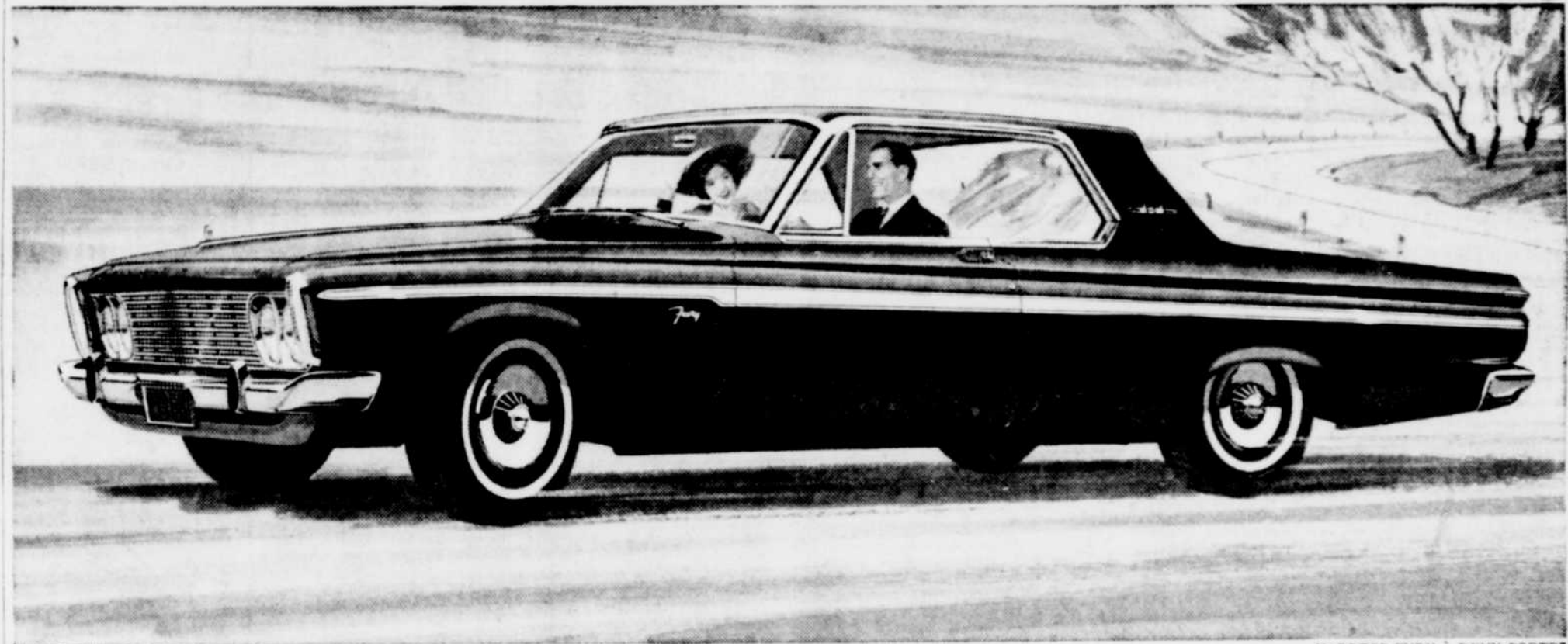
HARDTOP FURY À DEUX PORTES