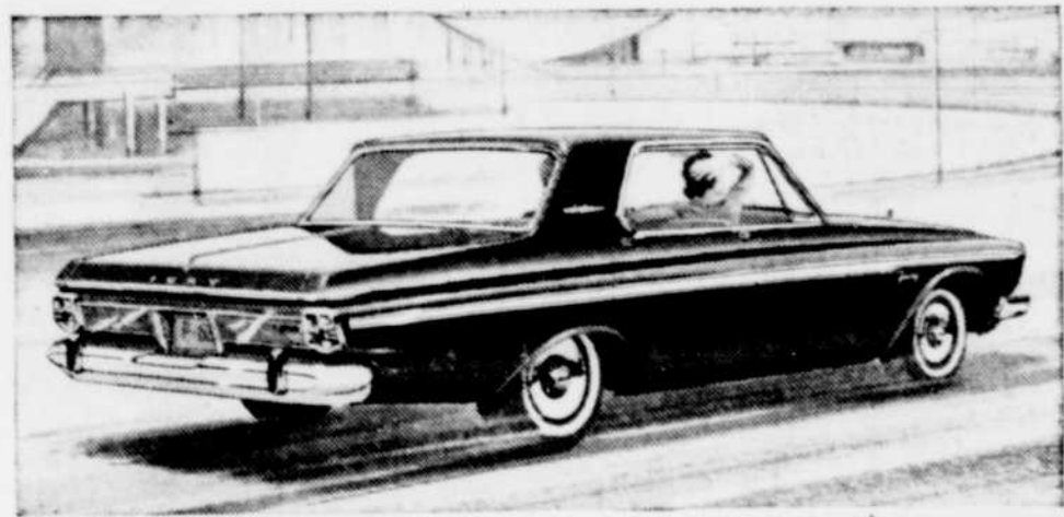
HARDTOP FURY À QUATRE PORTES

Ce qui arrive quand vous déployez cette puissance admirable pourrait se qualifier de sensationnel. En fait, en '63 il faut une Plymouth pour se rapprocher d'une autre Plymouth! Informez-vous auprès de votre vendeur Plymouth au sujet de la nouvelle garantie de 5 ans ou 50,000 milles du "Rouage d'Entraînement."