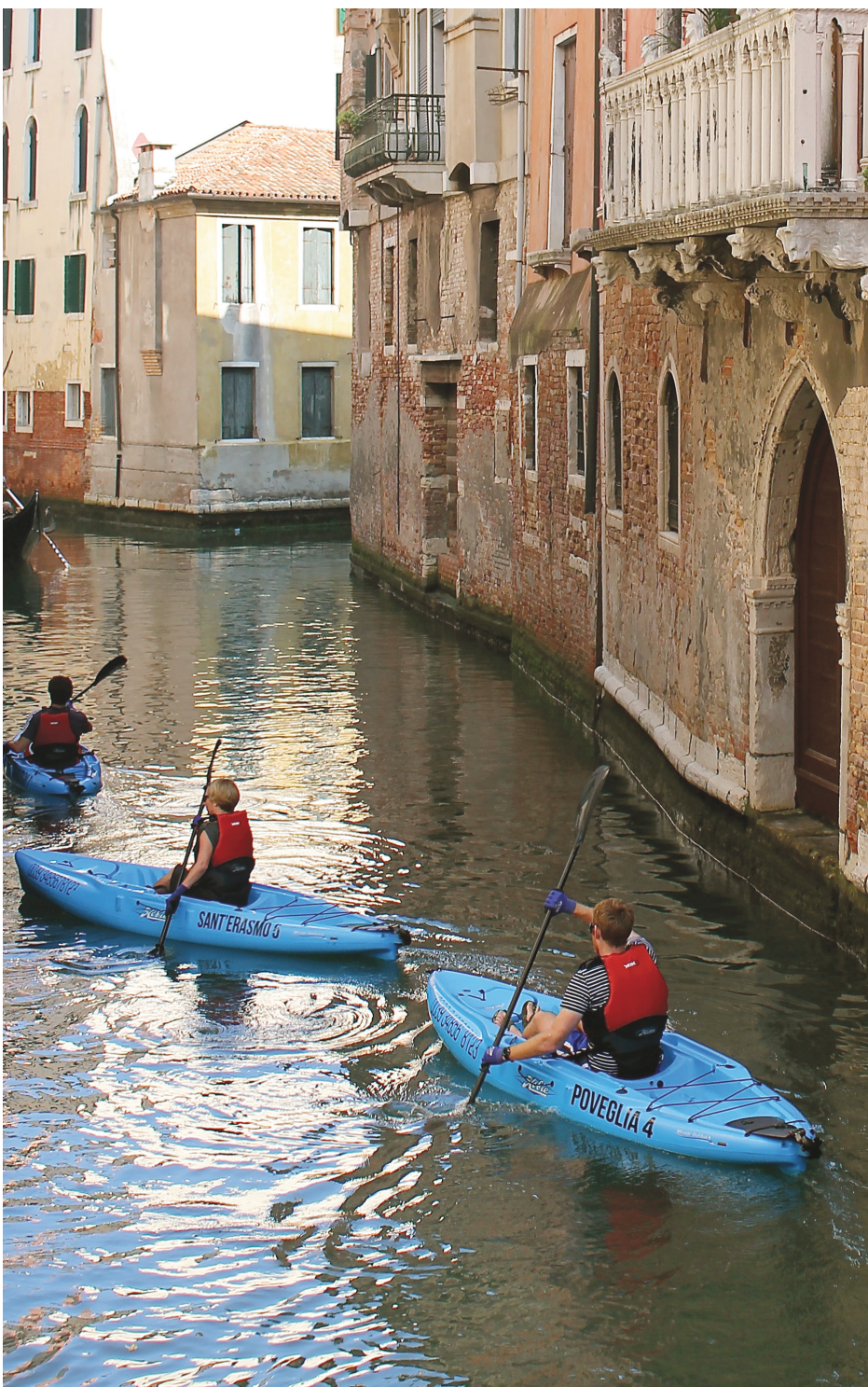
Faire du kayak à Venise!