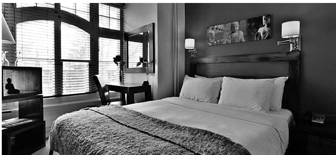
L'enseigne occupe une superbe maison du XIX e siècle. Elle a été reconvertie en auberge-boutique il y a 10 ans, puis agrandie et redécouverte à grands frais en 2013.

Sur les miroirs du hall, les hôtes sont invités à commenter leur séjour. Marie Tifo,