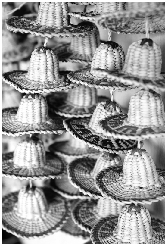
Une famille d'artisans de la vallée d'Anton fabrique des souvenirs, et travaille la paille et le bois.

Puisque les attractions aux alentours de l'hôtel sont peu nombreuses, à part la plage et l'océan, autant en profiter pour visiter Panama