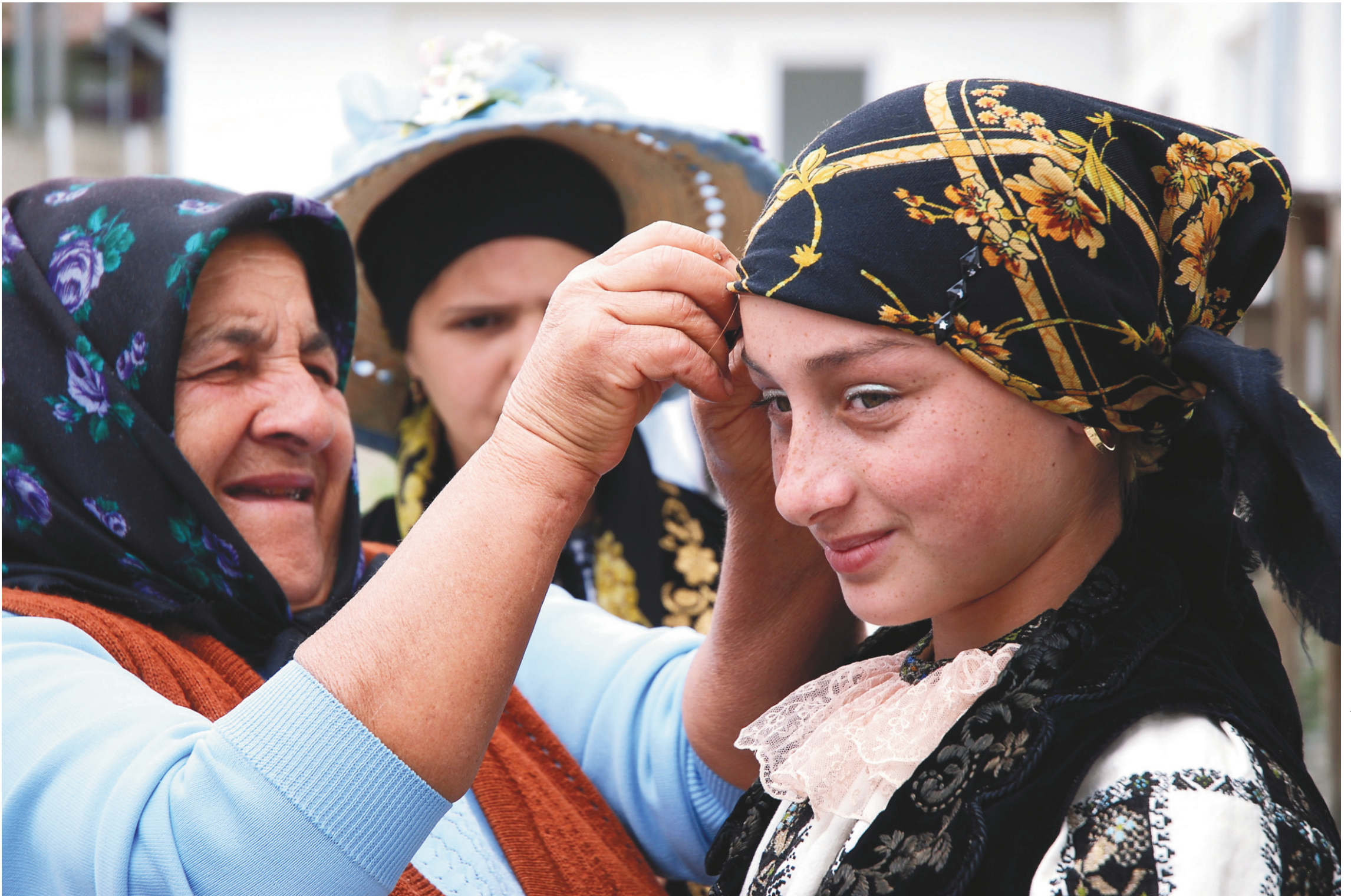
Aller à la rencontre des Tziganes à Boian, en Roumanie.

CAHIER D > LE DEVOIR, LES SAMEDI 4 ET DIMANCHE 5 AVRIL 2015