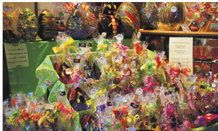
Le chocolat est vendu au poids, et on paie ensuite pour l'ornementation et souvent pour l'emballage, mais surtout pour la réputation du chocolatier qui le fabrique.

voit d'un bon œil la reconnaissance de sa profession depuis quelques années. Assez conservateur dans son travail, même s'il associe la dégustation du vin