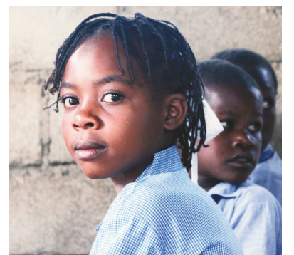
Rendre visite à des écoliers à Haïti.