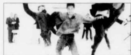
Le maître de Danny...

Beauport, Charest, des Chutes, Galeries de la Capitale, Lido, StarCité; Sainte-Foy (r.o.a.)