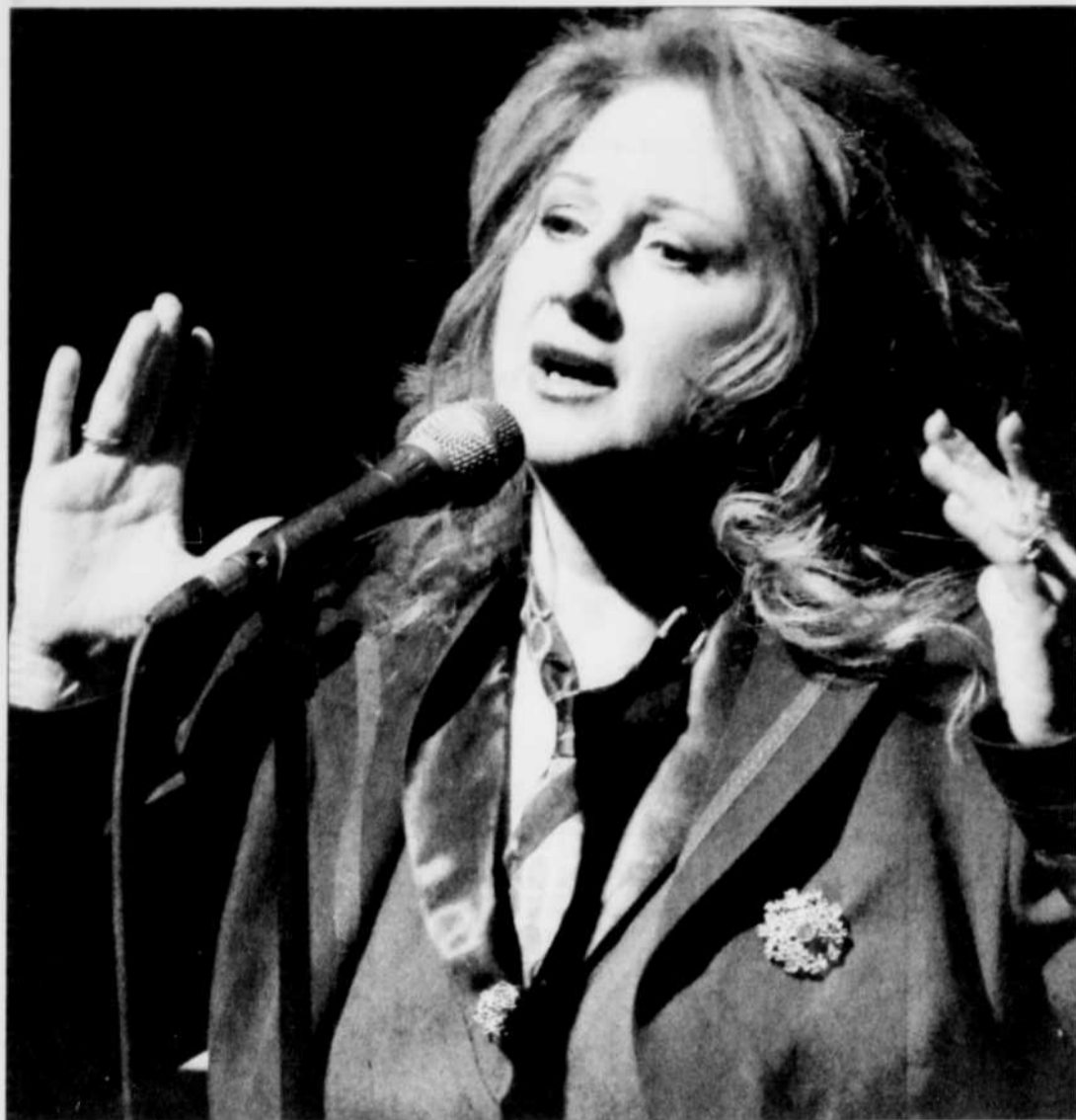
En spectacle, Laurence Jalbert ne se contente pas de chanter. Elle est aussi la comédienne jouant sa vie.