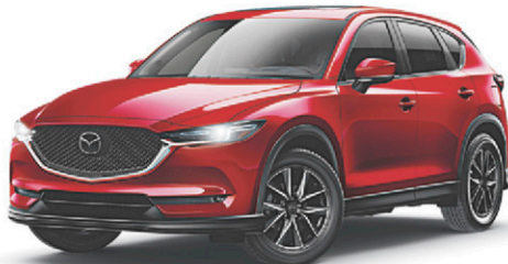
CX-5 AWD 2019 TRACTION INTÉGRALE INCLUSE!

55$ /sem. | Location 60 mois 2 195$ comptant