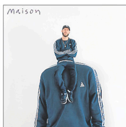
★★★ HIP-HOP FRANCO Maison EMAN DISQUES 7 E CIEL