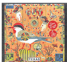
★★★½ COUNTRY ROCK ANGLAIS Guy STEVE EARLE & THE DUKES NEW WEST