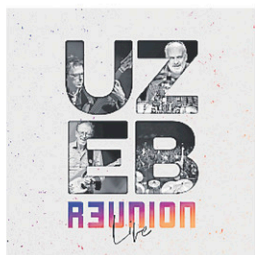
★★★½ JAZZ FUSION R3UNION LIVE UZEB NORAC RECORDS

Liste sujette à changements; certaines sorties ne sont que numériques.