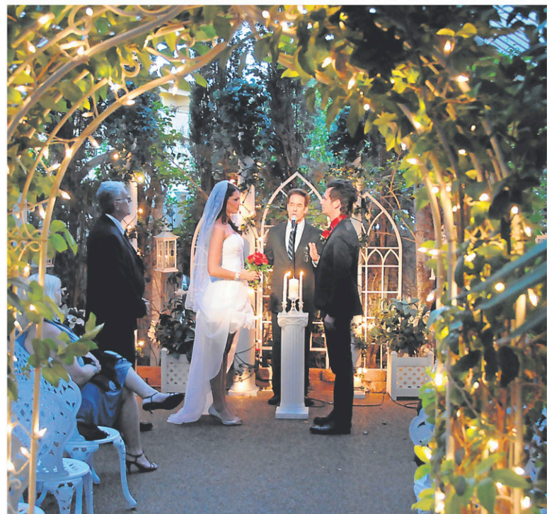
Les gens qui prennent le large pour se marier ne se reconnaissent pas dans le mariage traditionnel.

La famille immédiate est parfois présente, mais souvent, il n'y a que les mariés avec un ou une photographe, qui fait aussi office de témoin. Car si l'intimité est importante dans un tel mariage, l'image l'est également. « C'est sûr qu'on