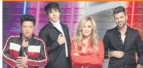
Éric Lapointe, Alex Nevsky, Lara Fabian et Marc Dupré