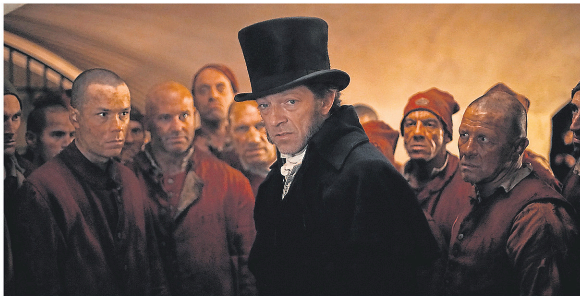
L'empereur de Paris vaut la peine d'abord et avant tout pour Vincent Cassel, qui a le physique de l'emploi. Il compose un personnage principal sombre, résolu, une bête tapie dans l'ombre, toujours prête à bondir.

L'empereur vaut la peine d'abord et avant tout pour Cassel, qui a le physique de l'emploi. Il compose un Vidocq sombre, résolu, une bête tapie dans l'ombre, toujours prête à bondir.