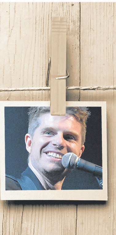
Vincent Vallières lorsqu'il a remporté le prix Félix-Leclerc en 2005, lors de son passage à Tout le monde en parle en 2011 et pendant la tournée de Temps des vivants en 2017.

davantage des projets d'apprentissage, je dirais. C'est plus difficile de me retrouver dans les toutes premières chansons. Et ça se comprend. Mon premier album, je l'ai enregistré en sortant du cégep. J'étais étudiant à l'université, ma perception des choses était celle d'un jeune de cet âge-là. Il me manquait des acquis.»