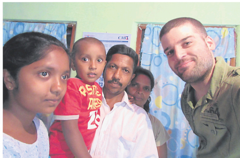
En 2015, cette famille vivant près de la voie ferrée à Ella, au Sri Lanka, m'avait ouvert ses portes pendant une averse qui m'avait pris par surprise.

Au restaurant de son hôtel, il a présenté ma photo aux trois serveurs qui travaillaient ce jour-là. « Il y en a un qui a reconnu le père. Il n'en revenait pas. »