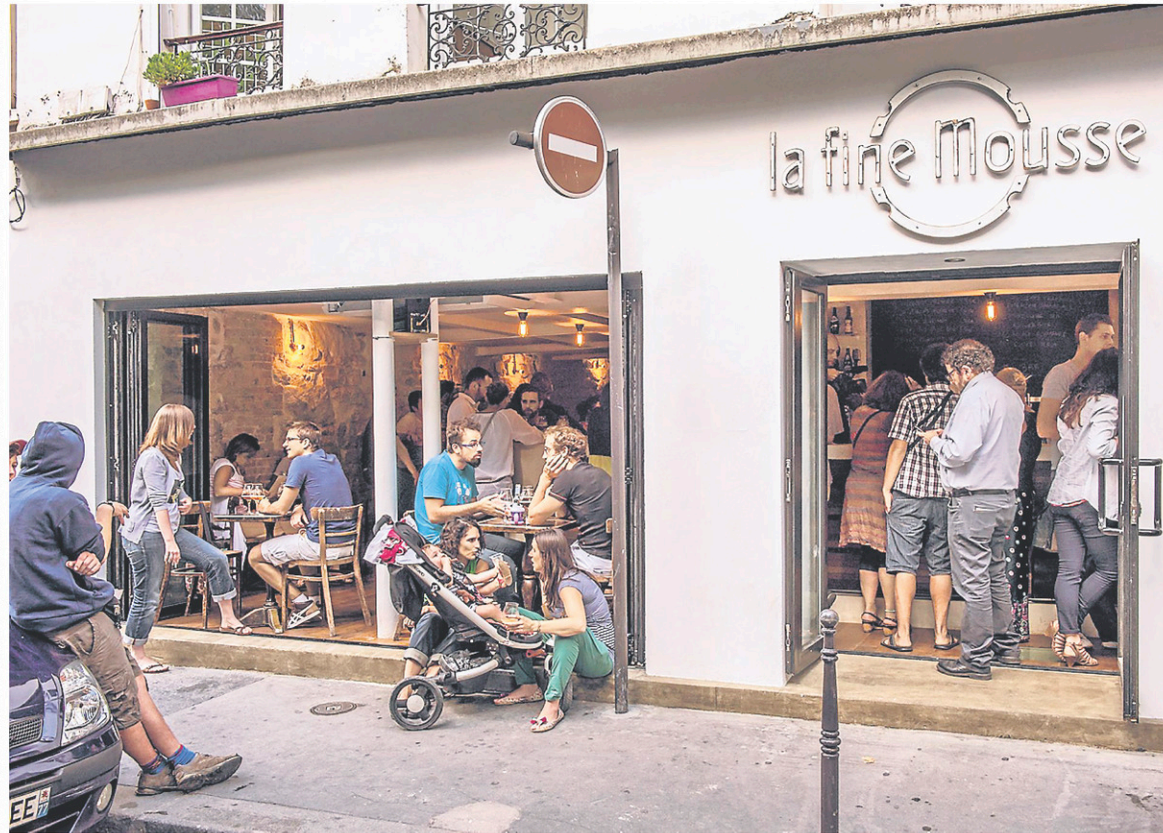
La Fine Mousse est l'un des rares restaurants de Paris où l'accent est mis sur les accords bières et mets.

Fine Mousse propose un nouvel établissement, en plein cœur du quartier Odéon, du nom de La Robe et la Mousse. Le principe est assez proche du bar La Fine Mousse; on y déguste des bières sélectionnées du monde entier et on profite de la connaissance de l'équipe de service sur place pour en découvrir encore plus.