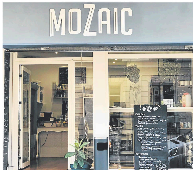
Chez Mozaic, on ne vend pas de la bière, mais de l'amitié.