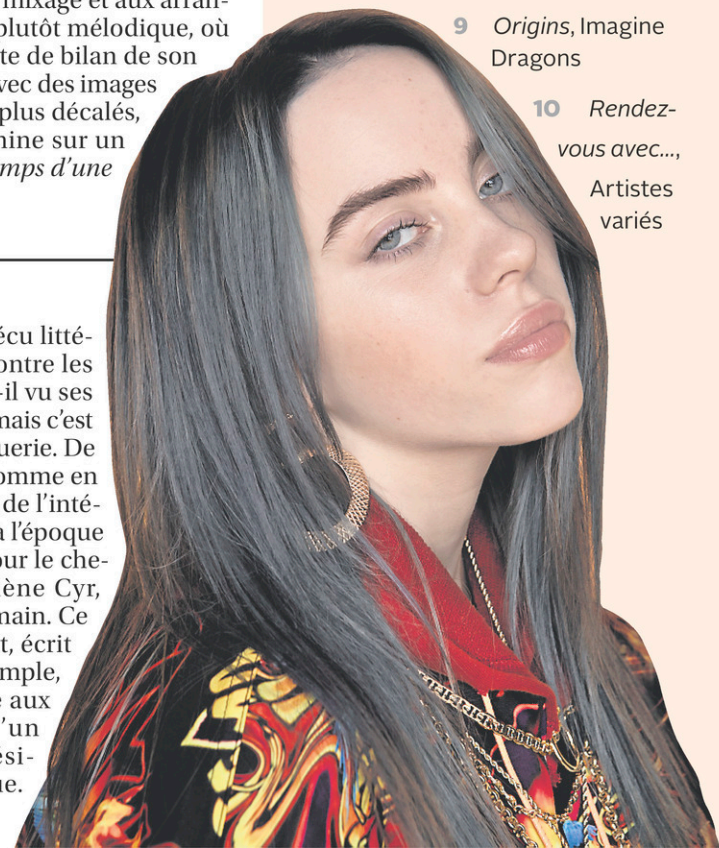
Billie Eilish