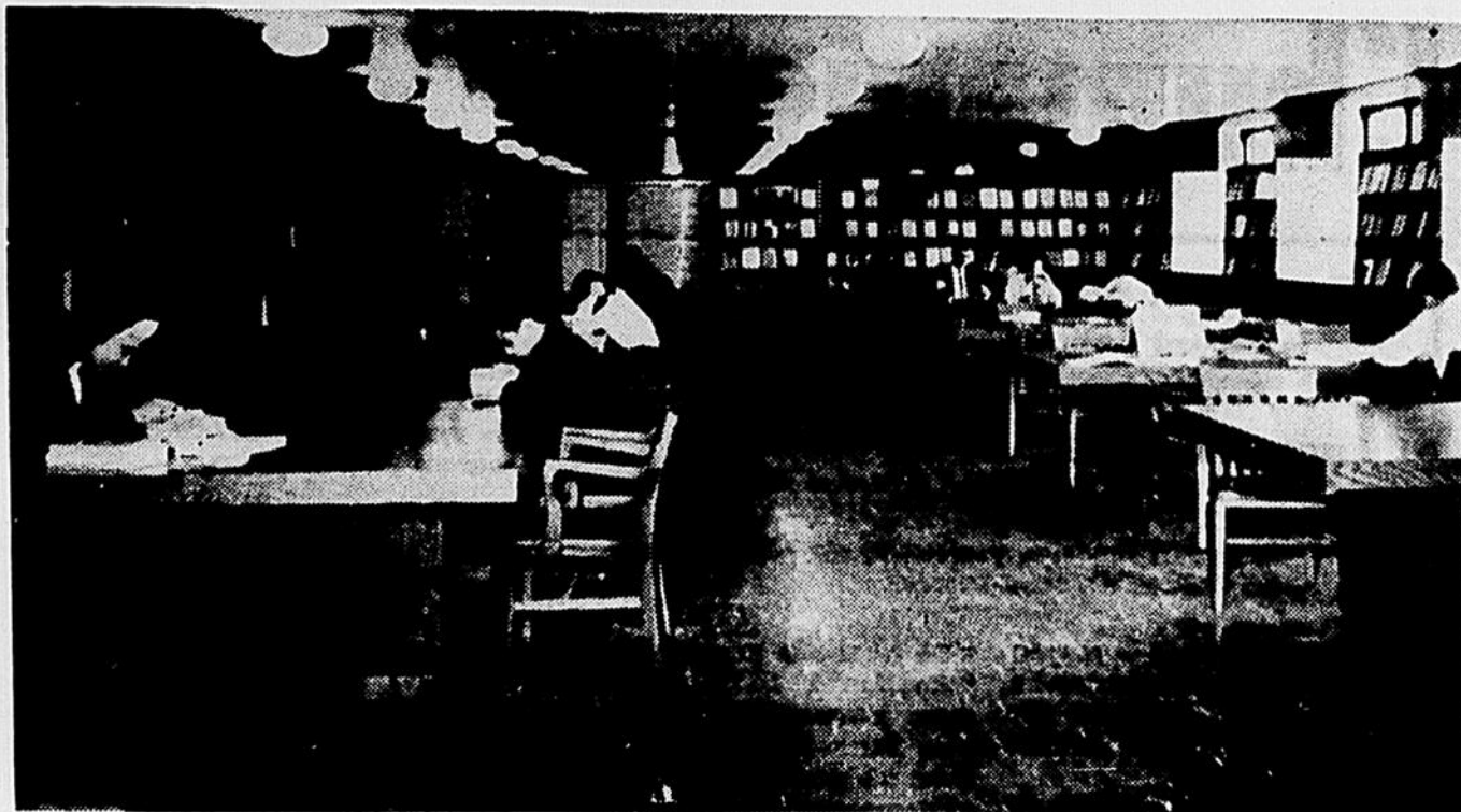
Un samedi à la Bibliothèque de l'Institut d'Etudes Médiévales...