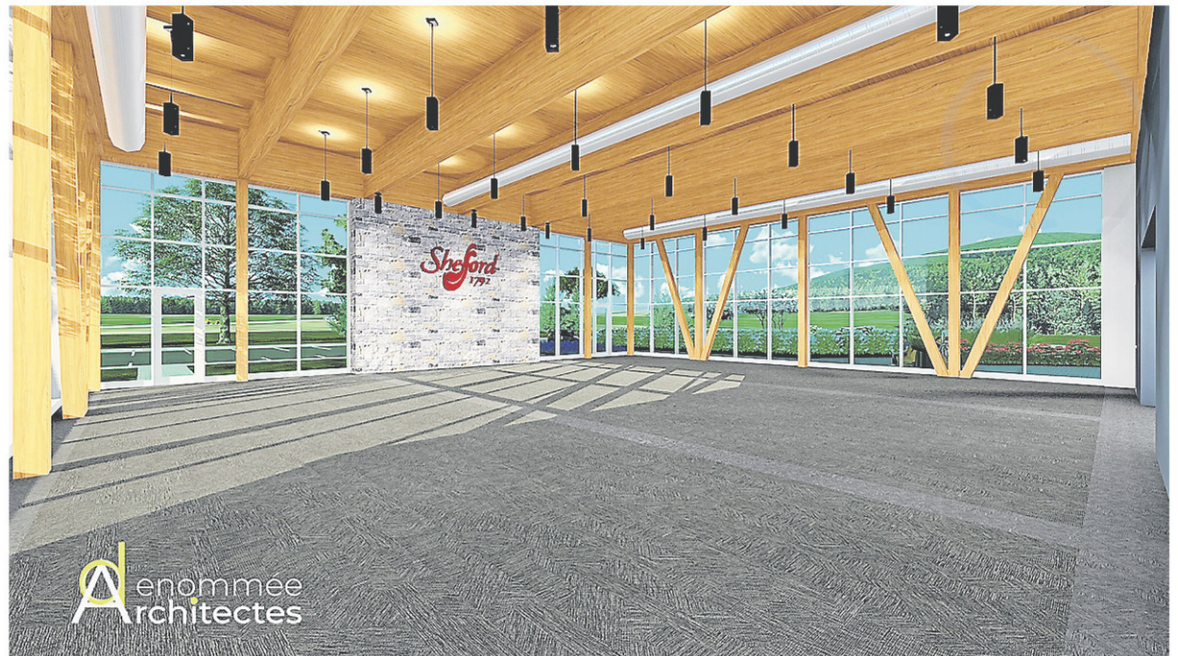
... et de l'intérieur. — CANTON DE SHEFFORD

appel d'offres, en novembre, a permis de réduire la facture de quatre millions de dollars.