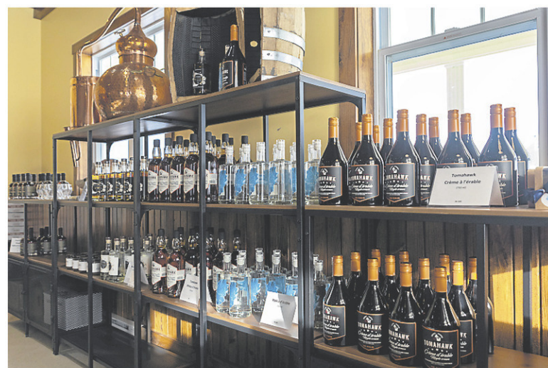
Les acérums brun et blanc, des eaux-de-vie d'érable produits phares de la distillerie, continuent d'être commercialisés par leurs concepteurs, mais ces derniers ne comptent pas s'arrêter là.