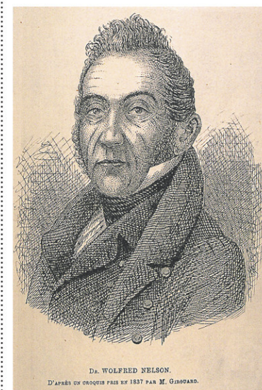
Le chef patriote Wolfred Nelson (1791-1863). — L'OPINION PUBLIQUE, 1ER MAI 1873, P. 209

Au tournant du XX e siècle, seuls les plus vieux habitants de Shefford se souviennent encore des beaux jours de Frost Village. L'église en pierre, construite en 1852, ainsi que quelques résidences situées en retrait demeurent, de nos jours, les rares témoins d'une époque où ce hameau prospère était un arrêt obligé sur le chemin de la diligence.