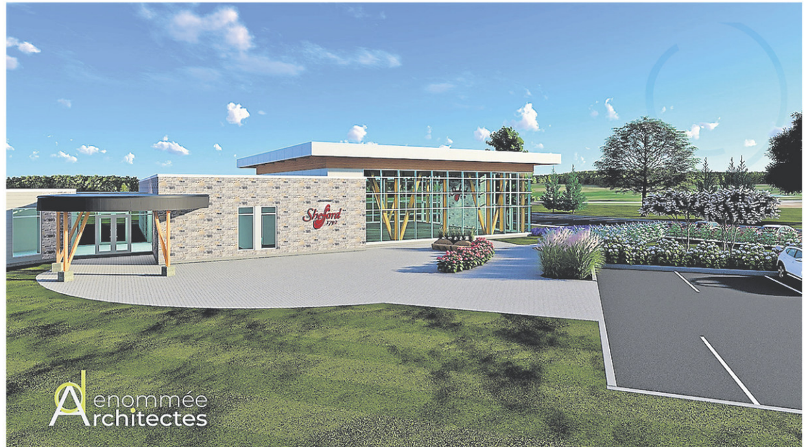
Deux esquisses récentes de ce qu'aura l'air le centre multifonctionnel de Shefford, soit de l'extérieur...