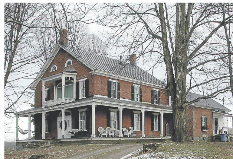
Construite en 1822, la maison Williams a toujours fière allure.

Le moment le plus mouvementé de l'histoire de Frost