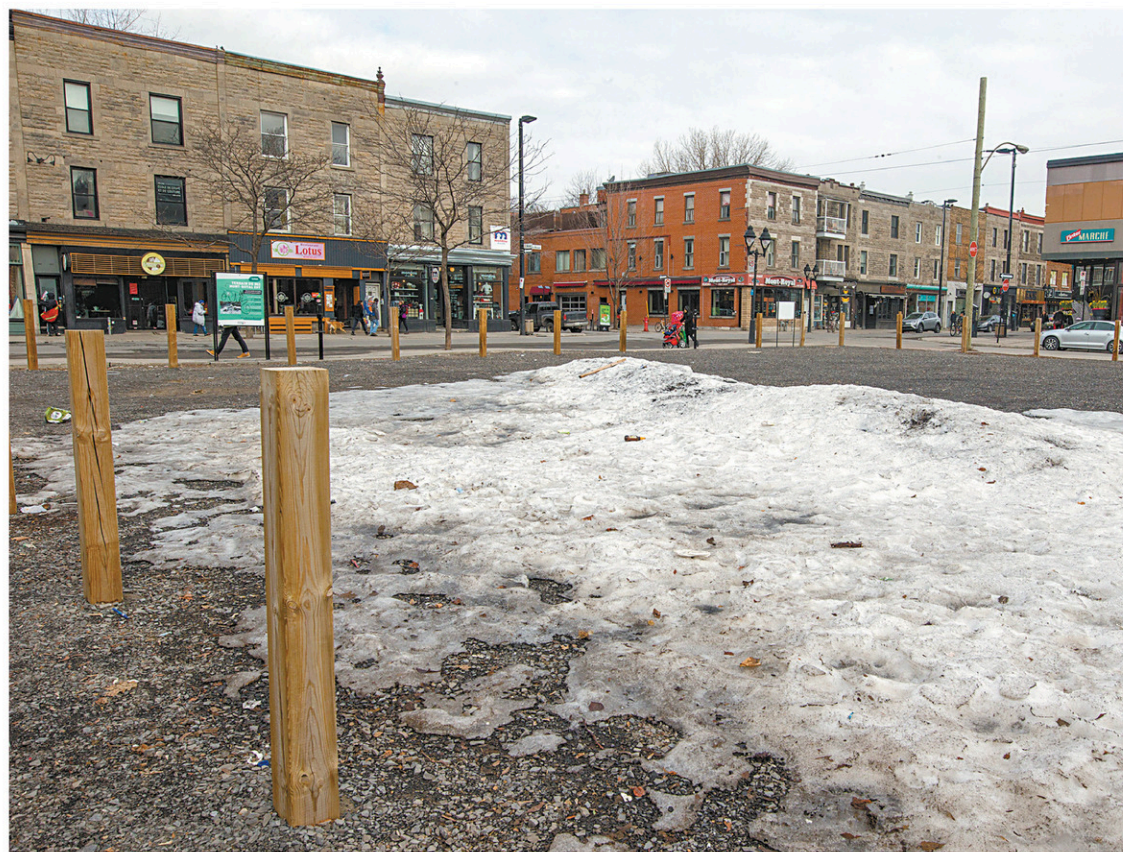
Après plus de 90 ans de service, la station essence Esso a fermé ses portes en novembre 2014, laissant un grand vide sur l'avenue du Mont-Royal.

Se rencontrer, se détendre, se divertir: trois concepts d'aménagement distincts, pensés par la firme de design montréalaise Castor et Pollux — connue pour avoir réalisé les Terrasses Roy — seront testés tour à tour à compter du 21 mai, et ce, jusqu'à la fin octobre.