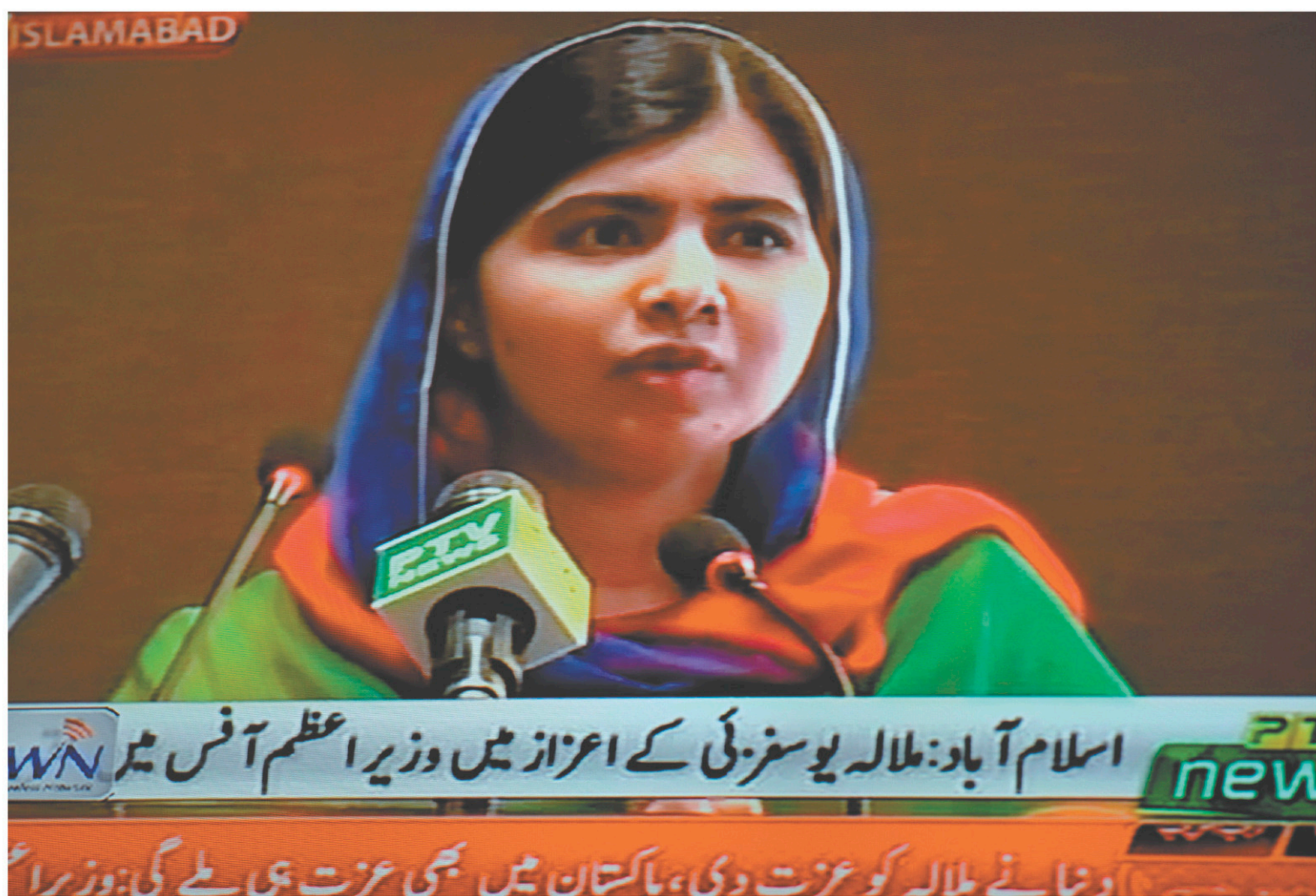
Face au premier ministre, Malala a longuement rappelé combien l'éducation des filles et l'indépendance des femmes étaient une priorité de sa lutte.