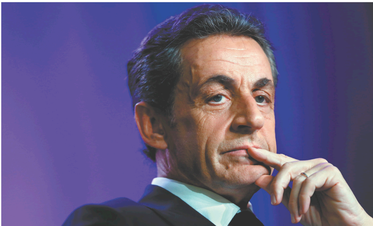
La semaine dernière, l'ex-président avait été mis en examen pour les soupçons de financement libyen de sa campagne de 2007.