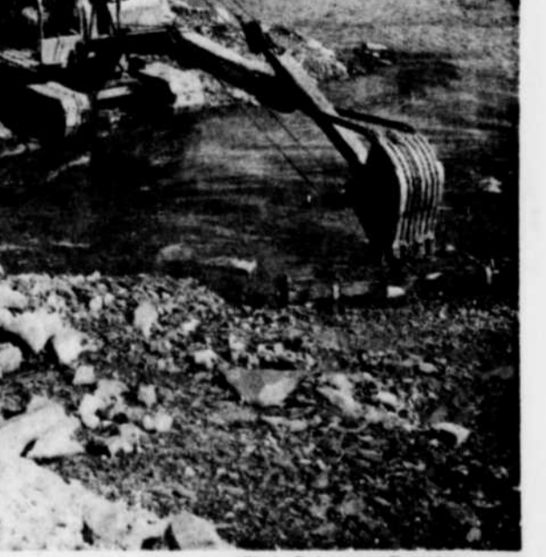
LA PREMIERE ETAPE est en voie de réalisation pour le projet de filtration de l'eau à l'aqueduc municipal de Princeville. Il s'agit de l'installation d'une conduite d'aménée d'une longueur d'environ 5,000 pieds, entre l'usine de pompage actuelle et la future unité qui puisera l'eau dans des tuyaux filtrants enfoncés dans le sous-sol, près de la rivière. Sur la photo, on remarque les puissantes machines ouvrant une tranchée dans la rivière Bulstrade, qui doit être traversée pour la conduite d'aménée. Cette partie des travaux a été confiée à P. Poirier Construction Inc., de Princeville.