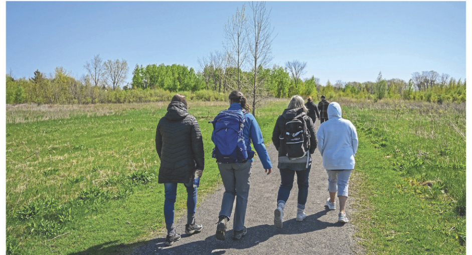
La Ville de Saint-Jean-sur-Richelieu et le Centre d'interprétation du milieu écologique (CIME) Haut-Richelieu ont tenu une activité d'interprétation le 11 mai.