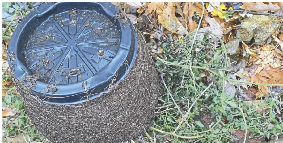
Une petite assiette de plastique (souvent noire) se cache souvent au fond des pots de plante.

Rassembler les matières recyclables dans un grand sac noué peut sembler pratique. Toutefois, ce geste nuit grandement aux