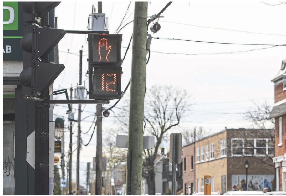
La Ville de Saint-Jean-sur-Richelieu compte 40 intersections avec des feux de circulation sous son contrôle et totalise environ 200 feux piétons.

La Ville de Saint-Jean-sur-Richelieu compte 40 intersections avec des feux de circulation sous son contrôle et totalise environ 200 feux piétons. Leur fonctionnement est régulé selon