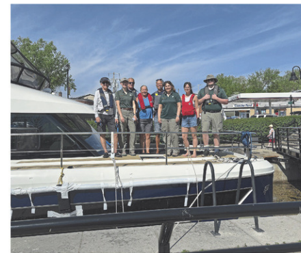
Les premiers plaisanciers à traverser l'écluse numéro neuf étaient à bord du bateau MsBleu.

Pour plus d'informations sur la saison de navigation ou pour se procurer un permis d'éclusage, consultez le site Web www.pc.gc.ca/fr .