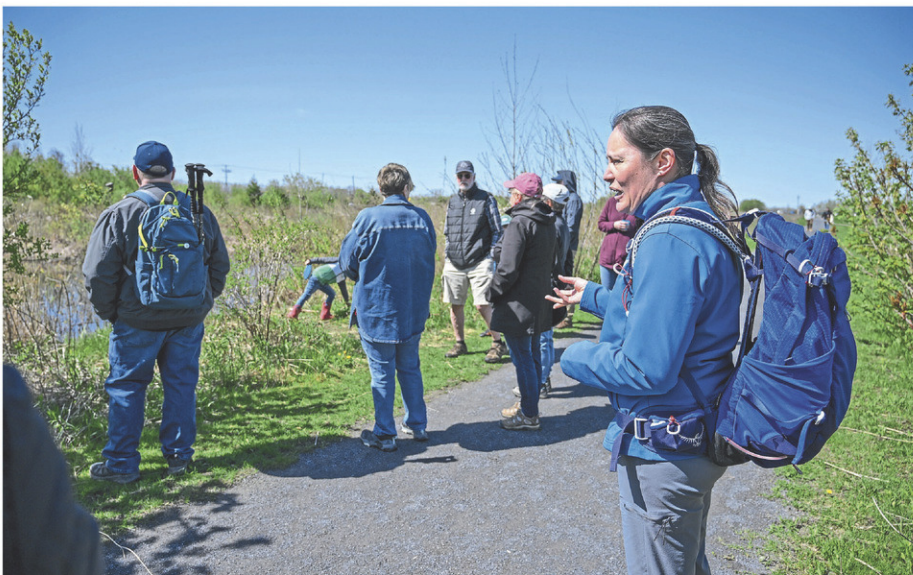
Plusieurs sujets ont été abordés, dont les milieux humides, les amphibiens, l'apparition des fleurs printanières et l'éclosion des bourgeons dans les arbres.