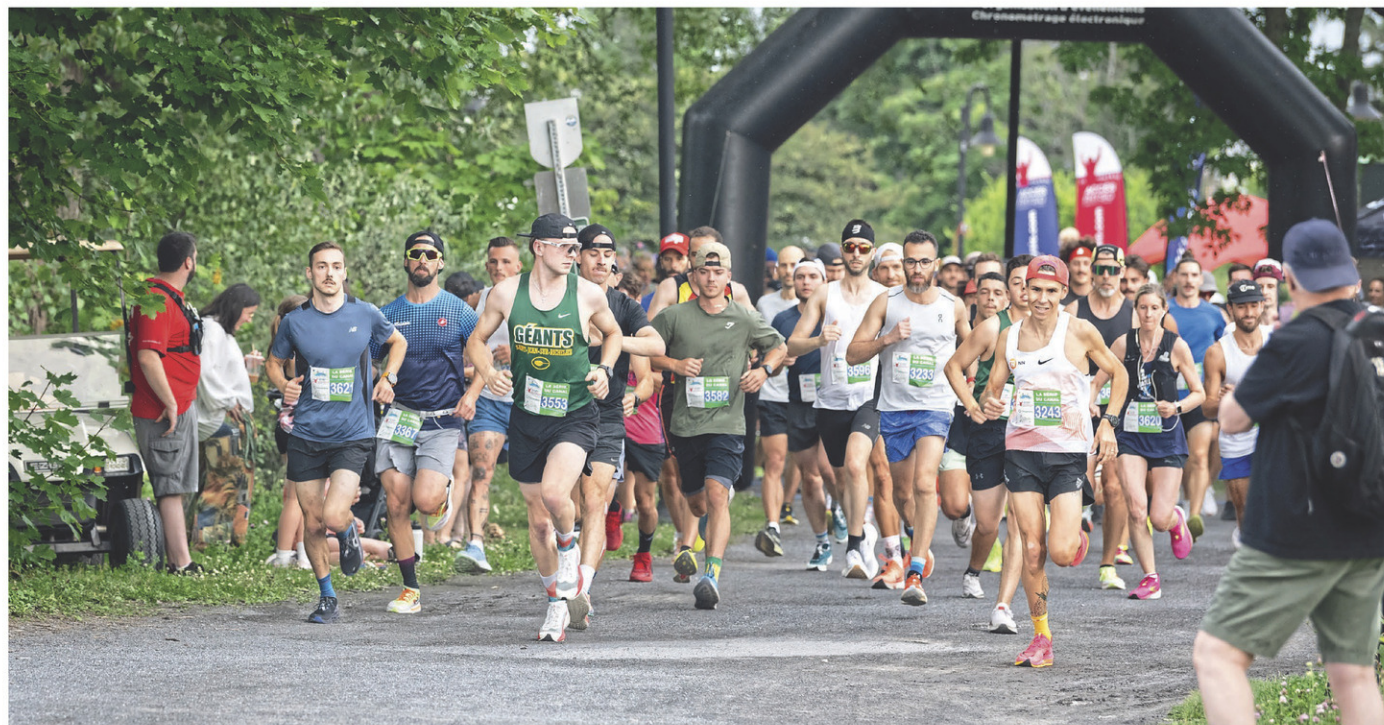
La Série du canal comporte des courses de 2 et 5 km.

Pour chacune des courses, le coût d'inscription est de 10 $ pour le 5 km et 5 $ pour le 2 km. Il sera également possible de s'inscrire aux quatre courses pour 35 $, incluant un dossard personnalisé qui pourra être utilisé pour les quatre courses. Le coût d'inscription inclut une consommation au retour de la course.