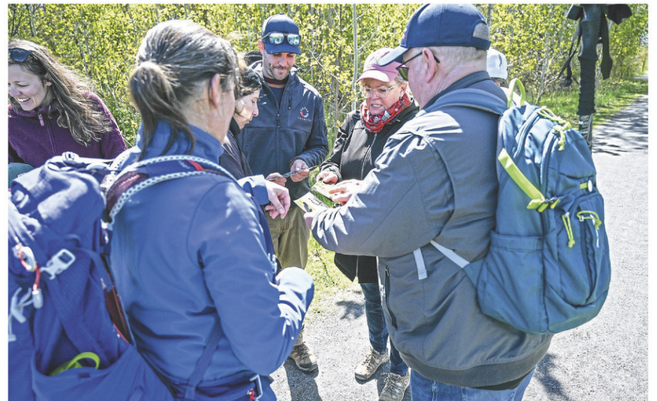
L'activité avait lieu au parc naturel de Parulines et était sur le thème du printemps.