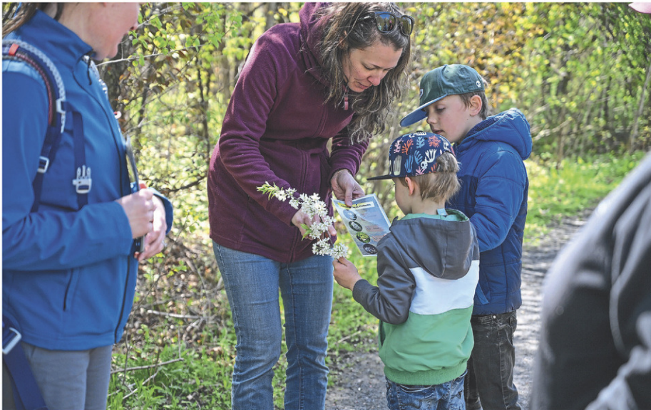
L'activité était intéressante autant pour les petits que pour les grands.