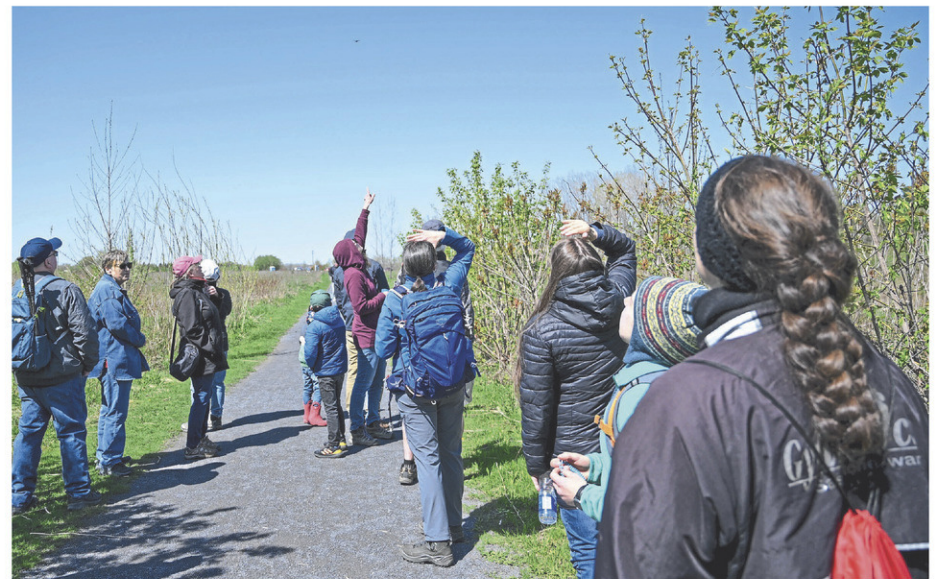
Durant la randonnée, le groupe a pu observer des oiseaux migrateurs.