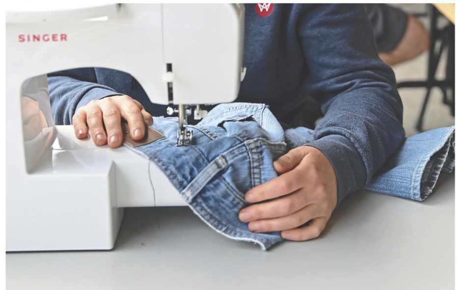
L'an passé, 50% des objets évalués en une journée ont été réparés et 20% des objets ont été partiellement restaurés.

«Dans un futur, on aimerait que l'événement revienne quatre fois à l'année. Ce genre de projet s'inscrit bien dans le plan d'économie circulaire de la Ville qui est sorti en décembre