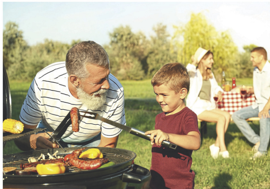
Les Johannais sont invités à organiser et participer à des activités festives lors de la Fête du voisinage le 7 juin.

Les trois prix sont un plateau gourmand d'un service traiteur local, un parcours de Ninja Warrior avec de l'animation ainsi qu'une animation pédagogique avec des animaux. Pour de plus amples informations ou pour inscrire sa propre activité, il faut se rendre sur le site Web sjsr.ca/fete-voisinage .