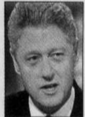
Bill Clinton: «Bush a besoin d'une nation divisée.»

■ Teresa Heinz pique une colère contre un journaliste, page A 3