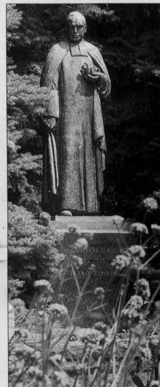
La statue du frère Marie-Victorin, au Jardin botanique de Montréal.

«Pour nous, envoyer de l'argent à l'étranger pour des contrats internes, ce n'est pas une chose sensée», a déclaré le 13 juillet dernier, dans le quotidien Pasadena Star News , celle qui a décidé de partir en guerre contre la sous-traitance étrangère après avoir découvert que la ligne «info santé» californienne était en fait gérée par une entreprise installée... en Inde. Mais son projet, même s'il est désormais entre les mains du comité sénatorial sur l'organisation des gouverne-