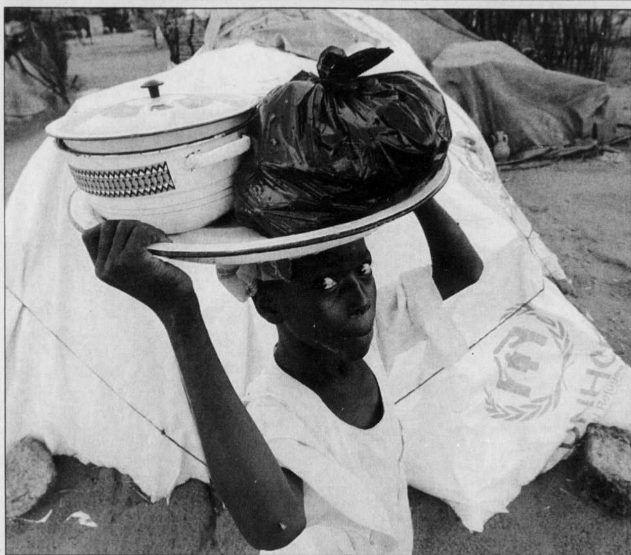
Jeune réfugiée soudanaise, hier, au camp de Farchana, dans l'est du Tchad.