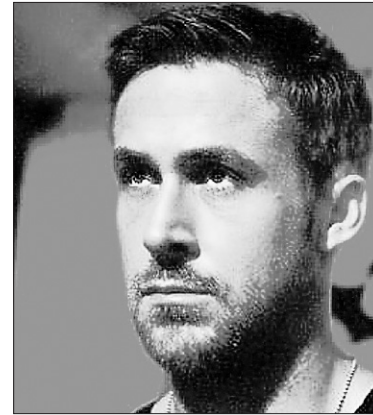
Only God Forgives s'annonce radical et violent.

On ne pourrait dire à quel point le nouveau film d'Asghar Farhadi est attendu. L'auteur cinéaste iranien, qui a triomphé partout sur la planète l'an dernier grâce à Une séparation (Ours d'or à Berlin; Oscar du meilleur film en langue