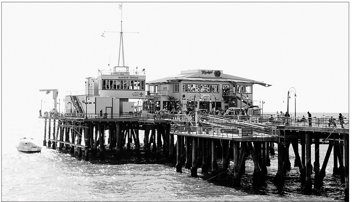
Le Santa Monica Pier, vu de la plage de Santa Monica, à Los Angeles.

Passer une journée ou une soirée au quai de Santa Monica est une expérience fort réjouissante, avec ce petit quelque chose de vieillot, d'une autre époque. Une façon fort joyeuse d'entrer en contact avec l'océan. •