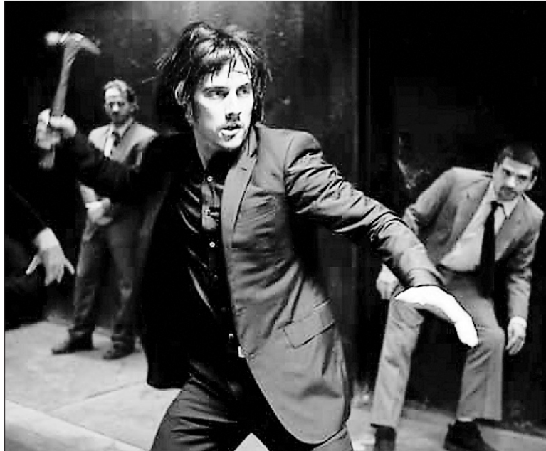
Oldboy devrait prendre l'affiche le 11 octobre.

Au tour de Spike Lee d'offrir sa version du manga dont s'était déjà inspiré un célèbre film coréen, lauréat du Grand prix à Cannes en 2004 (et favori du président Quentin Tarantino pour la Palme d'or). En entrevue avec La Presse récemment, Spike Lee était assez avare de commentaires sur ce projet, mais confiait quand même être très admiratif du film de Park Chan-wook.