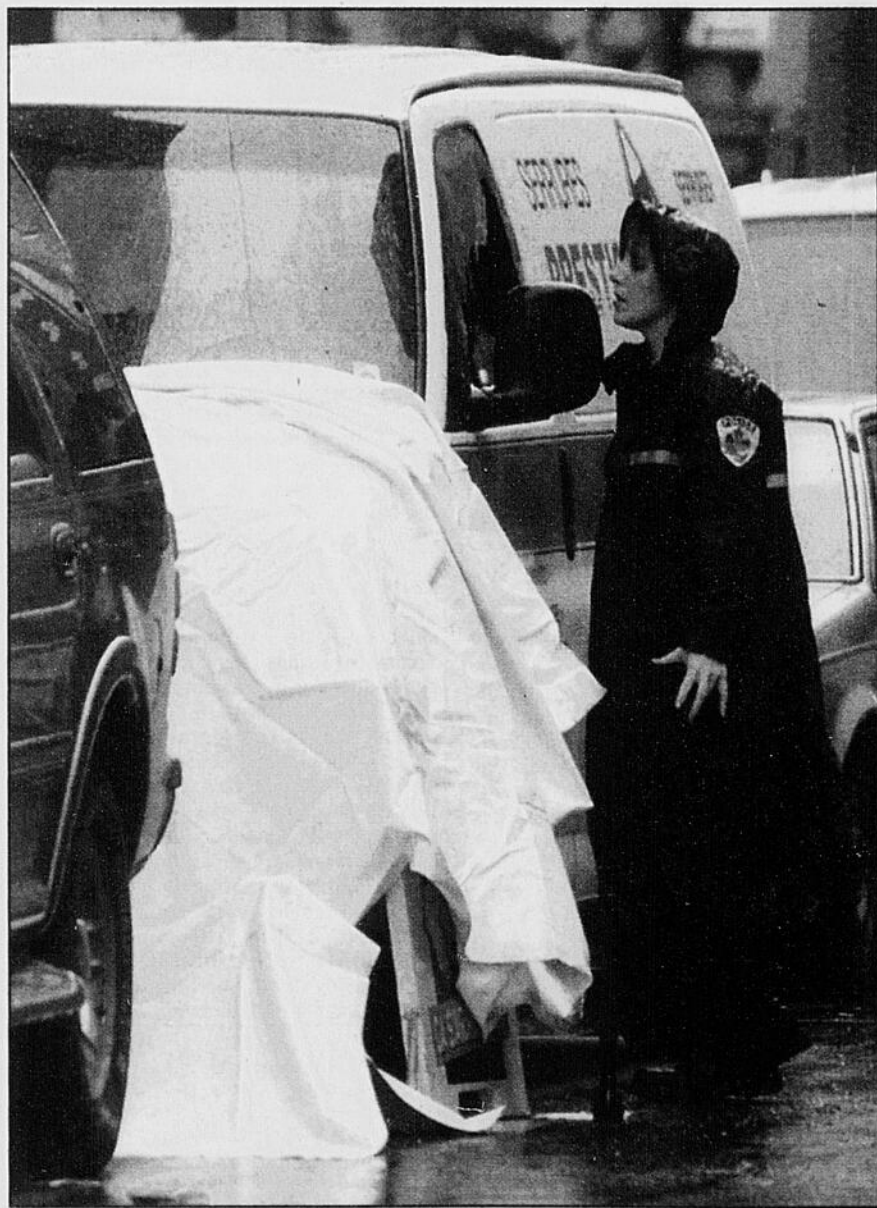
À Montréal, une policière examine l'intérieur d'un véhicule à la vitre fracassée. Un suspect armé en fuite, qui retenait un conducteur en otage, a été blessé par balles lors d'une interception par les policiers. L'otage n'a pas été blessé.

Les autorités policières ont fermé plusieurs rues, en fin d'après-midi, pour mener leur enquête et laisser passer les véhicules d'urgence. La fermeture de nombreux quadrilatères a rendu la circulation pénible en certains endroits, durant l'heure de pointe. Le SPCUM a continué son enquête sur les lieux des fusillades, au cours de la soirée.