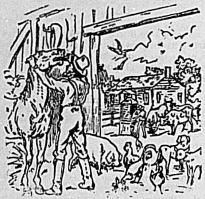
L'AMI DES PAUVRES.

Les ordres envoyés par écrit recevront toute attention et seront exécutés sans délai.