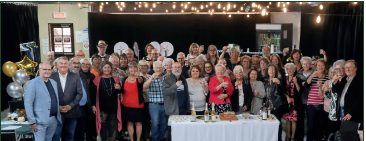
Les bénévoles du Cantonnier se réunissent pour célébrer le 25 e anniversaire du journal Le Cantonnier.

L'équipe du journal remercie Vignoble & Distillerie L'incantatrice de Beau-lac-Garthby qui leur a offert trois bouteilles d'un de leurs produits les plus populaires, le vin de bleuet.