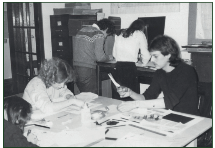
La fabrication du journal dans les années 1970. Fonds d'archives de DDP

Si les articles de Droit de parole sont précis, tant dans leur argumentaire que dans les faits, les photographies quant à elles, une fois détachées de leur contexte, deviennent les fragments d'une mémoire labile et lacunaire. Cette mémoire risque de se perdre ou de se déformer à mesure que la première génération d'artisans laisse place à la suivante. Il est temps de préserver la mémoire de Droit de parole , à vous d'y contribuer à présent.