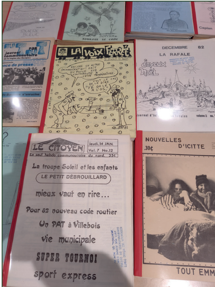
Les premiers membres de l'AMECQ, des journaux aux noms évocateurs : Le Citoyen, Nouvelles d'icitte, La Baratte, Le Cone, Le Mussely, Tout partout, La Voix ferrée, La Rafale, La Criée, Le Sextant.