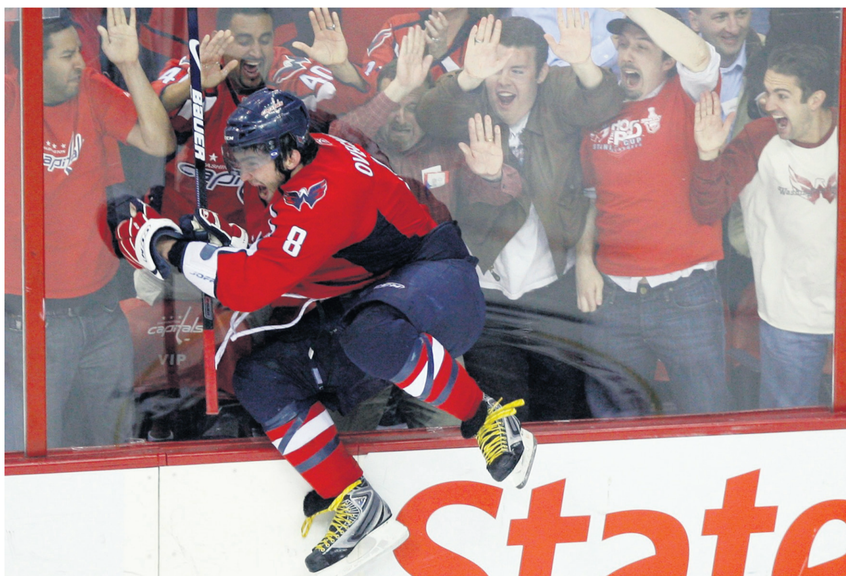
Alex Ovechkin a soulevé la foule avec son troisième but de la rencontre, qui s'est avéré le but gagnant. Son vis-à-vis des Penguins, Sidney Crosby, lui a donné la riposte en récoltant, lui aussi, trois buts hier soir à Washington.