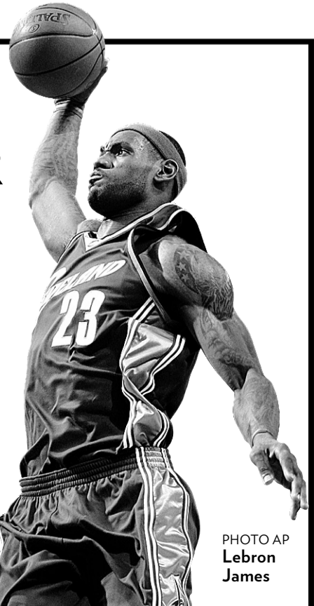
LeBron James