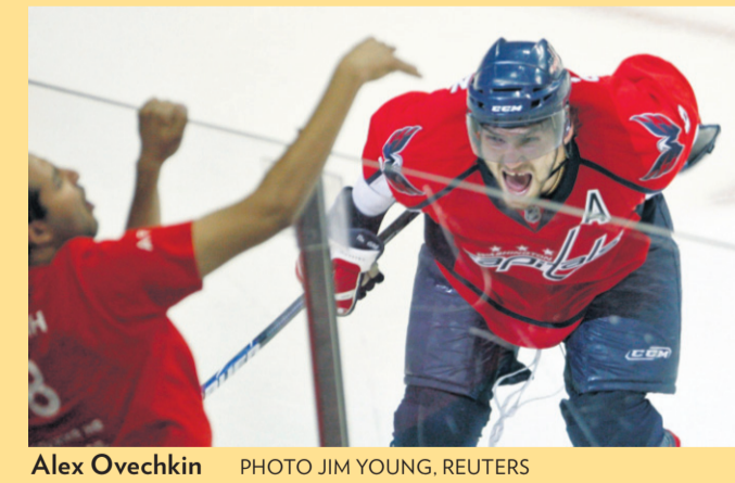
Alex Ovechkin