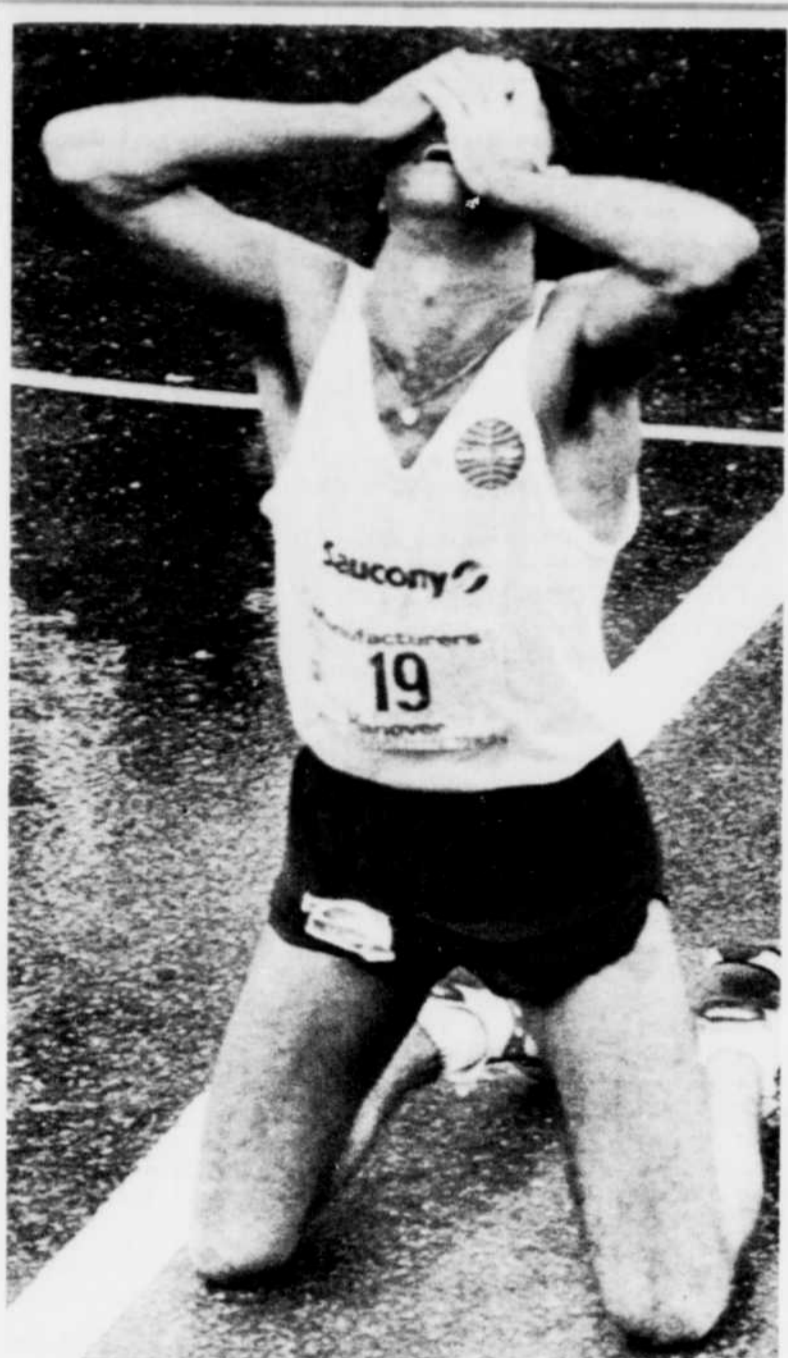
Rod Dixon est tombé sur ses genoux après la victoire au marathon de New York.