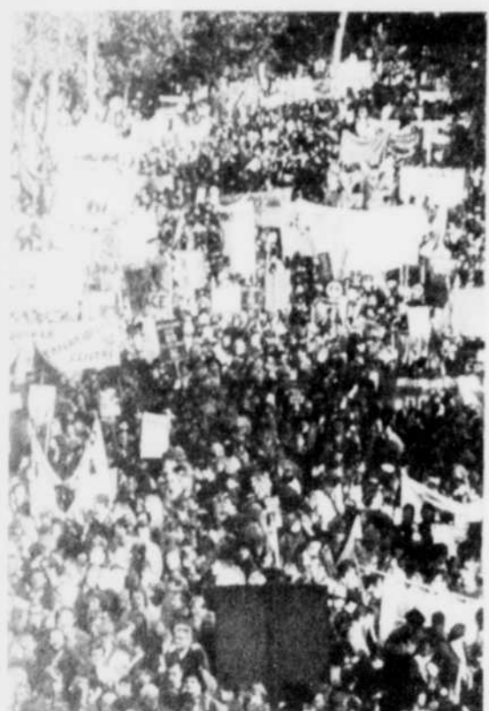
Quelque 300.000 manifestants ont protesté à Londres, samedi, contre l'implantation des euromissiles.

Les rangs des pacifistes ont été nettement moins fournis en France.