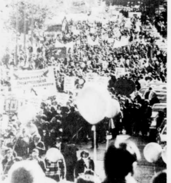
Environ 10.000 personnes ont formé une chaîne humaine longue de trois kilomètres à Montréal.

Un relevé conservateur porte à environ 30.000 le nombre de Canadiens qui ont pris part aux manifestations dans près de 50 villes canadiennes. Les rassemblements les plus importants et les plus représentatifs du but réel de cette journée, soit l'opposition aux essais du missile Cruise, se sont déroulés à Toronto et à Montréal.