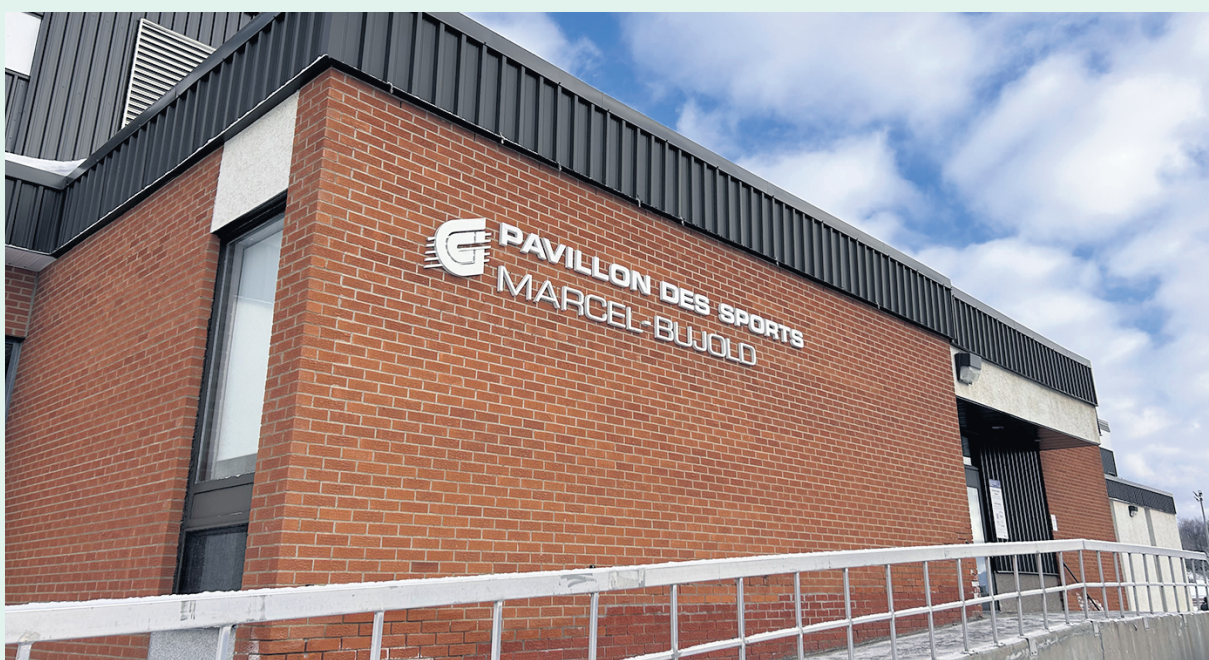
Le Cégep de la Gaspésie et des Îles laissera la place aux autres camps de jour actifs dans le secteur et ses installations seront mises à leur disposition.