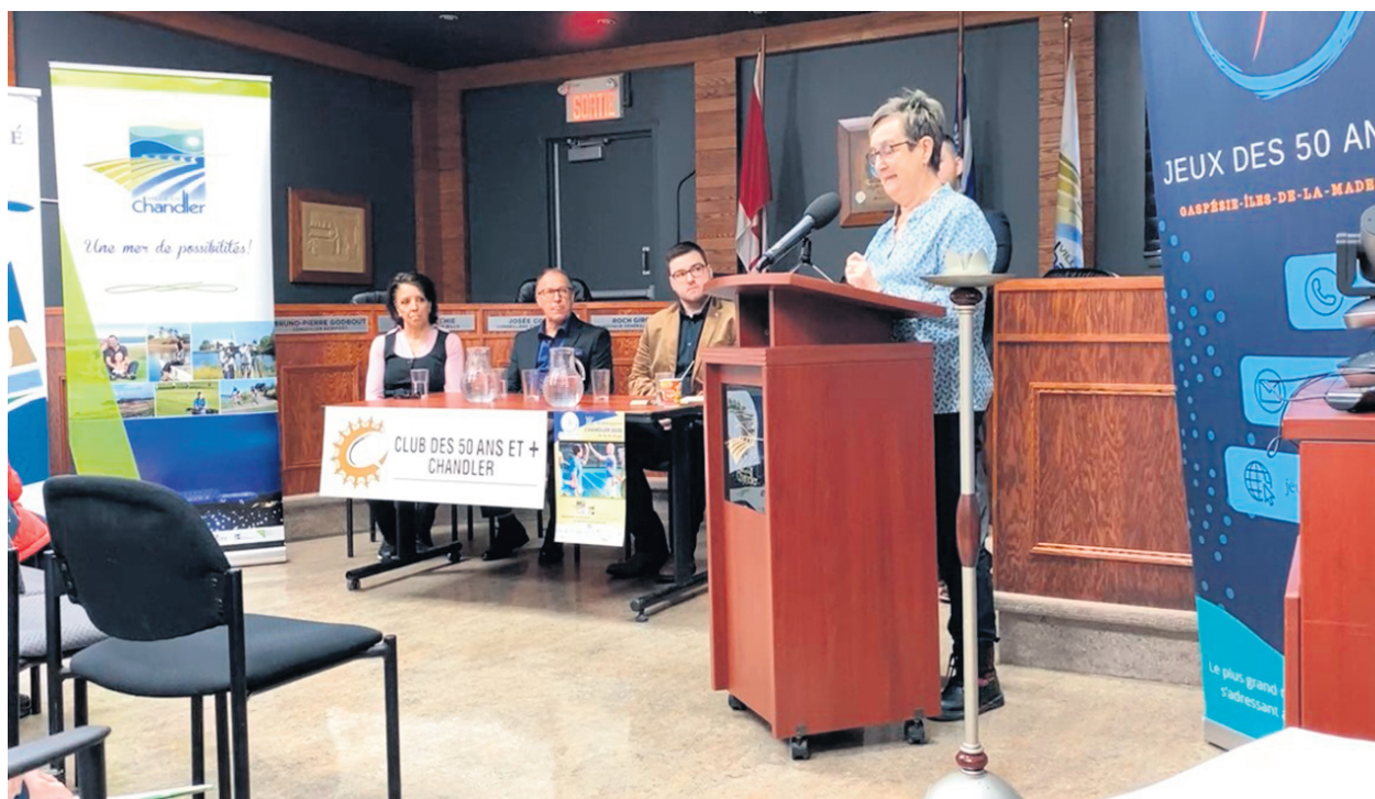
Cette année, l'événement regroupera 26 disciplines en compétition qui se déploieront sur deux jours.

Ces Jeux des 50 ans et plus sont d'ailleurs ouverts à tous, nonobstant le lieu de résidence des participants. Les intéressés du Bas-Saint-Laurent, du Nouveau-Brunswick ou même de plus loin encore sont bienvenus. Le seul critère demeure l'âge. « On veut promouvoir la pratique de l'activité physique et organiser un événement annuel qui est