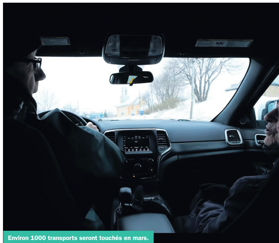
Environ 1000 transports seront touchés en mars.

Selon le CISSS de la Gaspésie, la décision des centres d'action bénévole touchera une soixantaine d'usagers pendant le mois de mars. L'organisation précise cependant que l'aide financière octroyée aux CAB n'a pas été amputée; que le financement global du Programme de soutien aux organismes communautaires a même été rehaussé pour l'année 2024-2025. Par communiqué, le CISSS explique que, exceptionnellement, l'an dernier, une somme d'urgence supplémentaire de 200 000$ a pu être offerte pour soutenir leur service, mais que « la situation a évolué au cours des derniers mois et le contexte financier actuel ne nous permet pas d'en faire autant cette année ».