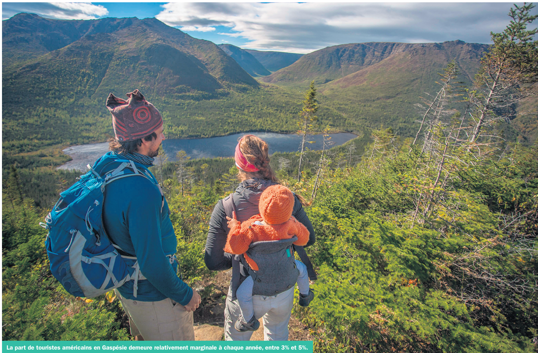
La part de touristes américains en Gaspésie demeure relativement marginale à chaque année, entre 3% et 5%.