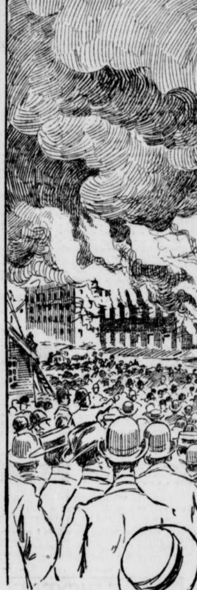
L'INCENDIE DES ABATTOIRS DE L'EST

Les bâtiments détruits avaient trois étages et quelque deux cents pieds de longueur. On ne peut s'expliquer comment ont été incendiés à cet endroit toutes les constructions à l'intérieur desquelles une très forte humidité règne en