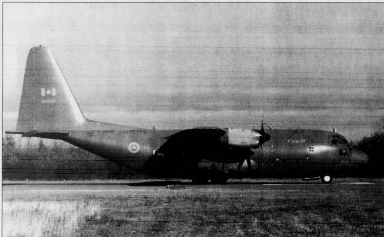
COLLABORATION SPÉCIALE, ROMAIN PELLETIER

À la suite d'un récent exercice de simulation, les Forces armées canadiennes ont déclaré opérationnel le Centre de sauvetage et de recherche aériens de Matane qui couvre toute la péninsule à partir de Rivière-du-Loup. Les observateurs bénévoles, membres du Service de recherche et de sauvetage aériens du Québec (SERABEC), ont passé avec succès les tests qui comprenaient notamment des recherches à bord d'un Hercules C-130, un avion de transport géant. En cours d'année, ils effectuent de nombreux vols sur des avions civils et reçoivent une formation théorique. Au Québec, SERABEC, un organisme dans but lucratif financé par le gouvernement fédéral, regroupe 700 membres répartis dans neuf régions. R. P.