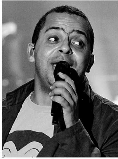
Gregory Charles en répétition de son concert, plus tôt cette année.

Le 23 octobre, Gregory Charles sortira un album en français. Il paraîtra au Québec sur étiquette Universal Music Canada. Ce lancement sera vraisemblablement suivi d'un autre en France. Depuis le succès de son spectacle Noir et blanc , Gregory Charles s'impose de plus en plus comme auteur-compositeur. Son CD I Think of You , paru en octobre 2006, s'est écoulé à ce jour à plus de 350 000 exemplaires. Un autre album en anglais devrait être lancé en 2008. Isabelle Massé