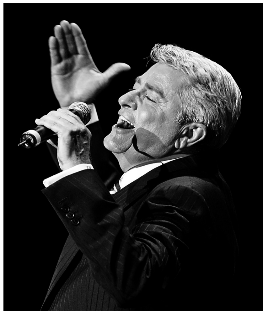
Élégance et charme, humour et simplicité, succès et chorégraphies, c'est ce que Michel Louvain propose à ses fans pour marquer ses 50 ans de carrière.

Michel Louvain, au Théâtre Saint-Denis, ce soir et demain, 19h30, dimanche, 14h.