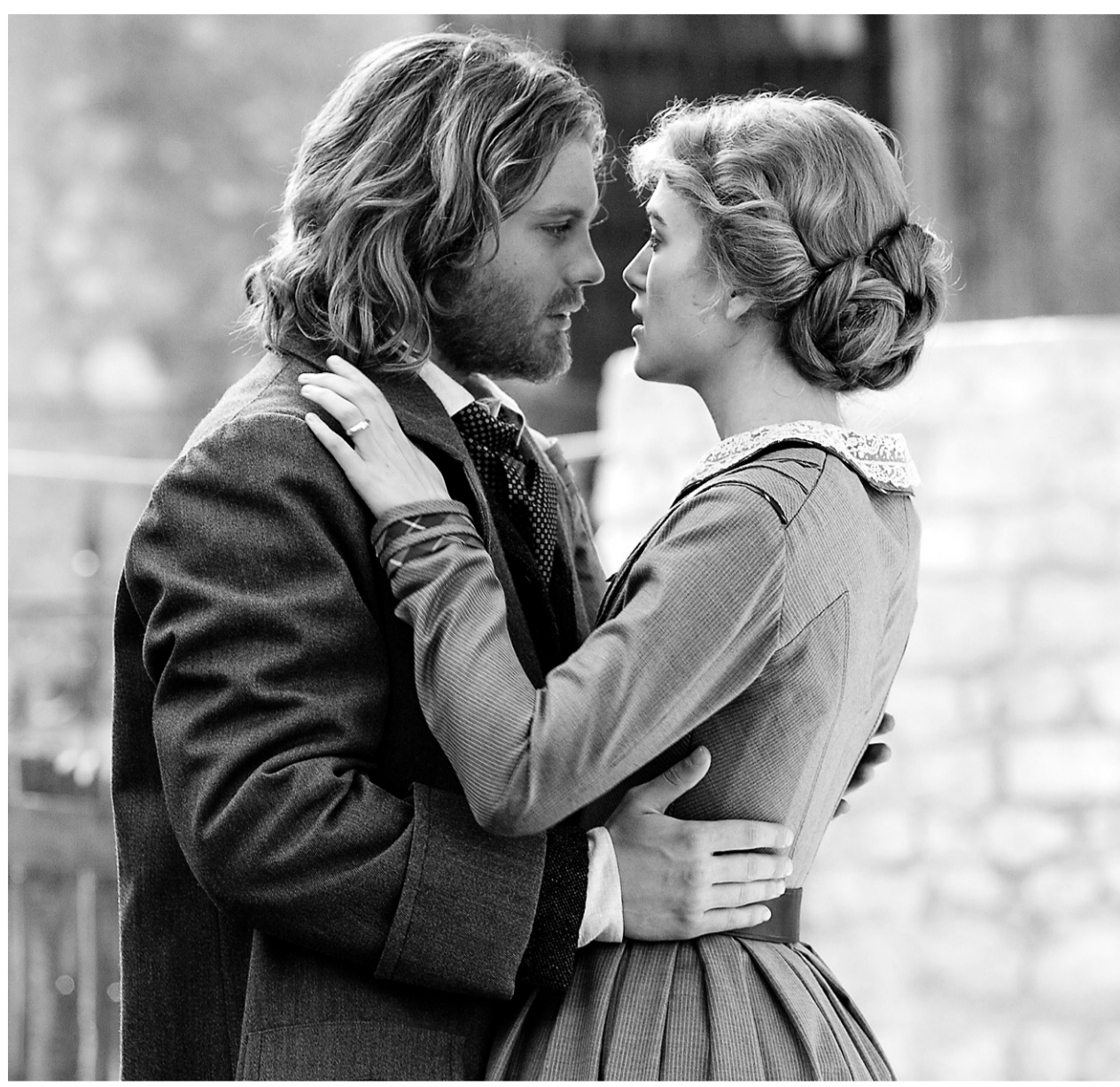
Le jeune acteur américain Michael Pitt n'est pas parvenu à faire écho au bouleversement intime du héros de Soie , le film de François Girard.

français, Girard aurait alors carrément dû en faire une vraie production française. Et faire appel à des acteurs issus de l'Hexagone. Comme l'a fait Julian Schnabel avec Le scaphandre et le papillon . Bon, d'accord, il y a aussi Marie-Josée Croze dans ce film-là. Mais contrairement à la plupart de ses compatriotes, qui débarquent en France pour se servir du pays comme simple décor, le cinéaste peintre américain a choisi de