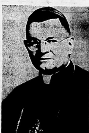
S. E. Mgr Georges-Léon PELLETIER, Ev. de Trois-Rivières, prononcera une allocution et célébrera en plein air une messe de minuit, dans les jardins du Sanctuaire de Notre-Dame-du-Cap à l'ouverture officielle de la fête de l'Assomption. Le 14 au soir, une grande veillée de prière groupe chaque année plus de 40,000 pèlerins qui viennent dès la veille de la solennité mariale rendre leurs hommages à la Mère de Dieu montée au ciel en corps et en âme.

Nous voilà de nouveau à la neuvaïne de l'Assomption. Cette année, le Sanctuaire national de Notre-Dame-du-Cap veut souligner le centenaire des apparitions de Lourdes. Heureuse initiative qui répond fidèlement à l'appel du Souverain Pontife et aux vœux de nos évêques!