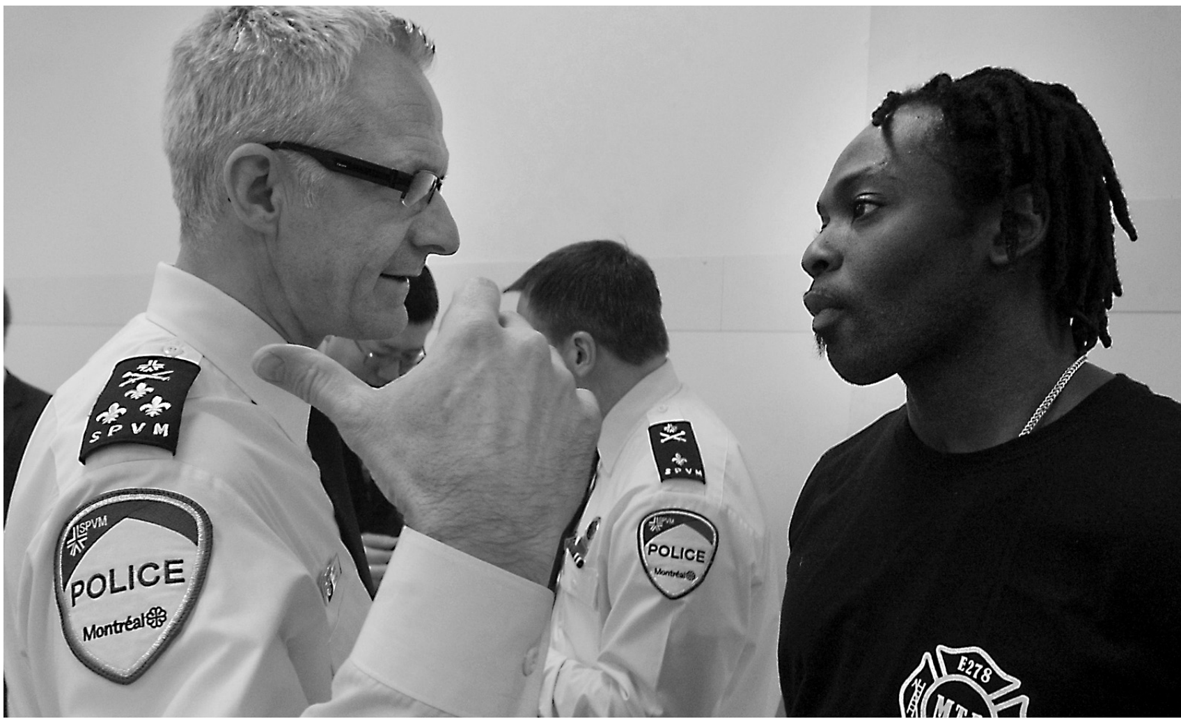
Le chef du SPVM, Marc Parent, lors du dévoilement de la nouvelle politique sur le profilage racial et social.