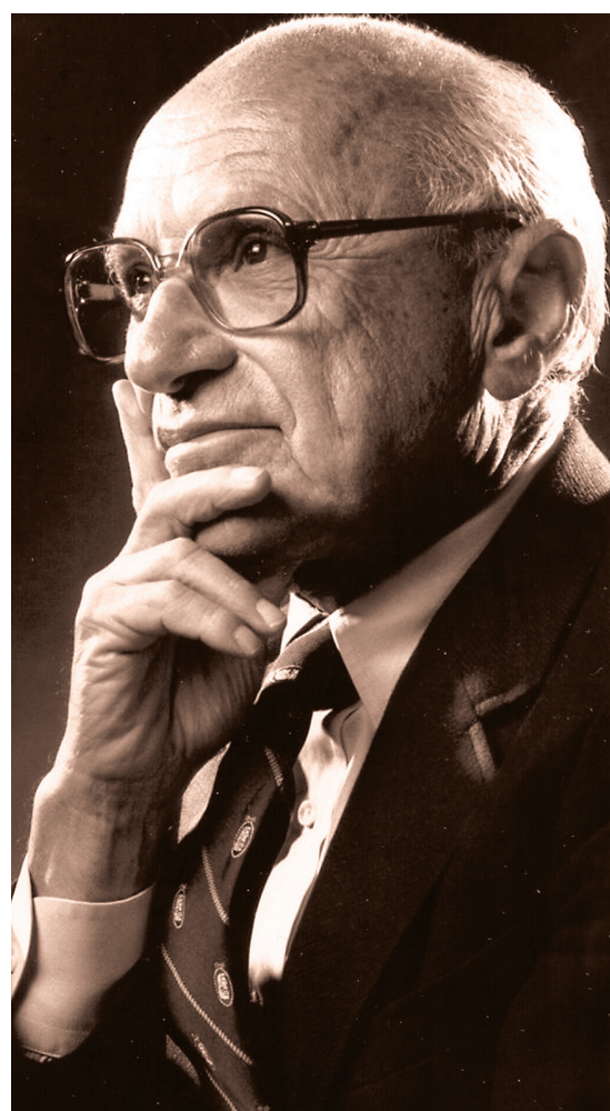
L'économiste Milton Friedman n'aurait pas du tout été surpris de constater les résultats mitigés des plans de relance budgétaire mis en œuvre depuis 2008, ni les crises de finances publiques provoquées par l'endettement massif qu'on observe aujourd'hui aux États-Unis et en Europe.

Cette politique a entraîné la faillite de milliers de banques et une chute du revenu national et a tué dans l'œuf tout mouvement de reprise économique.