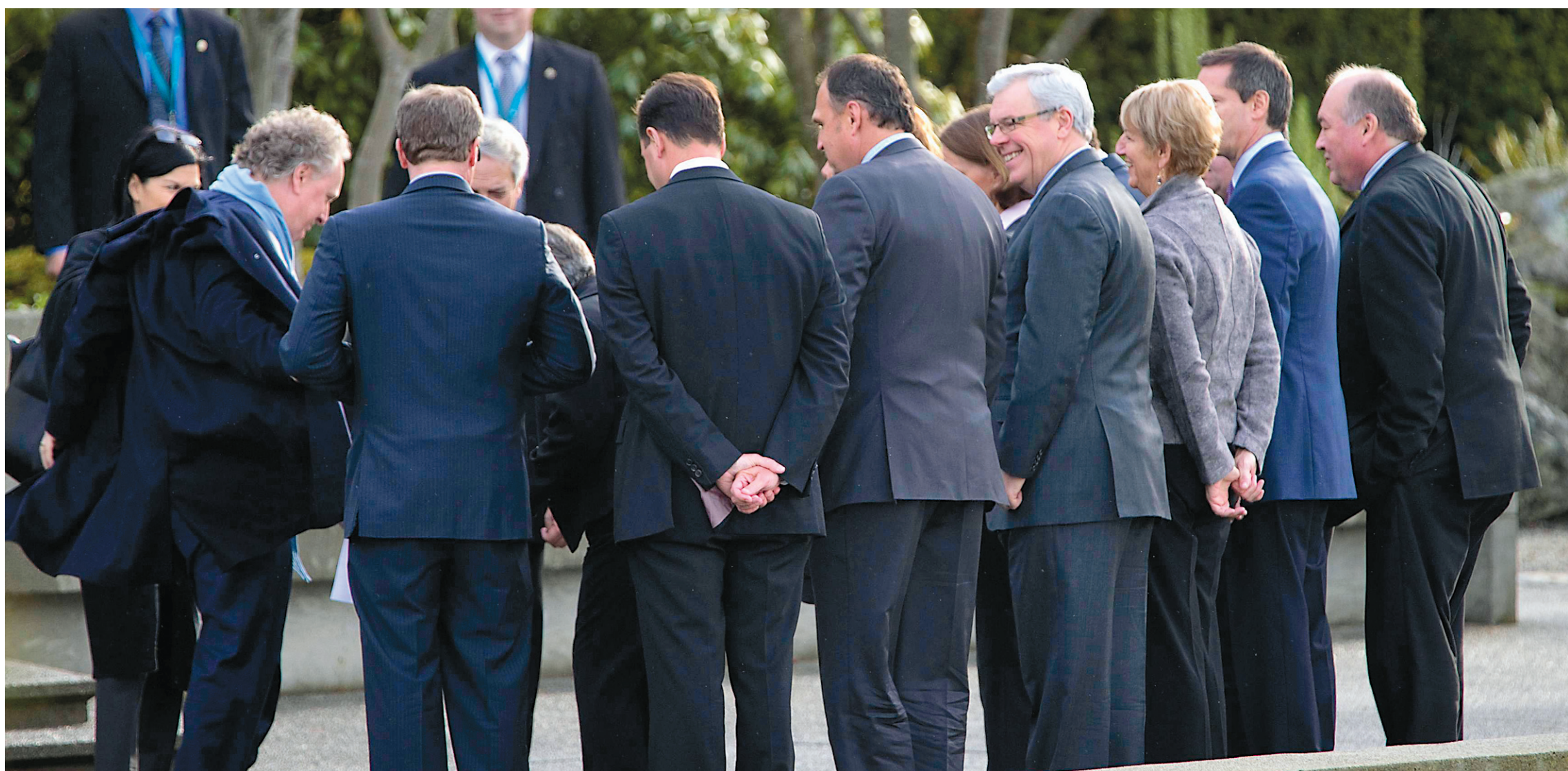
ANDY CLARK REUTERS

Réunis il y a quelques jours à Victoria, les premiers ministres des provinces se préparaient à la traditionnelle prise de photo officielle.