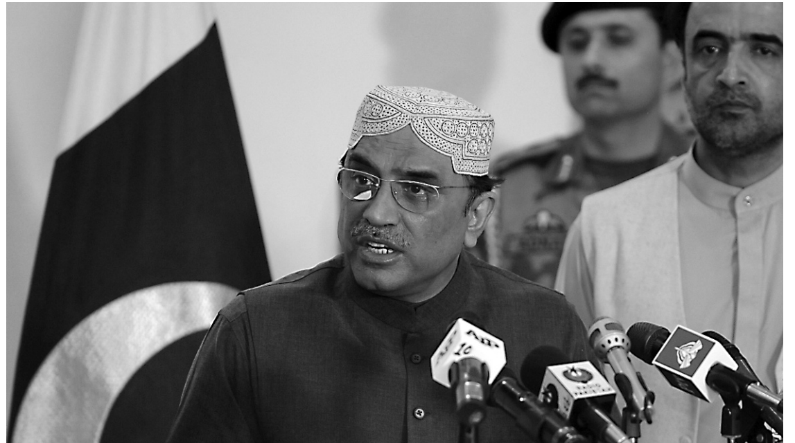
Le président pakistanais, Asif Ali Zardari

Pour la première fois, la capacité de l'armée à défendre le pays a commencé à faire débat dans la société et dans les médias pakistanais, en plus des habituels reproches d'alliance trop poussée avec les Américains. Même si elle reste malgré tout considérée comme l'institution la plus stable du pays et ne montre pas de signes inquiétants de divisions. «Les forces armées sont très disciplinées», a expliqué à Libération un haut responsable sous couvert d'anonymat. «Oui, l'armée