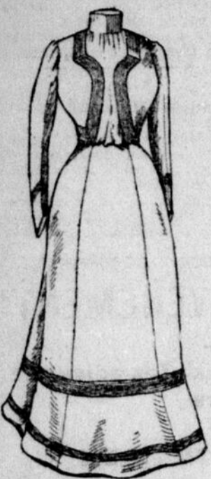
Prix : $2.98

Voyez l'étalage dans nos vitrines pour les prix. Jamais dans l'histoire du commerce des Marchandises Sèches, les Costumes n'ont été vendus si bon marché, plusieurs centaines ont été vendus la semaine dernière à $2.98, $3.95, $4.95