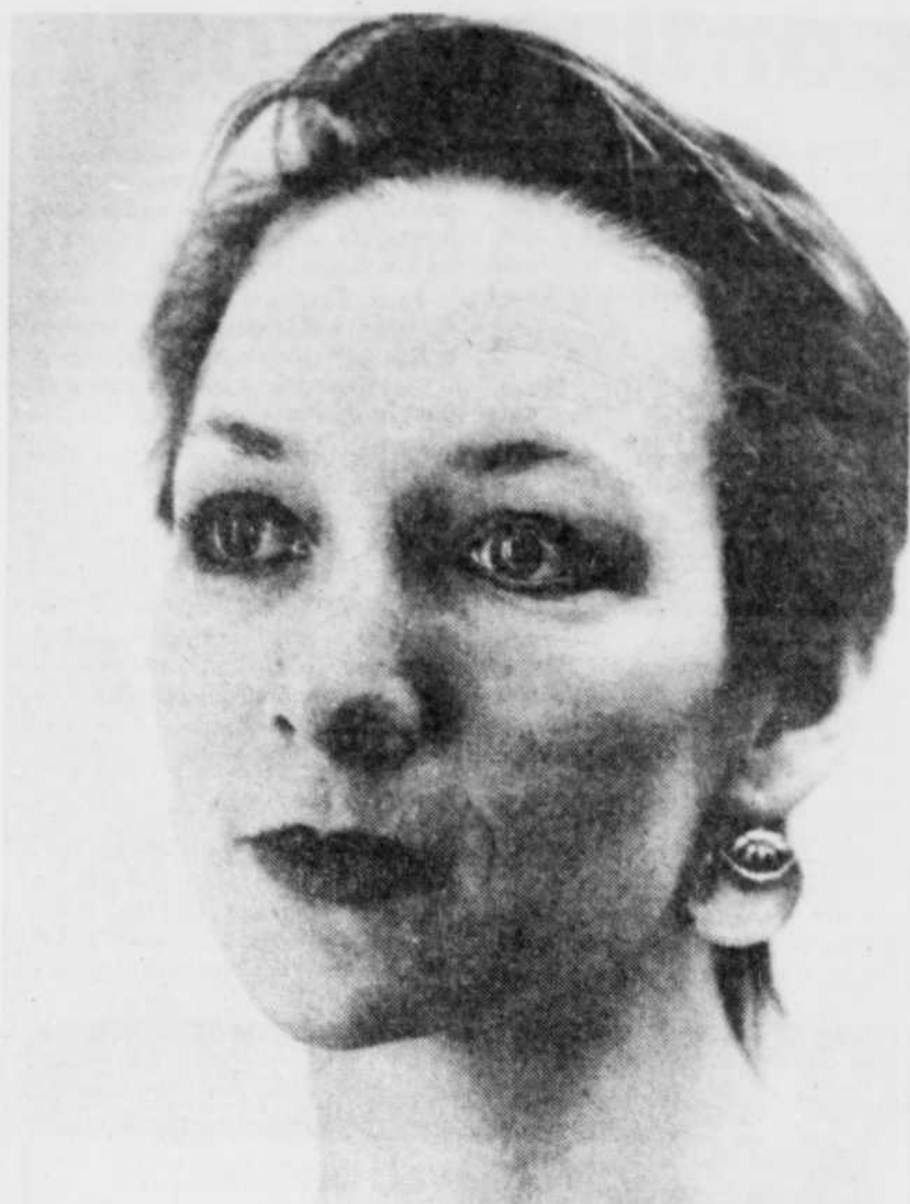
"La danse, comme les autres arts, permet d'exprimer sa vulnérabilité, trop souvent étouffée par la vie."

"Quand j'ai quitté Québec, en 1980, je ne pensais pas y revenir si