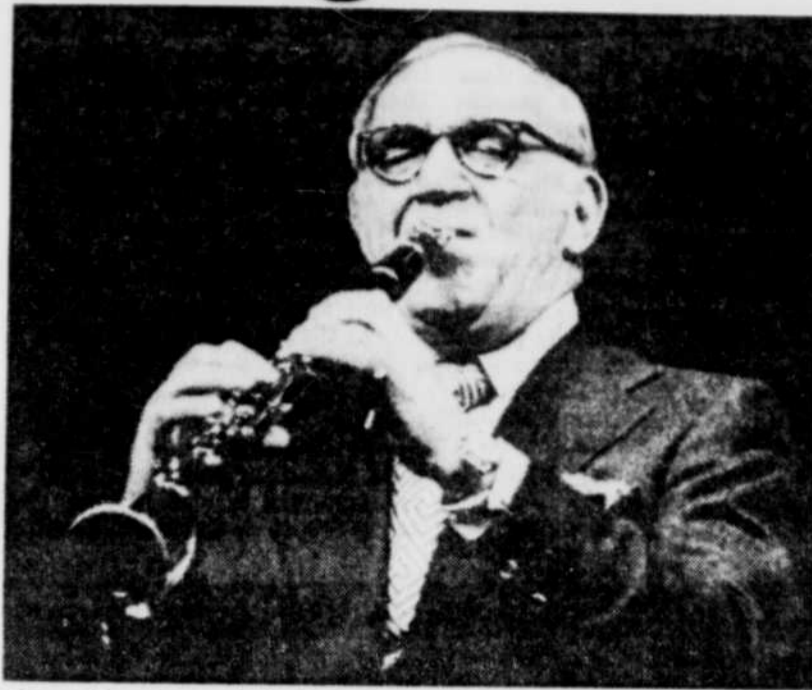
Benny Goodman, le "roi du swing" était également un musicien classique de classe

pianistique que Perahia traduit d'abord et avant tout en poète, ce qui est devenu un peu beaucoup sa marque de commerce et le distingue