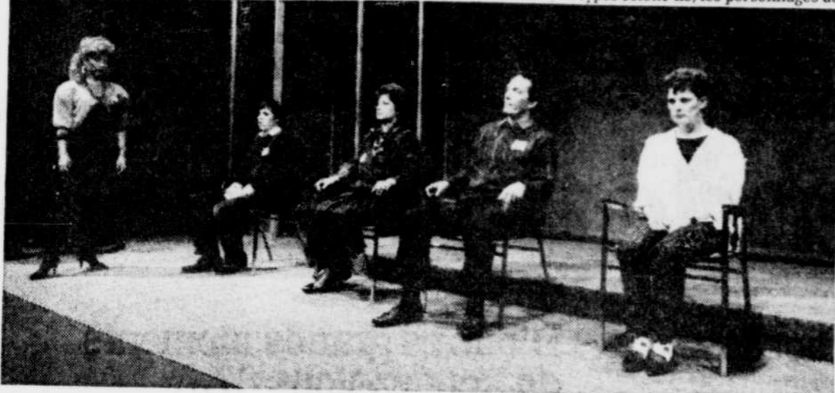
"La nuit des p'tits couteaux" repassera le 15 février à la salle Albert-Rousseau.

teurs d'âmes en panne qui promettent la renaissance en trois jours.