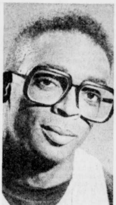
Le réalisateur Spike Lee.

Enfin un film qui nous change des super-productions trop bien astiquées à coups de millions de dollars et souvent réalisées en