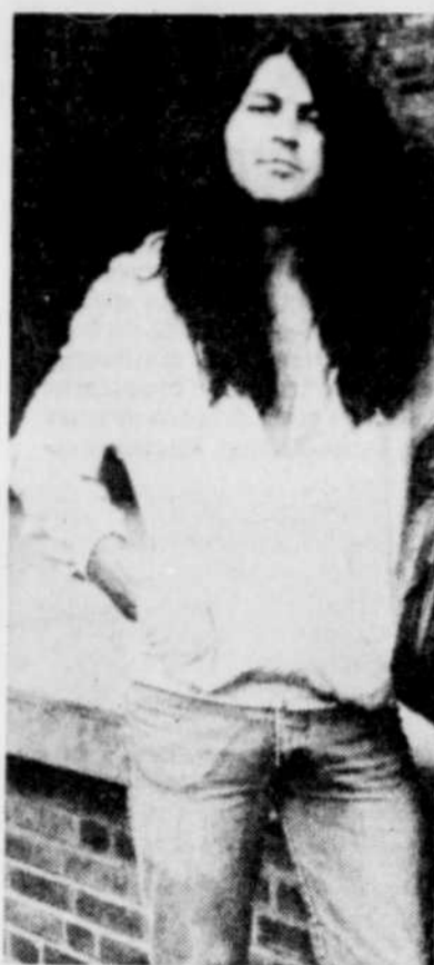
Ian Gillan, un des membres au bouillant caractère du groupe britannique Deep Purple.