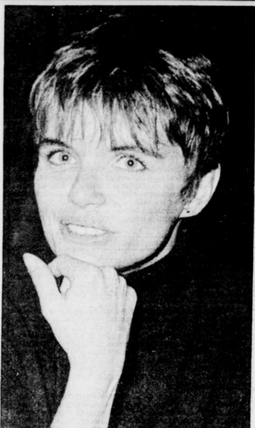
Coll. spéciale, Michel Parent

Au plan musical, elle parle de chansons plus riches et qui vont plus loin, dans un sens qui ne mènera pas à un album jazz ou latin, mais "typiquement Diane Tell, influencée par les couleurs de base: jazz, rock et chanson".