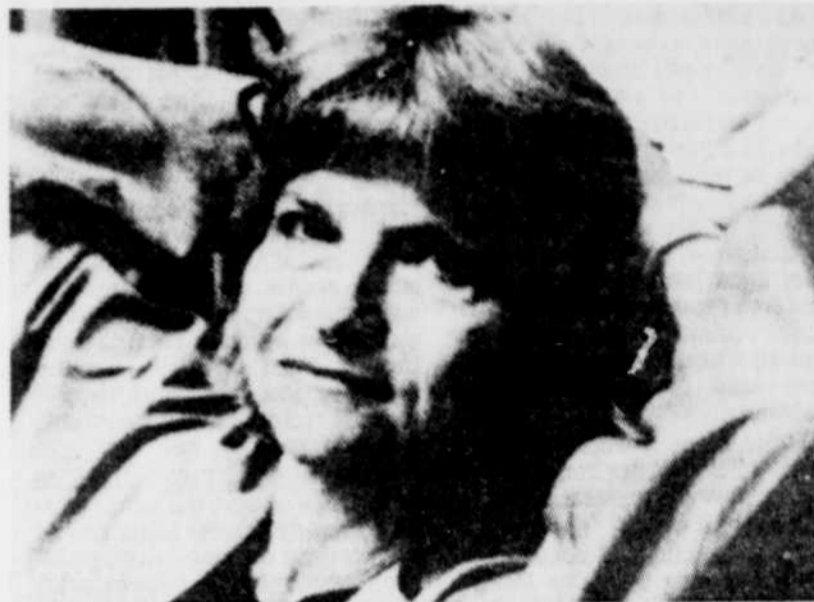
Alison Lurie, lauréate du Prix Pulitzer de littérature