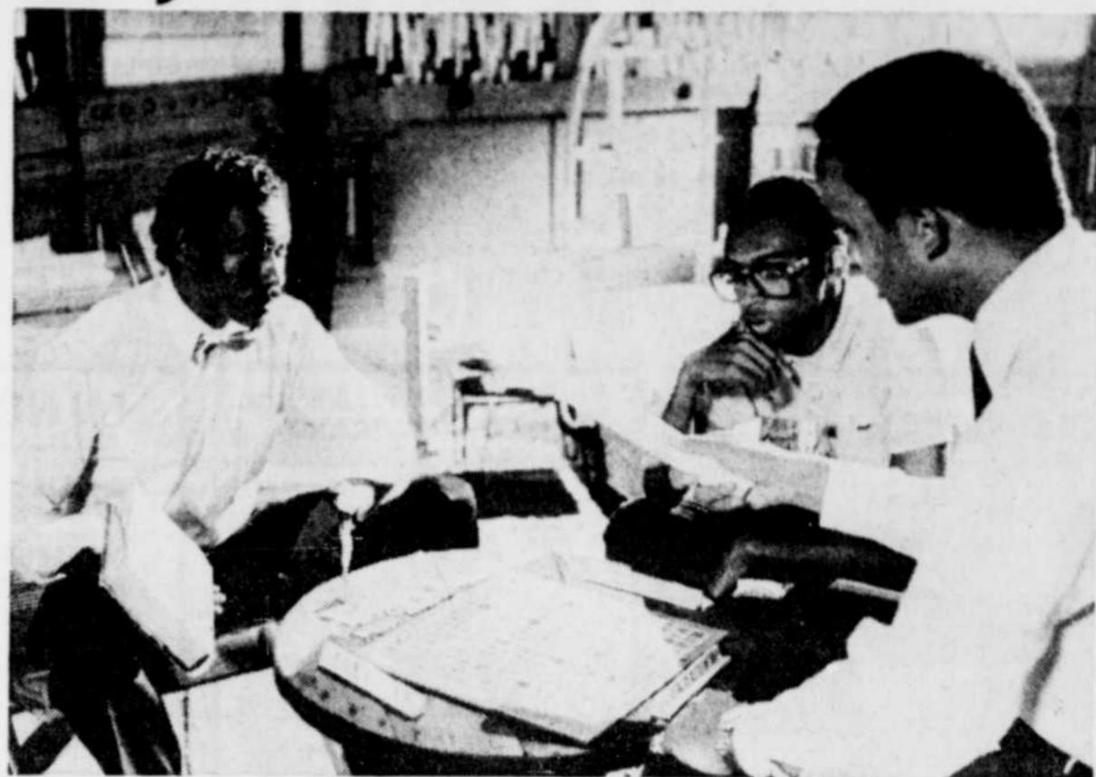
Lola Darling a pensé qu'il serait bon que ses trois amants se connaissent en les invitant à dîner chez elle le jour de l'Action de grâce. Ce ne fut sûrement pas un repas gastronomique, puisque le film de Spike Lee n'a coûté que $175,000. Mais le succès du film est tel qu'un producteur de télévision vient de lui offrir cinq millions de dollars pour en faire une série télévisée.

La photographie en noir et blanc est d'un esthétisme réussi, dans ce jeu de lumière incessant, lumière incandescente sur ces peaux noires. Et parfois, pour augmenter ce plaisir bien particulier,