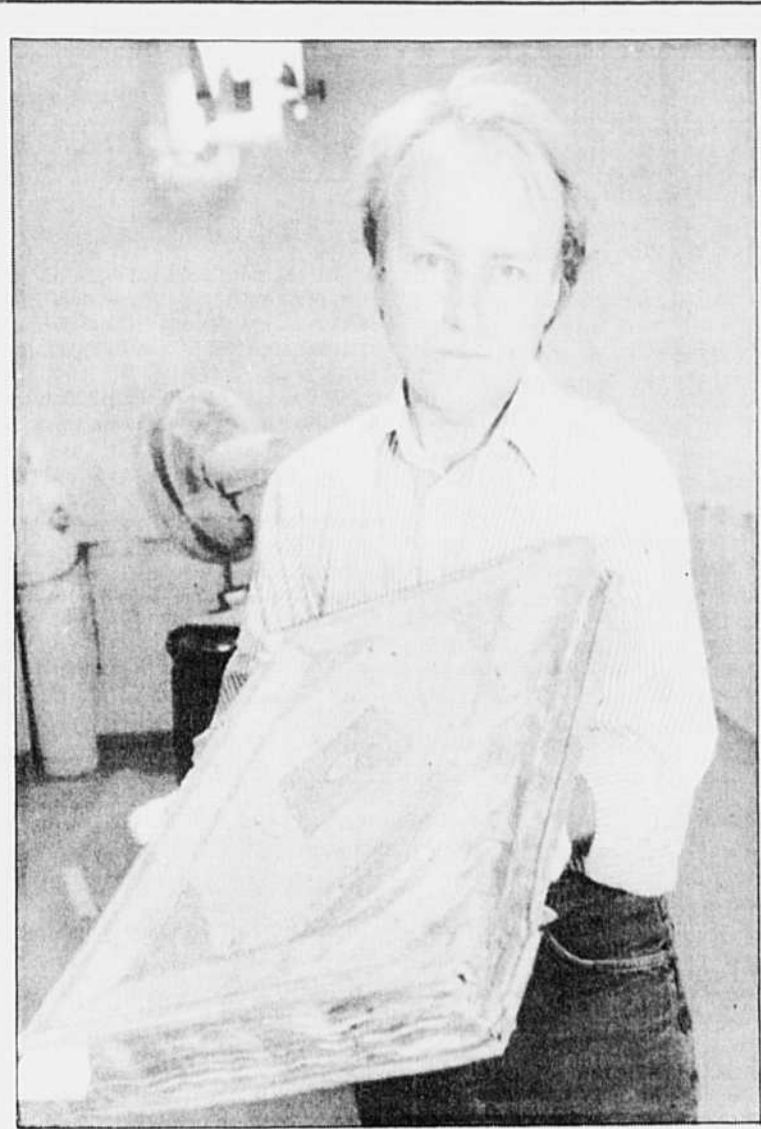
Coûteuse négligence

Des historiens soutiennent que les dommages survenus cette semaine aux Archives nationales auraient pu être évités si le gouvernement accordait plus d'importance à l'histoire du pays. « C'est très tentant de mettre l'histoire au dernier rang des priorités en période de restrictions nationales », commentait M. Peter C. Newman, lui-même auteur de plusieurs ouvrages d'histoire. « Et pourtant, c'est tout ce que nous avons. C'est