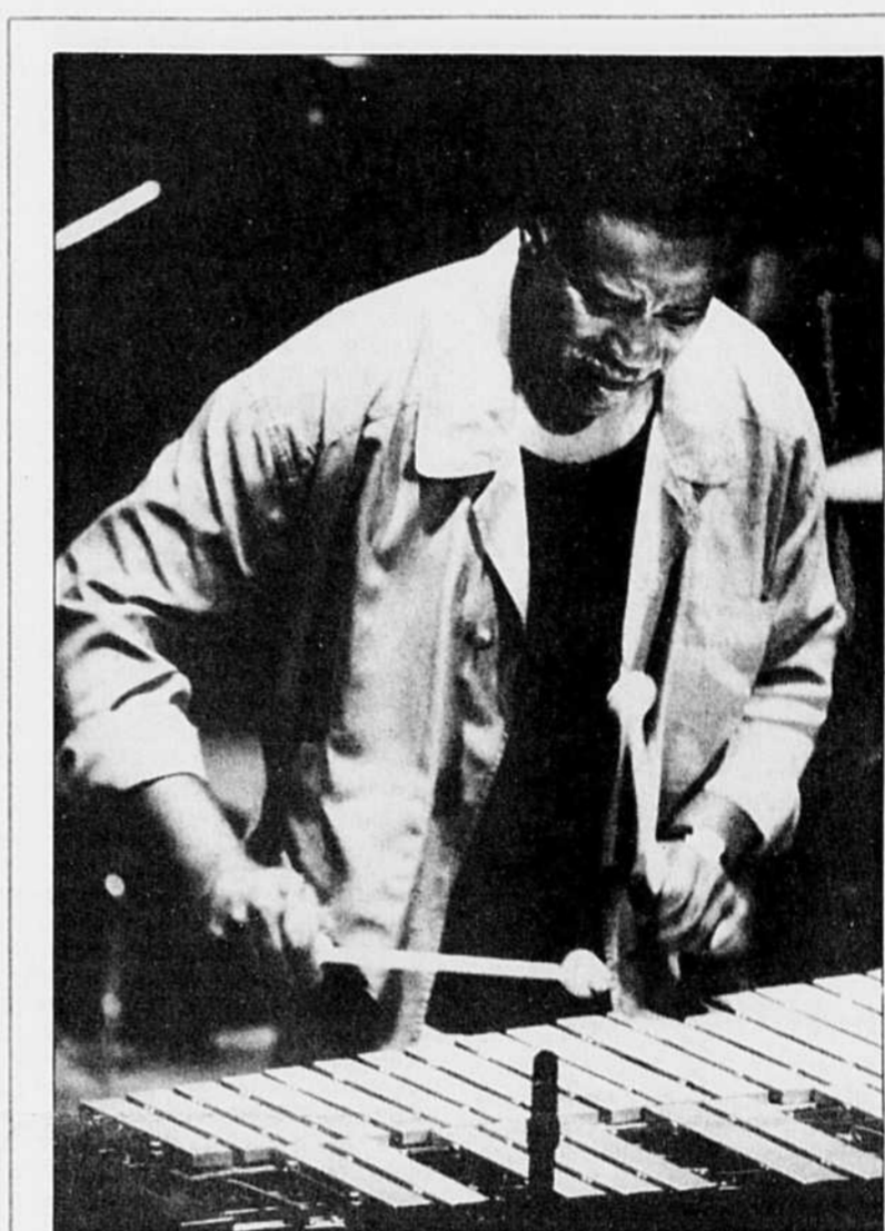
Le vibraphoniste Bobby Hutcherson