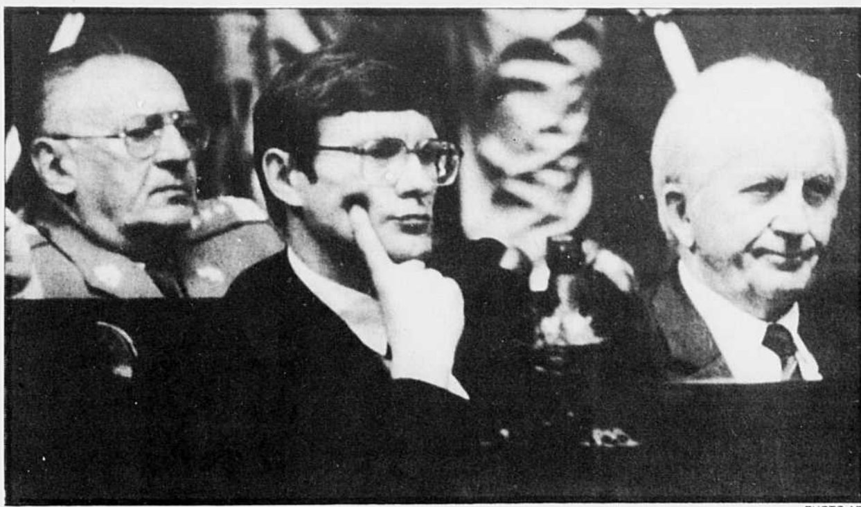
Le ministre de la Défense Florian Siwicki (à gauche) et le ministre de l'Agriculture Czeslaw Janiki (à droite) écoutent le premier ministre annoncer leur congédiement du cabinet. Le ministre des Finances Leszek Balcerowicz, le grand architecte des réformes économiques, est assis au centre.

Plusieurs bâtiments et véhicules ont été endommagés et la police a bouclé l'accès des lieux, où s'activaient secouristes et pompiers.