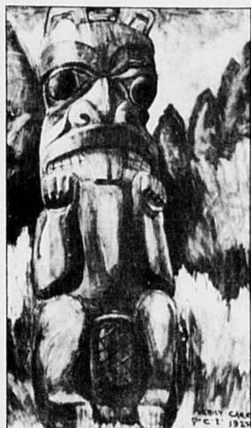
Queen Charlotte Islands Totem (Haina), d'Emily Carr.

Le peuple haïtien réclame, non pas d'abord des élections, mais justice et respect des droits fondamentaux, estiment les représentants des communautés missionnaires. Page A-7