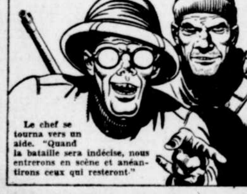
Le chef se tourna vers son aide. "Quand la bataille sera indécise, nous entrerons en scène et anéantirons ceux qui resteront"