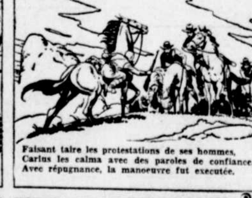
Faisant taire les protestations de ses hommes, Carlus calma avec des paroles de confiance. Avec répugnance, la manœuvre fut exécutée.