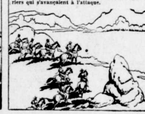
Cependant, dans la vallée, Groot Carlus et ses hommes étaient absolument sur la route des guerriers qui s'avançaient à l'attaque.