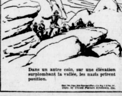
Dans un autre coin, sur une élévation surplombant la vallée, les nazis profitent.