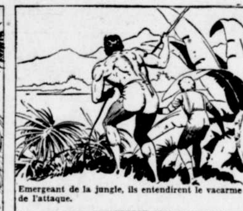
Emergent de la jungle, ils entendirent le vacarme de l'attaque.