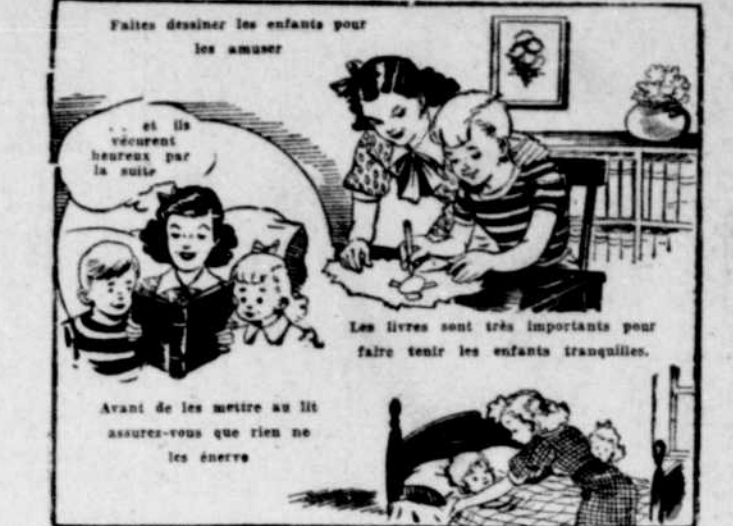
Faites dessiner les enfants pour les amuser. Les livres sont très importants pour faire tenir les enfants tranquilles.

Vous pouvez leur raconter l'histoire du chaperon rouge ou tout autre conte pour les enfants en les mimant. Si vous devez les mettre au lit, lisez-leur un conte ou faites-leur regarder des images juste à la dernière minute, de manière qu'ils ne soient pas excités et difficiles à calmer. Quand vous avez fini d'un livre, d'un crayon ou de tout autre objet, que les enfants les remettent en place. N'insistez pas pour qu'ils le fassent seuls s'ils n'en ont pas l'habitude. Au lieu de risquer une scène faites-le vous-même, essayant de vous faire aider en leur disant que c'est à qui le ferait le premier. Parlez toujours à voix douce et basse. Ne criez jamais, jamais aux enfants, vous n'en arriveriez qu'à les rendre plus difficiles à manœuvrer. Faites-leur plaisir, vous aurez moins de difficultés avec eux.