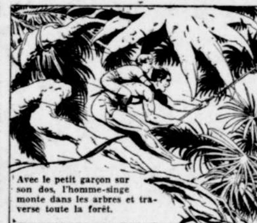
Avec le petit garçon sur son dos, l'homme-singe monte dans les arbres et traverse toute la forêt.