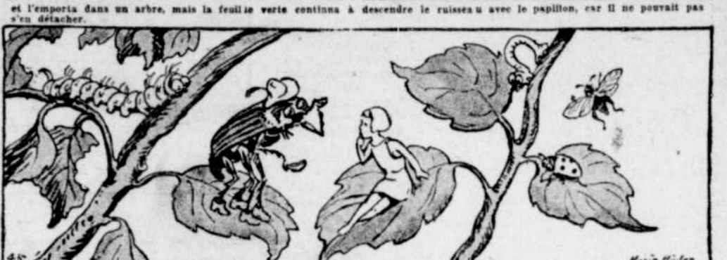
Mon Dieu, comme la pauvre Petite Poucette fut étonnée lorsque le hanneton l'emporta dans l'arbre, mais ce qui la désolait le plus, c'était de ne pas savoir si le beau papillon attaché à la feuille, pourrait se délivrer, autrement il devait périr de faim. Mais cela était bien égal au hanneton. Il prit place avec elle sur la plus grande feuille verte de l'arbre, lui donna le meilleur des fleurs à manger et lui dit qu'il était charmant, même si elle ne ressentait pas à sa hauteur.