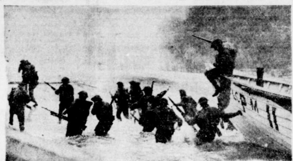
Les hommes sautent des bateaux d'invasion derrière un mince écran de fumée répandue par la Marine, qui jouera un rôle important dans l'invasion, et ils pataugent dans l'eau jusqu'à la ceinture avant de mettre pied sur la terre ferme. Les balles des mitrailleuses Bren leur sifflent au-dessus de la tête.