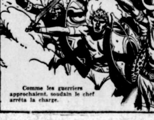
Comme les guerriers approchaient, soudain le chef arrêta la charge.