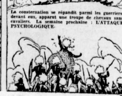
La consternation se répandit parmi les guerriers, devant eux, apparut une troupe de chevaux sans cavaliers. La semaine prochaine: L'ATAQUE PSYCHOLOGIQUE.