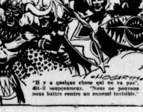
"Il y a quelque chose qui ne va pas", dit-il soupçonneux. "Nous ne pouvons nous battre contre un ennemi invisible."