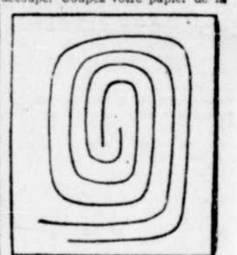
grandeur d'une carte postale, en suivant les lignes du diagramme de la vignette, tracez au crayon deux cercles, venant se terminer au centre et ayant un petit espace entre les deux.

Un éléphant ne peut passer par le chas d'une aiguille. Et vous allez dire qu'un petit garçon ne peut pas, lui non plus, se passer la tête par une fente pratiquée dans une carte postale. Mais en réalité la chose est possible, s'il connaît le truc.