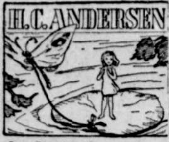
La Petite Poucette

Avant de les mettre au lit assurez-vous que rien ne les énerve. Les livres sont d'une grande utilité pour amuser les enfants. Vous pouvez en apporter un et même plusieurs avec vous. Avec soin de ne pas choisir qui soient au-dessus de la compréhension des enfants. Choisissez surtout ceux dans lesquels il y a beaucoup de gravures, surtout si elles sont en couleur. Claude aime les trains, prenez un livre qui parle de trains. Suzanne