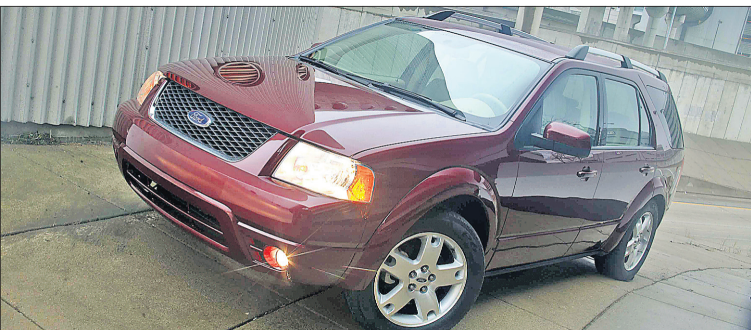
Des phares capables d'ouvrir une porte de garage? Cette technologie sera bientôt disponible chez Home Depot.

Pour les équipements sportifs odorants, le fabricant de meubles de rangement Evolution Storage a conçu une armoire munie d'un ventilateur. L'air y circule mieux, limitant les mauvaises surprises au moment d'ouvrir les portes plusieurs jours après y avoir déposé ses effets. L'hiver, les vêtements mouillés séchent plus rapidement. Coût: à partir de 1700$