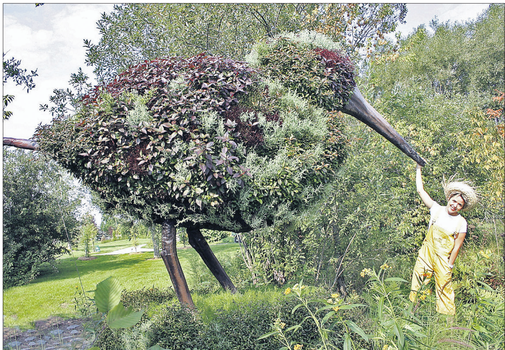
La Mille Bécassine est une des neuf mosaïcultures géantes qui accueillent les visiteurs du parc Marie-Victorin, à Kingsey Falls.

La visite aura donc lieu samedi le 29 juillet et commencera par un arrêt, vers 9 h 30, à la billetterie du festival, à Joliette, un endroit facile à repérer grâce aux panneaux touristiques bleus. En échange de vos billets, on vous remettra la carte du circuit. Une boîte à lunch vous sera aussi offerte dans un des jardins. Le coût est de 50 $ par personne et on réserve sa place en téléphonant sans frais au 1-800-245-7636, poste 24.