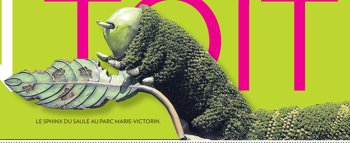
LE SPHINX DU SAULE AU PARC MARIE-VICTORIN.