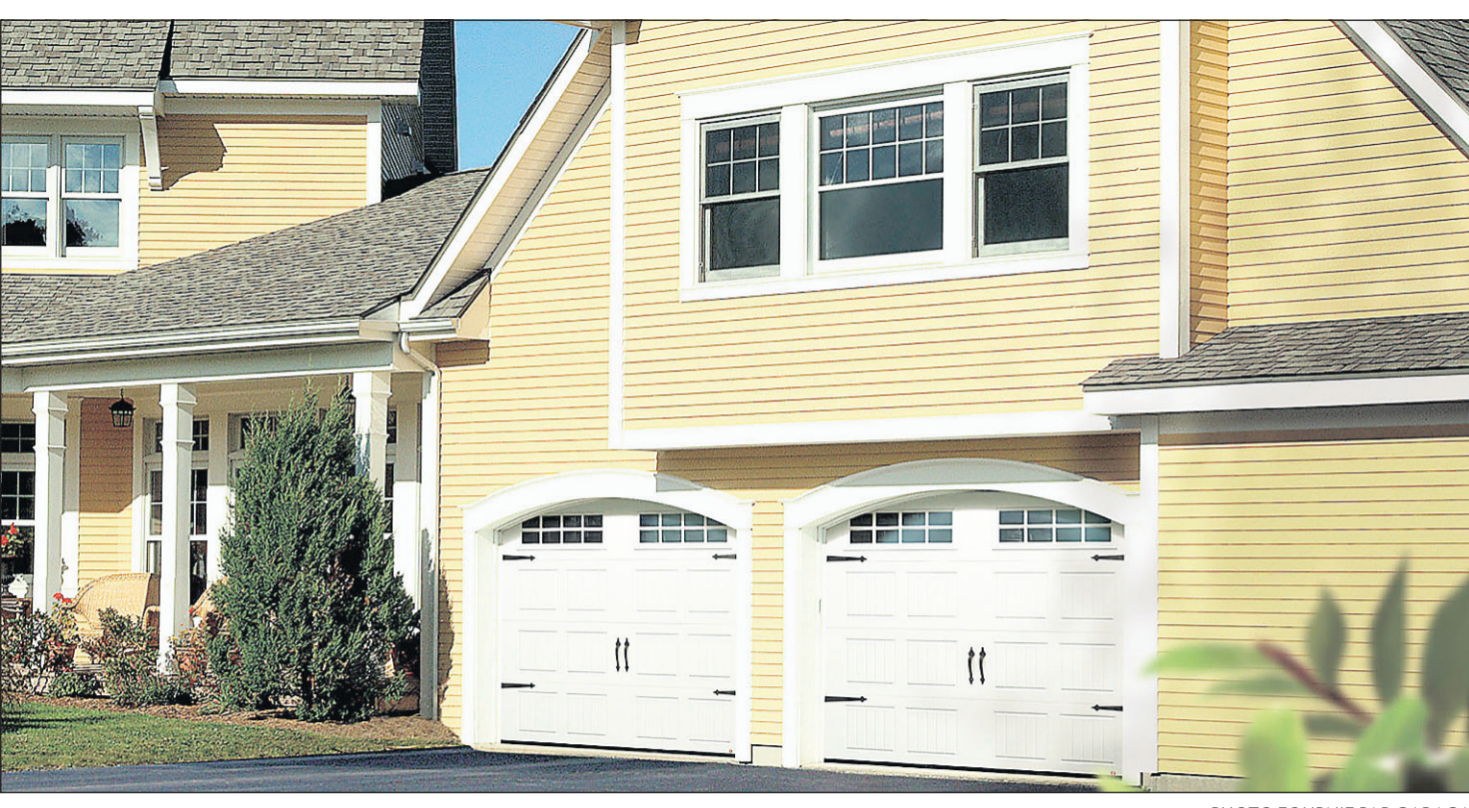
Les portes de garage champêtres gagnent en popularité.