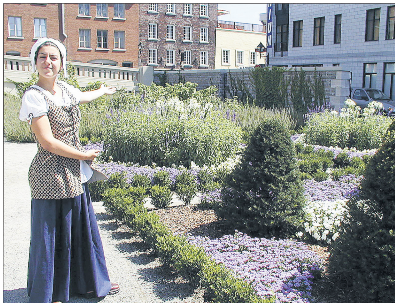
Bienvenue au jardin du Château Ramezay.