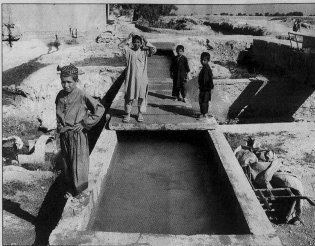
Un projet de canal d'irrigation dans le village de Kulcha Bad, au sud de Kandahar.

En effet, le temps presse. Dans le sud du pays, le vent qui soulève la poussière porte d'un village à l'autre la complainte des habitants et on en voit certains rejoindre la guérilla talibane, qui paye ses com-