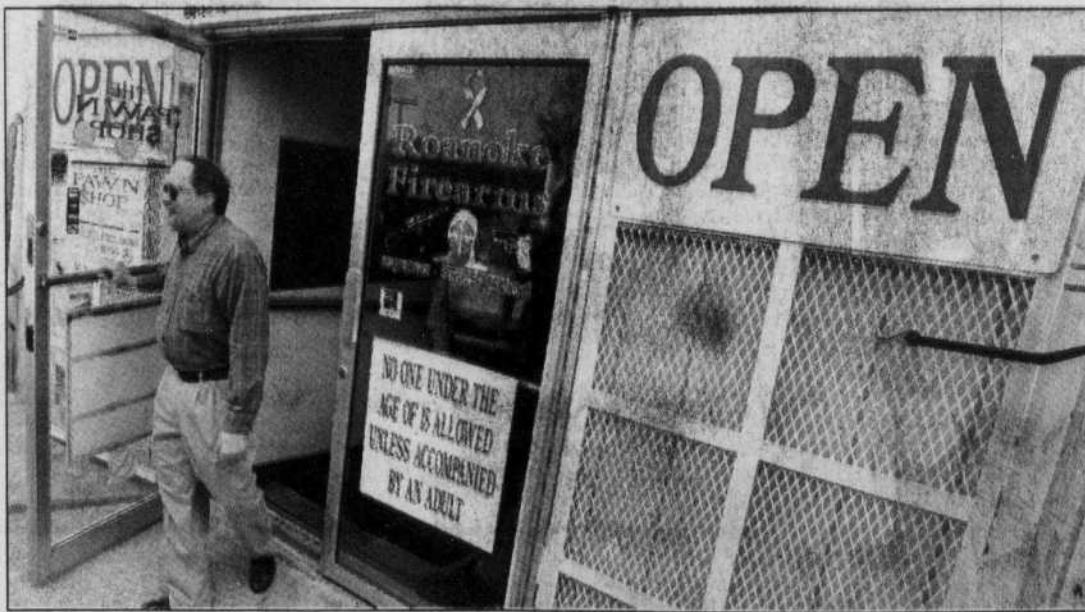
Les magasins vendant des armes foisonnent aux États-Unis.

Si le chef de la Maison-Blanche et le gouverneur de la Virginie semblaient ainsi à cours d'explications pour saisir les raisons d'une telle violence, d'autres personnes aux États-Unis tiraient rapide-