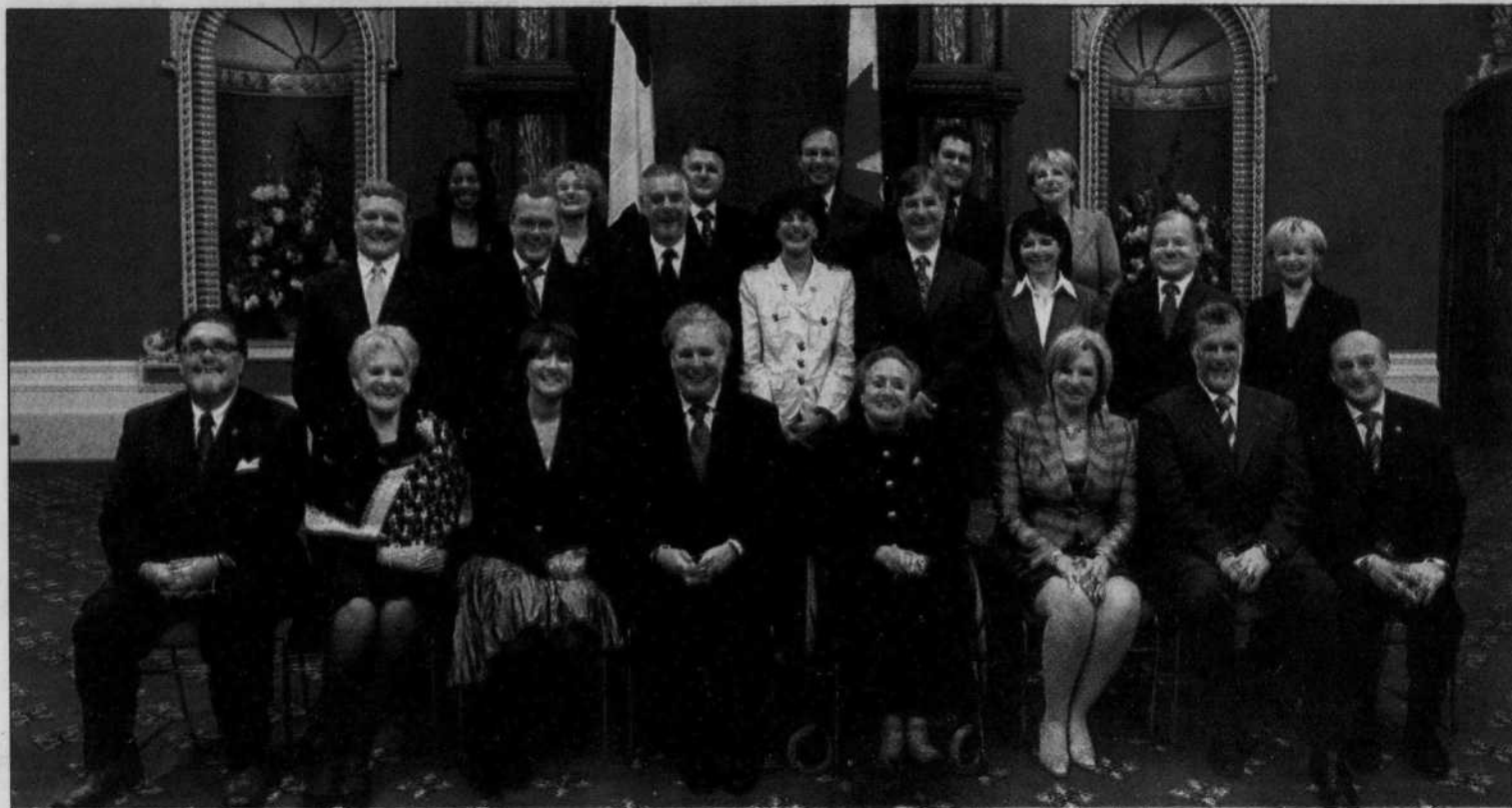
Jean Charest a décidé de faire subir une cure minceur à son Conseil des ministres.

On connaît déjà une mesure que le gouverne-