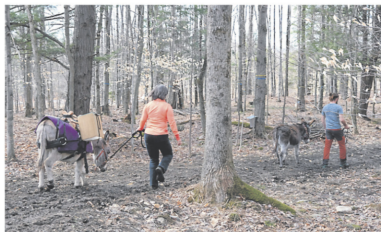
Les ânes ne se contentent pas d'aider à la récolte de l'eau des érables, ils participent aussi aux travaux dans les champs. — LA VOIX DE L'EST, ALAIN DION

Les ânes sont les attractions de ce domaine de 40 acres où la permaculture dicte sa loi