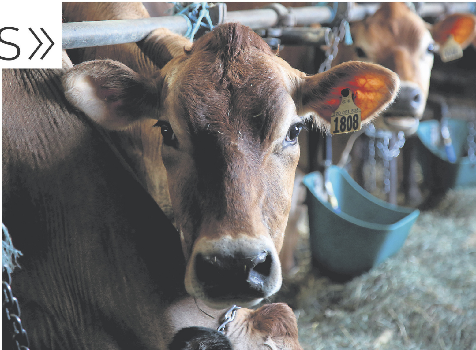
Sylvie Larochelle doit organiser les gestations, les traites, choisir les semences pour chacune des vaches, coordonner les soins vétérinaires, etc. « Une ferme laitière, ce n'est pas juste traire les vaches. »

Que l'on soit femme ou homme, âgé ou jeune, Sylvie croit que tous devraient avoir leur chance s'ils veulent partir une ferme. « Que tu sois