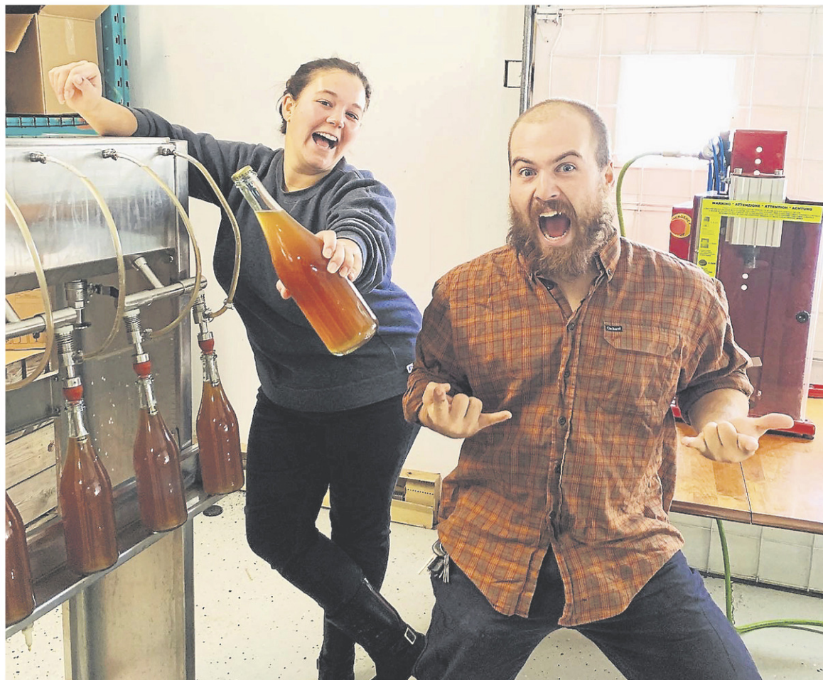
À terme, la ferme devrait produire de 25 000 à 30 000 litres de cidre annuellement, et dont les premières offrandes, embouteillées cet hiver, pourraient être disponibles au printemps ou à l'été. — FOURNIE

Le couple souhaite par ailleurs effectuer un virage biologique et limiter la quantité d'intrants, notamment de pesticides, dans leur production. Les cidres fermenteront donc naturellement, sans sulfite ou autre produit chimique. « Ça cadre aussi avec notre mode de vie. On souhaite un mode de production plus équilibré, plus santé et avec le moins d'impacts environnementaux possibles, détaille M. Arseneault-Chiasson. Ça s'inscrit dans nos