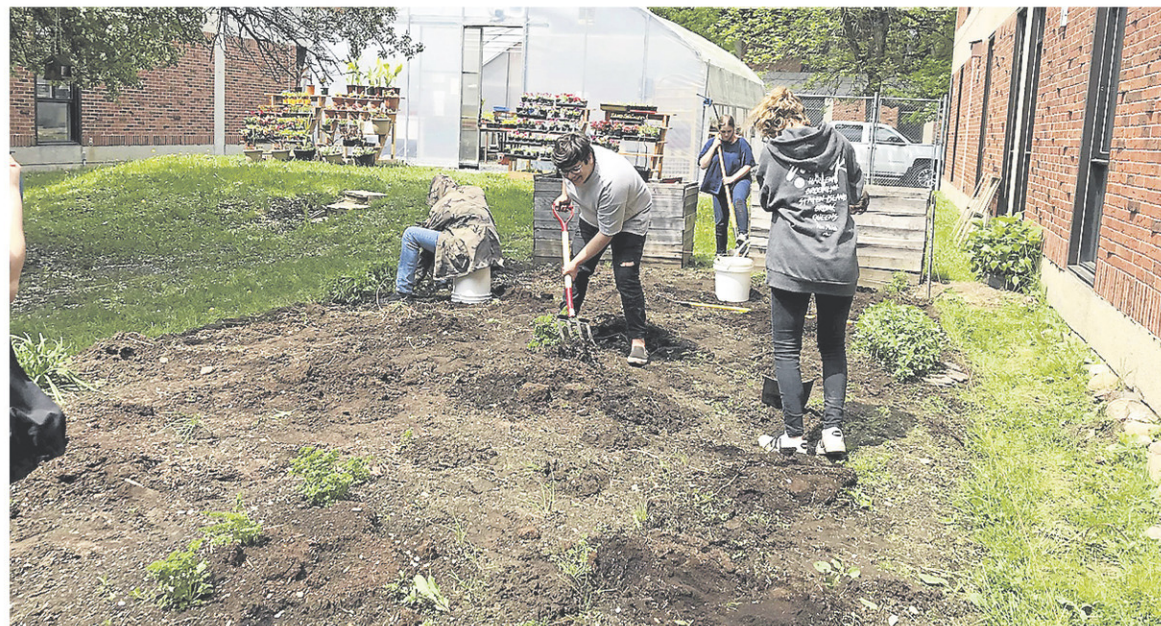
Les élèves en adaptation scolaire à l'école secondaire Massey-Vanier adorent jardiner et pourront bientôt profiter d'une nouvelle formation. — VAL-DES-CERFS

ils seront notre main-d'œuvre de demain. Ils sont plus manuels qu'intellectuels. On essaie de développer ces qualités-là pour les axer vers le marché du travail. On allume une lumière au jeune qui ne sait pas ce qu'il va faire dans la vie. »