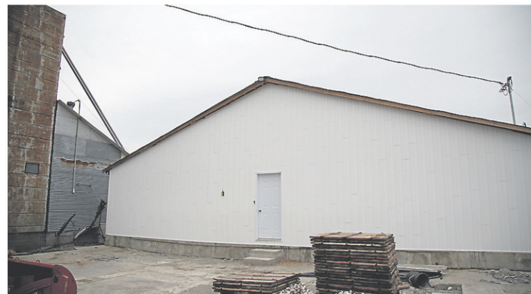
Le couple a pu développer son projet en louant d'abord une terre à Saint-Liboire et en rénovant des bâtiments qui avaient grandement besoin d'amour.

« Je me lève le matin, je prends mon café puis je vais faire le train avec mes enfants. Pour moi, ça n'a pas de prix. »