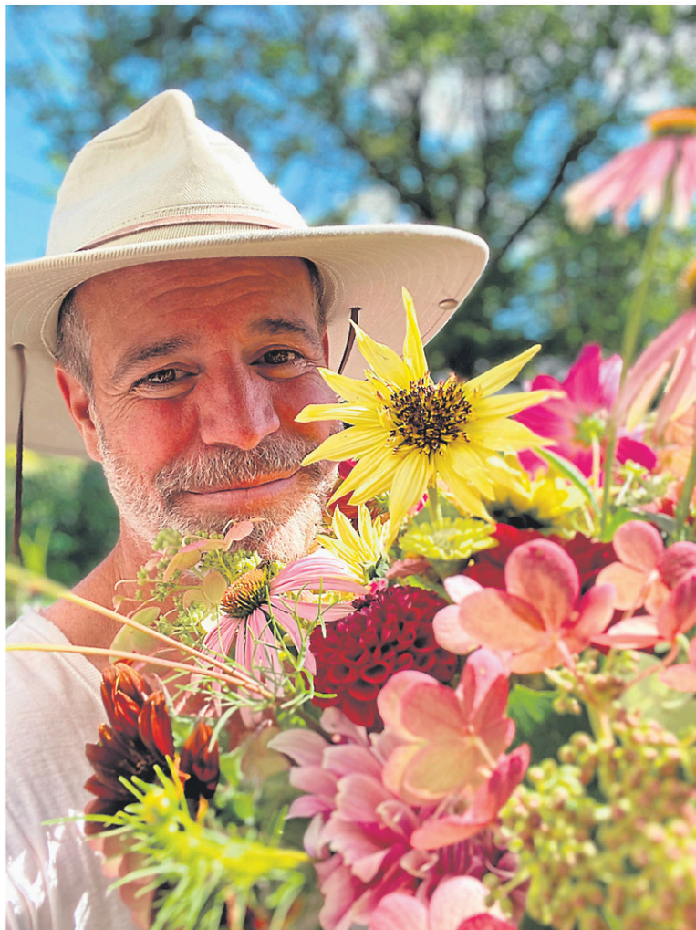
Outre les vinaigres, les agriculteurs cultivent plusieurs variétés de fleurs. Celles-ci sont notamment destinées à des marchands locaux.

Malgré la beauté du site au cœur d'une luxuriante nature, le couple tient à garder son intimité. La ferme n'est donc pas ouverte au