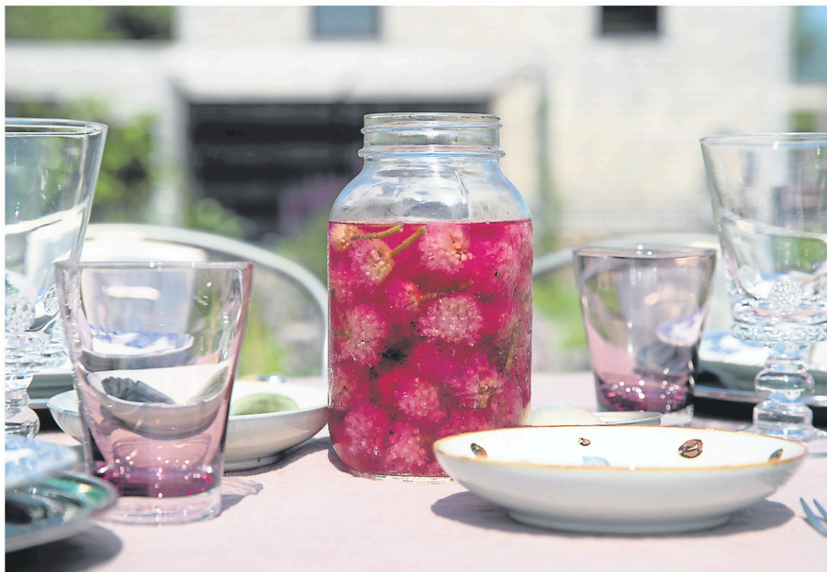
Chaque pot de vinaigre à la ciboulette requiert 50 fleurs en macération. — LA PRESSE, MARTIN TREMBLAY

350 Raygo, La Présentation, Qc - sortie 123 autoroute 20 450 795-2966 - 514 875-1600 www.monkubota.ca