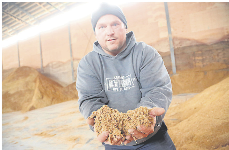
L'ÉcoBed est un mélange de bran de scie et de chaux. Il peut remplacer le sable dans les étables.