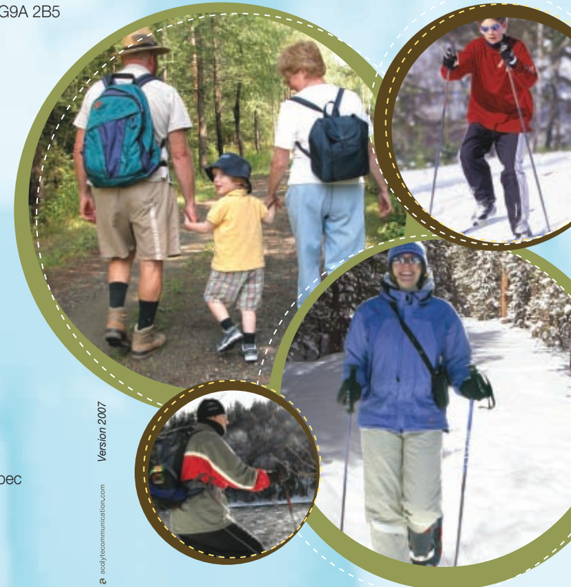
Version 2007 a. asoq/communication.com

Kino-Québec est un programme du ministère de l'Éducation, du Loisir et du Sport, du ministère de la Santé et des Services sociaux et des agences de la santé et des services sociaux.