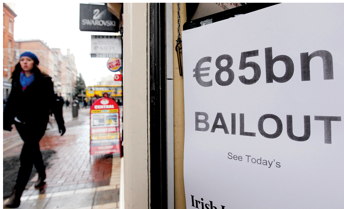
Des sommes importantes ont dû être injectées dans l'économie pour aider Dublin.

La crise n'est pas la première. Il y a eu la crise asiatique de 1997, qui a touché plusieurs pays coup sur coup, la crise du rouble en 1998, etc. De