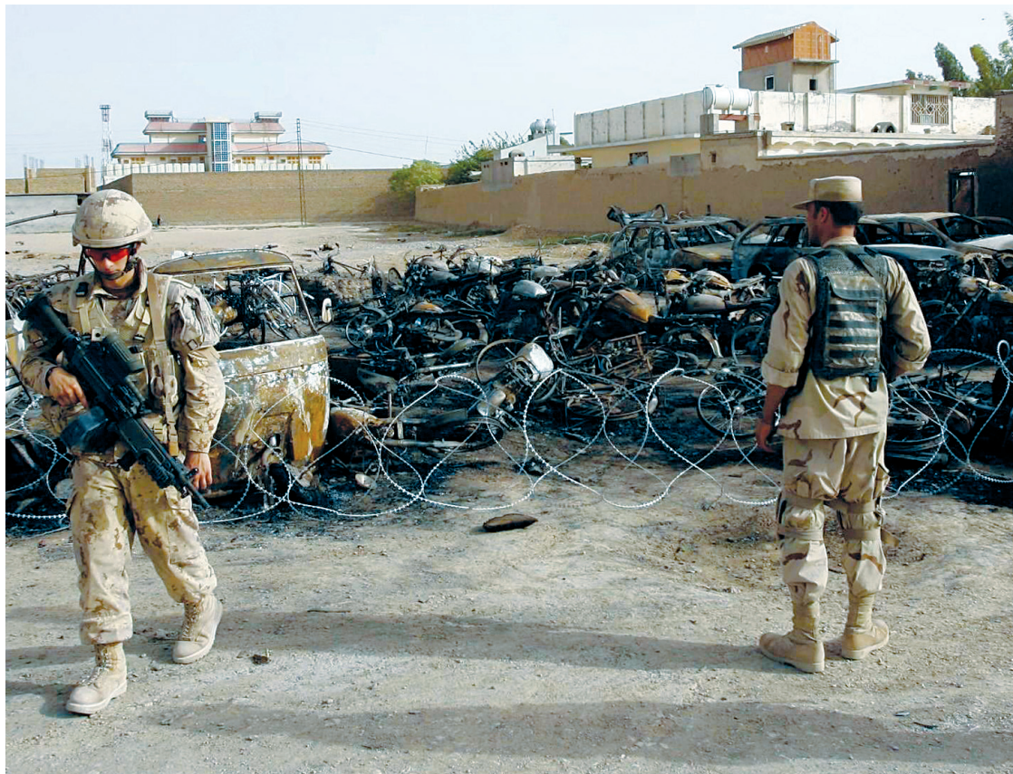
Un soldat canadien et un membre de la force de sécurité afghane sur les lieux d'un attentat à Kandahar en mai.