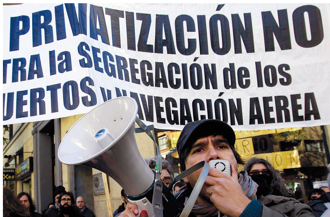
Les coupes annoncées par les gouvernements suscitent la grogne dans la population.