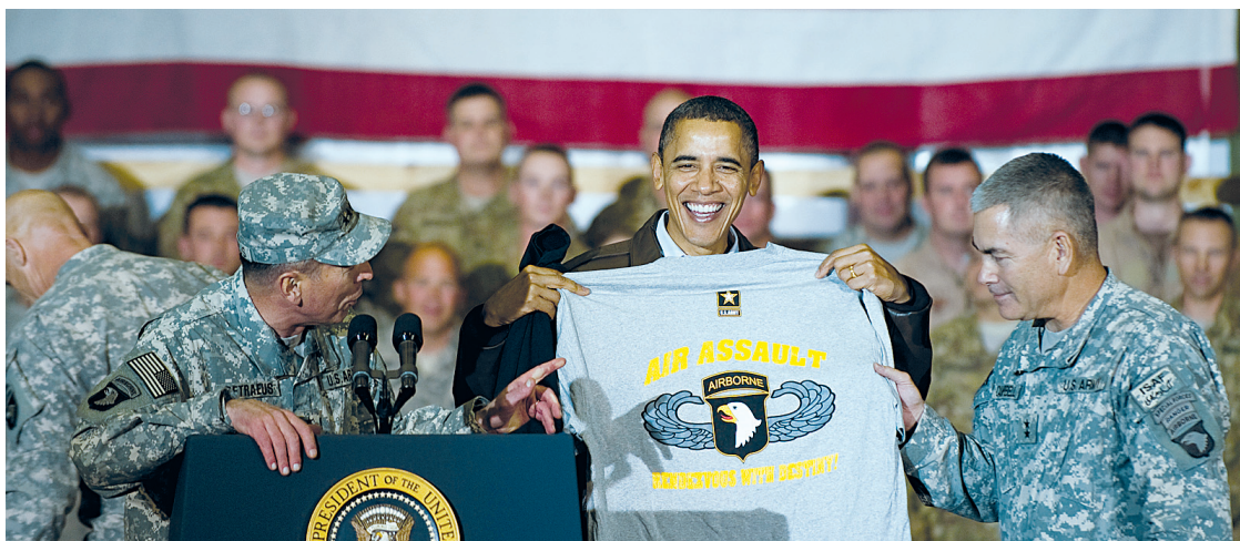
Barack Obama s'est rendu en Afghanistan hier.