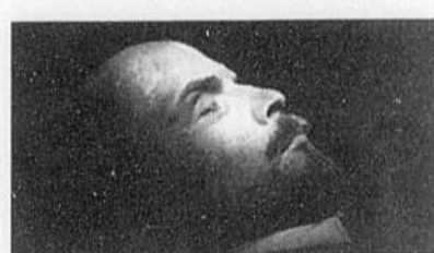
Bientôt dans tous les bons magasins.

Il a signé un accord avec une entreprise de pompes funèbres, «Services rituels», pour proposer aux particuliers toutes sortes de prestations, y compris l'embaumement. «Outre le corps de son client le plus fameux, l'institut a à son palmarès d'autres communistes célèbres comme Ho Chi Minh, Klement Gottwald et Agostinho Neto», ajoute Tass.