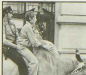
«Ma femme est dingue»