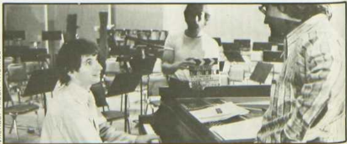
Michael Tilson Thomas