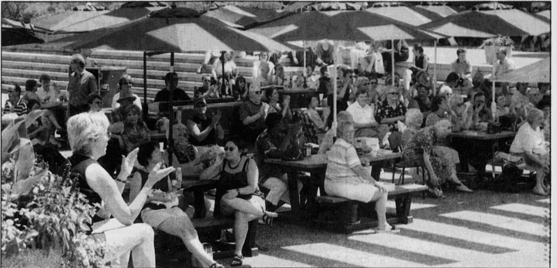
En tout et pour tout, quelque 12 000 personnes ont assisté aux 25 spectacles de la Place de la cité, cet été à Sherbrooke. L'achalandage des Concerts midi a notamment grimpé considérablement. Hier, quelques centaines de flâneurs se sont pointés au dernier spectacle de la série, donné par la formation Must B Blues.