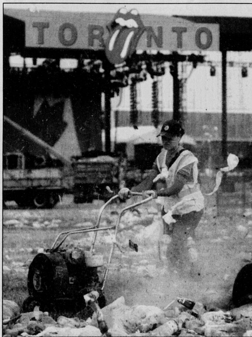
Environ 120 travailleurs avaient la lourde tâche, hier, de ramasser la mer de papiers, de bouteilles vides, de couvertures et d'autres déchets éparpillés sur le site de l'ancienne base militaire transformée en salle de spectacle à ciel ouvert, pour le mégaconcert des Rolling Stones à Toronto. Comme le démontre la photo, les travailleurs utilisent surtout des aspirateurs et des machines à vent pour ramasser et transporter les déchets.